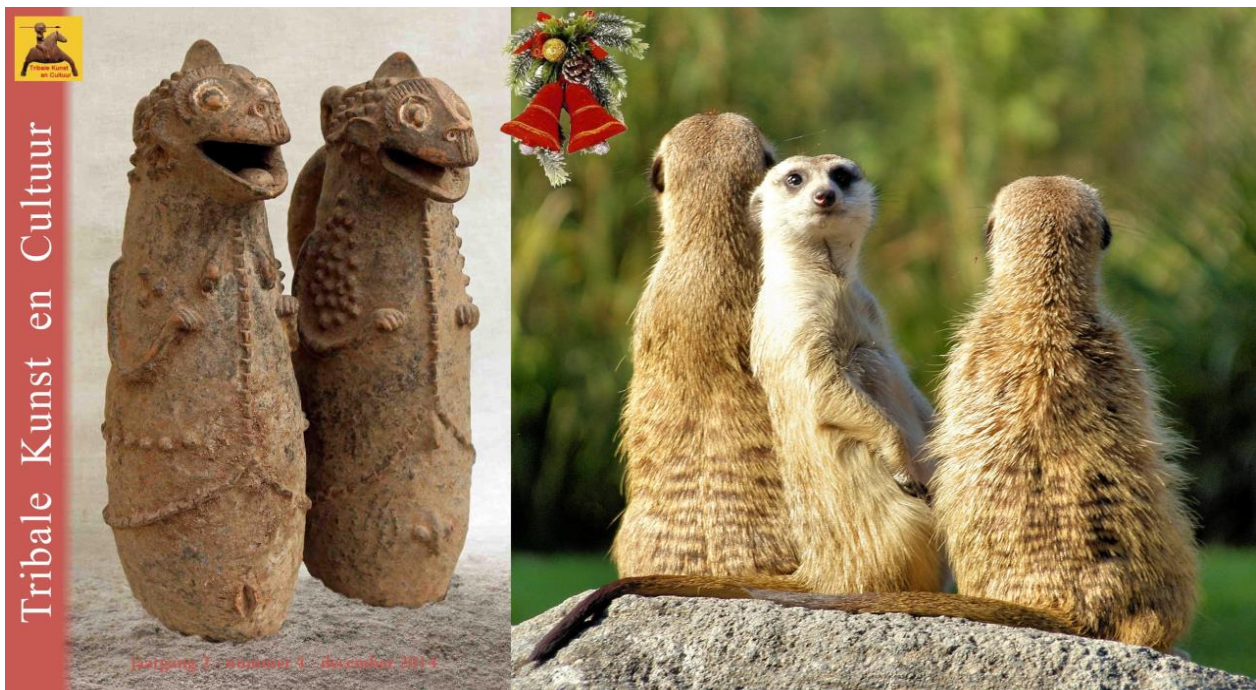
Links: cover van decembernummer, Mambila terracotta figuren in de vorm van soort ‘stokstaartjes’