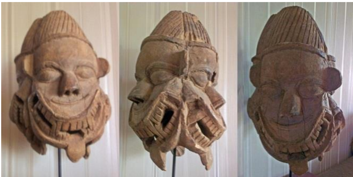
Janus-masker, afkomstig uit ? India ?