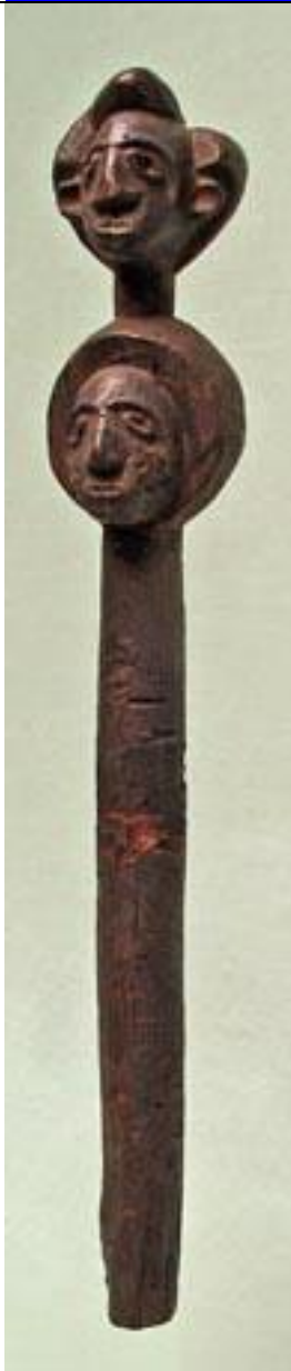
onbekend stafje –h38