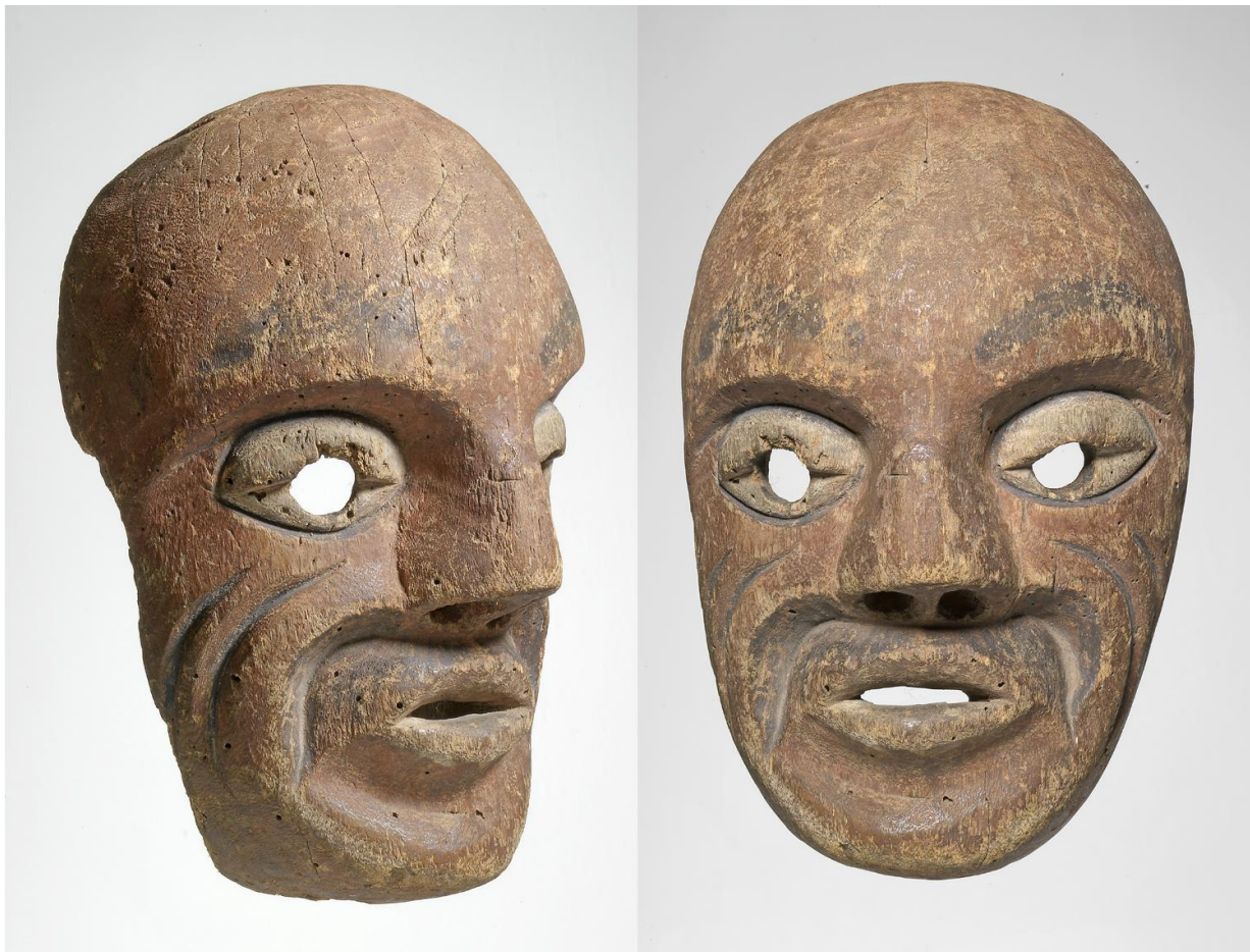
Masker van de Westkust van British Columbia / South East Alaska : van de Haida, Tlinglit of Nootka ?

Reacties svp sturen naar gienusart@gmail.com