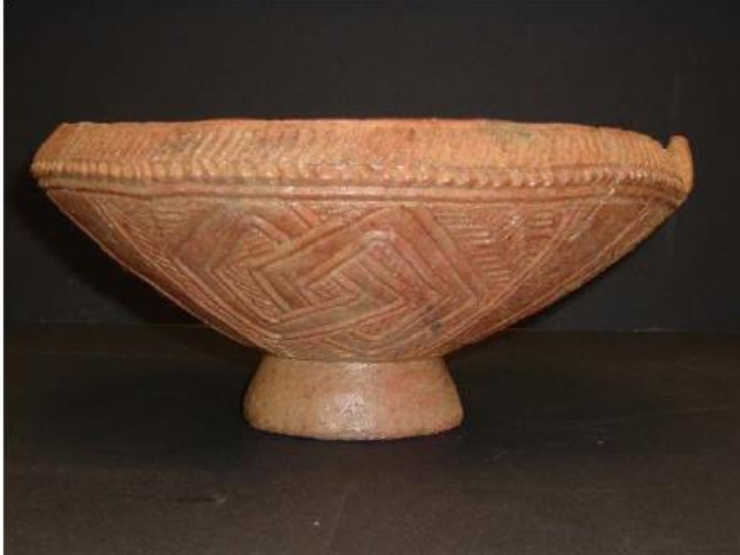
Figure 1.2 Terracotta bowl from Okang Mbang, near Calabar, Cross River State, Nigeria. D. 29.2 cm. H. 14.5 cm.

Dit betreft een dissertatie over aardewerk in Nigeria en Kameroen met vele foto's - 386 pagina's Iconography and Continuity in West Africa: Calabar Terracottas and the Arts of the Cross River Region of Nigeria/Cameroon - Christopher Lawrence Slogar, Doctor of Philosophy, 2005