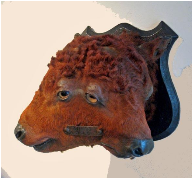
Twee maal Gemummificeerde 'Transformatie'. Ook voor zulke morbide objecten zijn verzamelaars te vinden. (foto's & tekst MH)

Bij Galerie CA&JE Finch was dit dubbelkoppige kalf te zien – curieus, dat een 'tribal-art galerie' dit op zo'n prominente plek hangt, maar het zegt ook wel wat over onze eigen cultuur, de westerse hang naar het verzamelen van curiosa: 'het rariteiten-kabinet', of zoals de Duitsers zeggen, 'der Wunderkammer'.