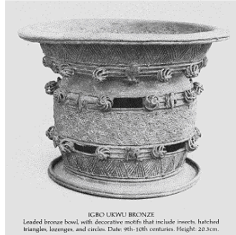
ICBO UKWU BRONZE Leaded bronze bowl, with decorative motifs that include insects, hatched triangles, lozenges, and circles. Date: 9th-10th centuries. Height: 20.3cm.