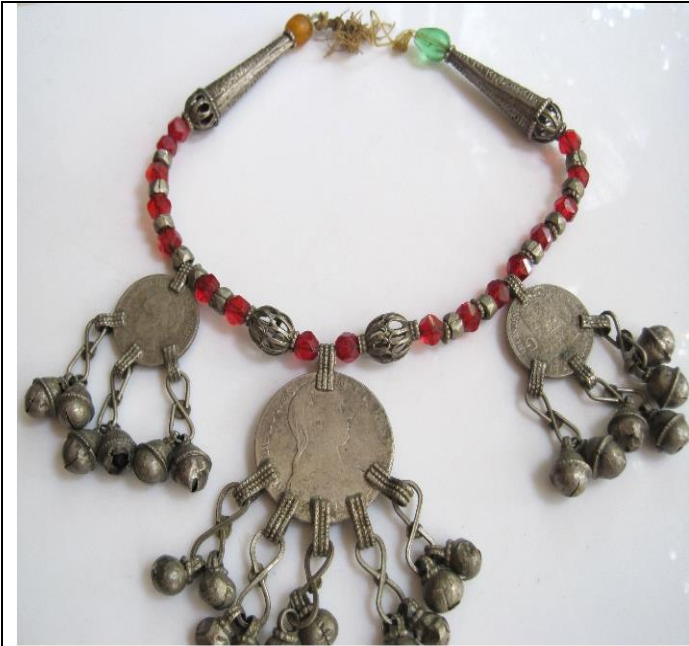
sieraad uit Yemen, gemaakt van Maria Theresia thaler Rechts : Luba vrouw met vruchtbaarheids-amulet en kralen-halssnoer.