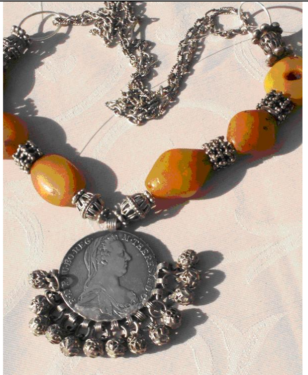
Ethiopisch halskruis van Maria Theresia thaler en sieraad uit Yemen