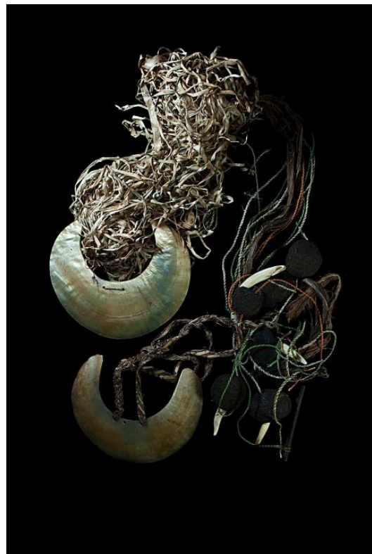
Crescent Pearlshell Pendant (Torres Strait Style) danga mai

Money is something that we take for granted but have difficulty in defining exactly. A very simple description could be that money is something in which payments can be made, is used as a store of value and is a measure of worth. The items in this book have many other attributes. Some contain spirits or can be used to commune with the dead, others are required in ceremonies of birth, death and marriage. They are gifts to the gods and show a man's status in society. Most of the people of the Torres Strait and Papuan Gulf were headhunters and many were cannibals with sea-going warriors roaming the coasts and islands in the search of heads, spoils of war and trade. But even headhunters needed money - this book shows some of the wealth items that they used 80 pgs