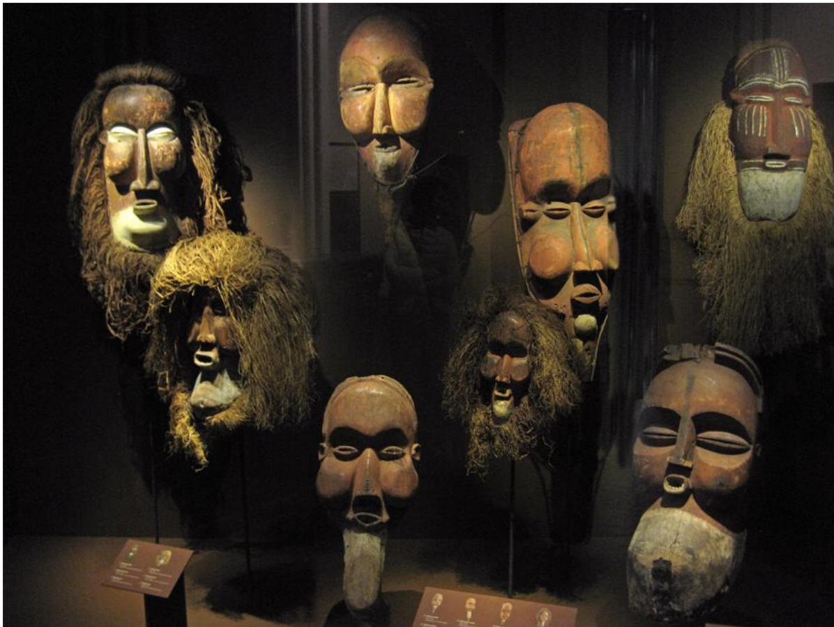
Reuzemaskers van Yaka en Suku, wel een meter hoog – initiatie.

daaruit, omdat deze een groot beeld van een barende Tsaam-vrouw toont. Voor wie het artikel 'Baring en Geboorte' (TK&C maart 2013) gelezen heeft en dus weet hoe spaarzaam barenden in Afrika zijn afgebeeld, is dit beeld een opsteeker. En ook hier weer: achterhoofd van het kind achter, een ook in Afrika ongebruikelijke geboorte, maar kennelijk leuker omdat de baby de moeder (en ons) aankijkt.