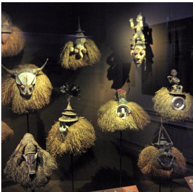
Wel 28 verschillende Yaka en Suku masker bijeen.