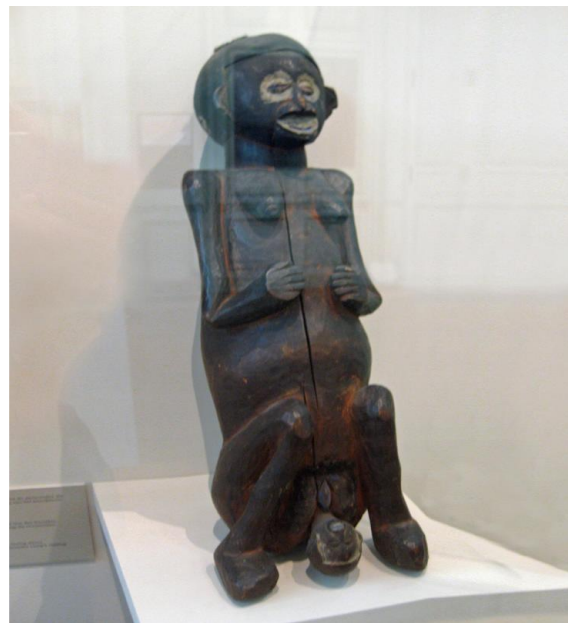
Barende vrouw vd Tsaam, h ca 70 cm

Mocht je geen belangstelling hebben voor deze Nieuwsbrief van de Vereniging Tribale Kunst en Cultuur, meld dat dan graag bij < gienusart@gmail.com > zodat we je kunnen uitschrijven uit ons bestand.