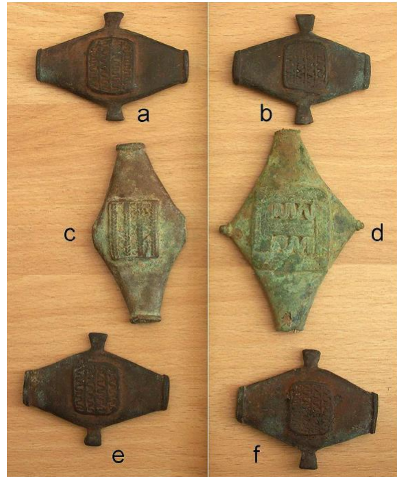
Fig. 2. Jenné bronze rhomboids. Major axis dimensions are a, 8.3 cm; b, 7.6 cm; c, 9.8 cm; d, 10.9 cm; e, 8.0 cm; f, 7.7 cm.