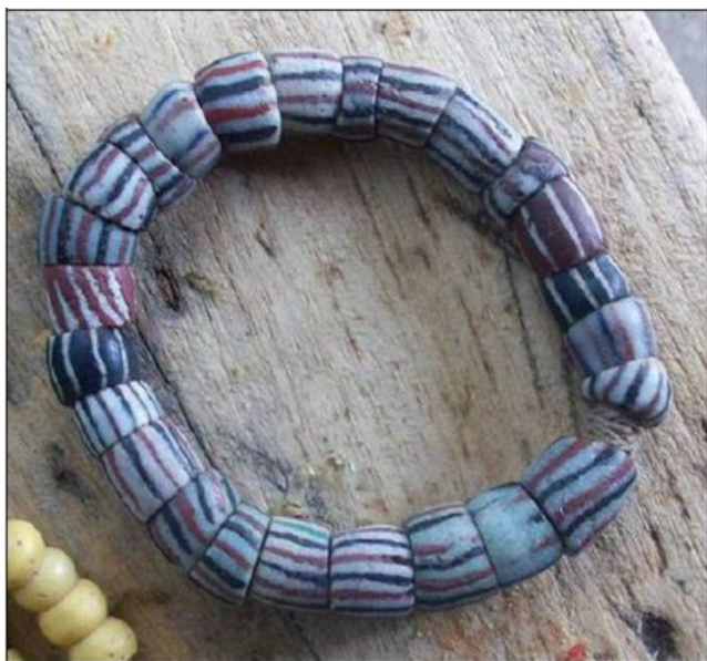
Plate 4: A grey powa