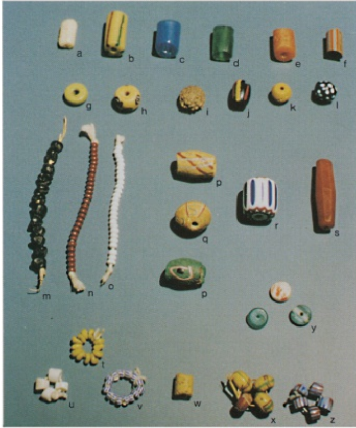
Plate III.C. Togo: Beads utilized in the voodoo cult of Togo:

14 pagina's pdf 17,5Mb, publicatie van de Beadsociety