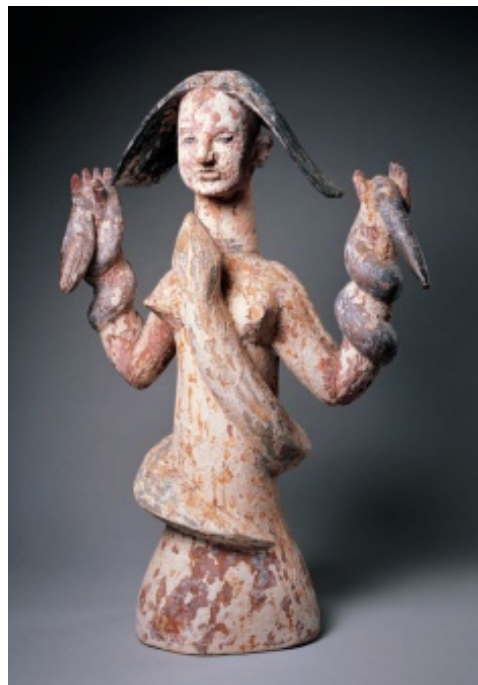
Mami Wata shrine figure

http://server2.docfoc.us/uploads/Z2015/12/24/63PLSCnE4B/82e33a4fb67a112ae27449709d7d38c6.pdf pdf 27 pag