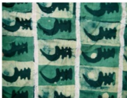
Plate 49: shows stylized Akoben symbol arranged in a full drop formation with an alternating colour blocks at the background: - from the catalogue of cultures by Ekow Asmah -2006 - unpublished