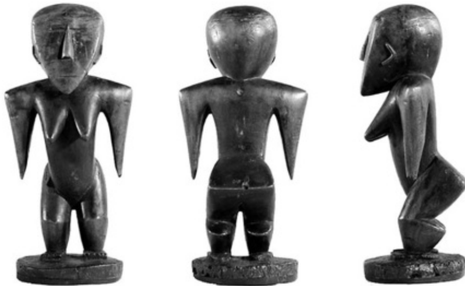
Figure 2. Wooden Figure 2, Tonga. Auckland Museum, No. 32652.