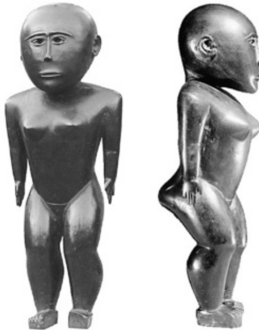
Figure 5. Wooden Figure 5, Tonga. Field Museum, Chicago, No. 274478.

Footprints is de nieuwsbrief van de Vereniging Tribale Kunst en Cultuur en wordt 11 keer per jaar aan de leden verzonden. De vereniging is ingeschreven bij de KvK nummer 68755104. Niet-leden kunnen een gratis abonnement op deze nieuwsbrief krijgen door een mail te sturen naar tribalekunstencultuur@gmail.com Voor €35,00 per jaar bent je lid en ontvang je ook ons kwartaalblad. http://www.tribalekunstencultuur.org/abonnement--lidmaatschap.html