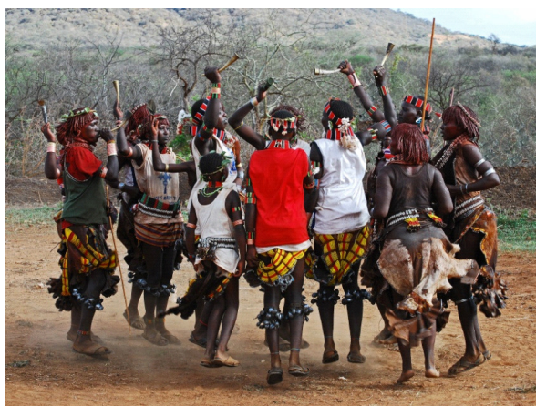
dansende Hamar/ Omovallei / Ethiopië

- tm 21 april 2013 Afrika Museum Berg en Dal : “Faces of Afrika”. In 2011 reisde fotograaf Mario Marino (Oostenrijk, 1967) naar de Omo vallei in Zuid-Ethiopië, nabij de grens tussen Kenia en Soedan. Zijn ontmoetingen op straat en op de markt resulteerde in een indrukwekkende serie portretten van mensen die behoren tot zeven kleine bevolkingsgroepen: Surma, Karo, Hamar, Borena-Oromo, Tsimaw, Mursi en Erbore.