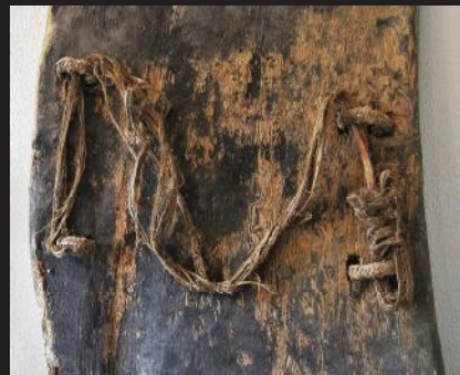
Het handvat is gemaakt van plantaardige vezels.