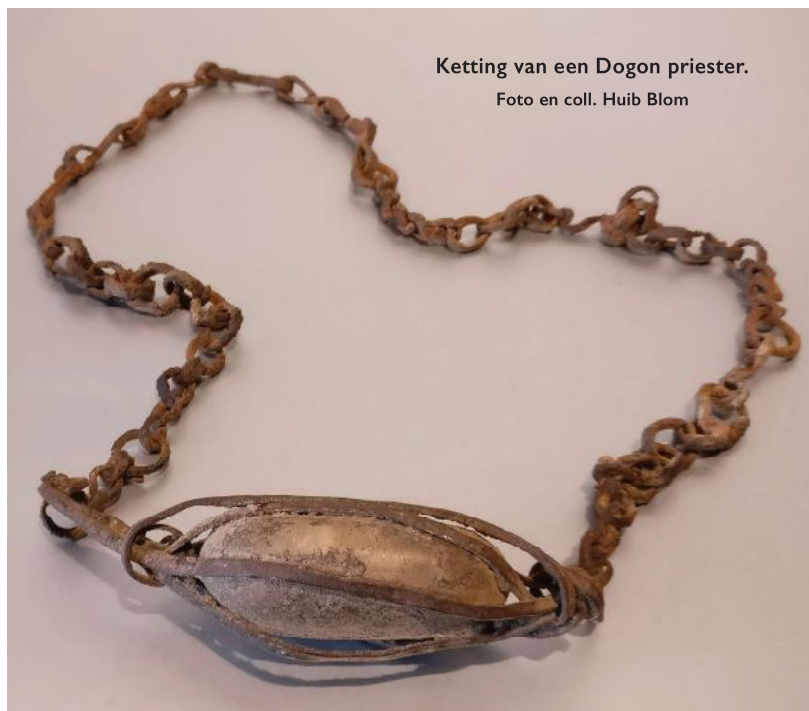
Ketting van een Dogon priester.