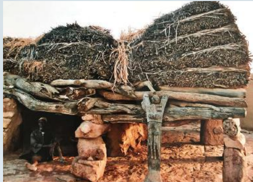
Een Toguna, mannenhuis.

In 2005 maakten we een prachtige reis door Mali. In het Dogon-gebied kochten we een ketting en een fetisj, die volgens de man die ze ons verkocht, gebruikt zijn door een hogon, de geestelijk leider van de Dogon.