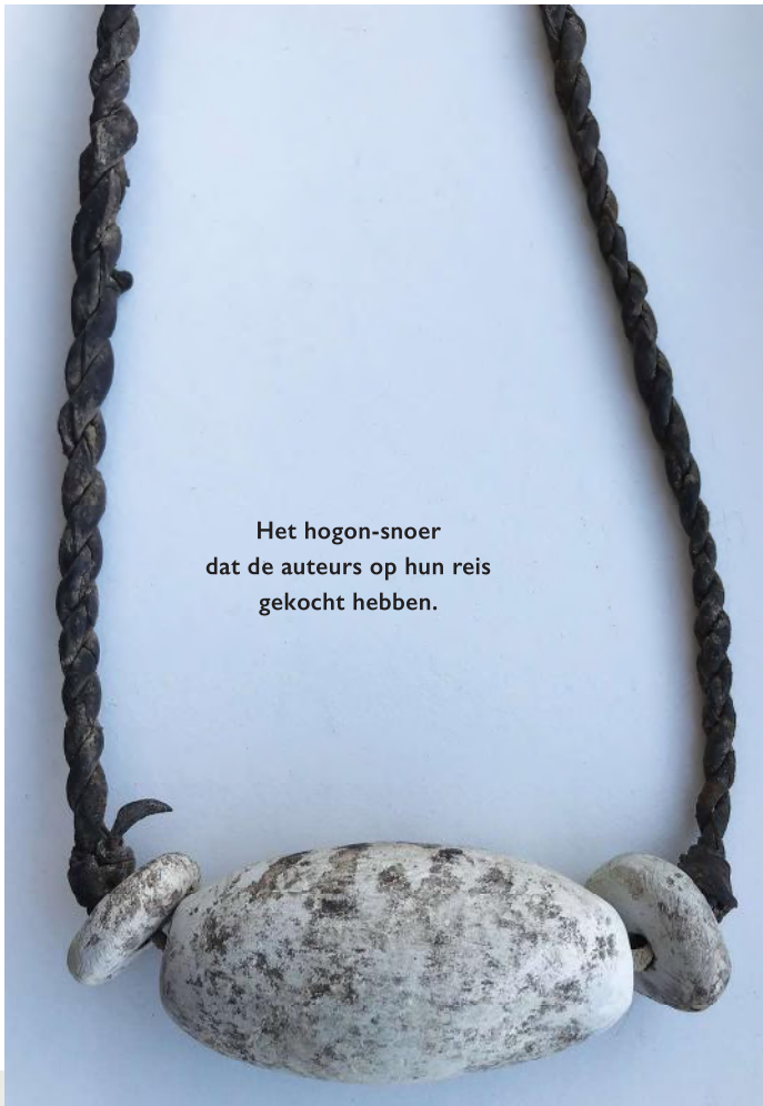
Het hogon-snoer dat de auteurs op hun reis gekocht hebben.