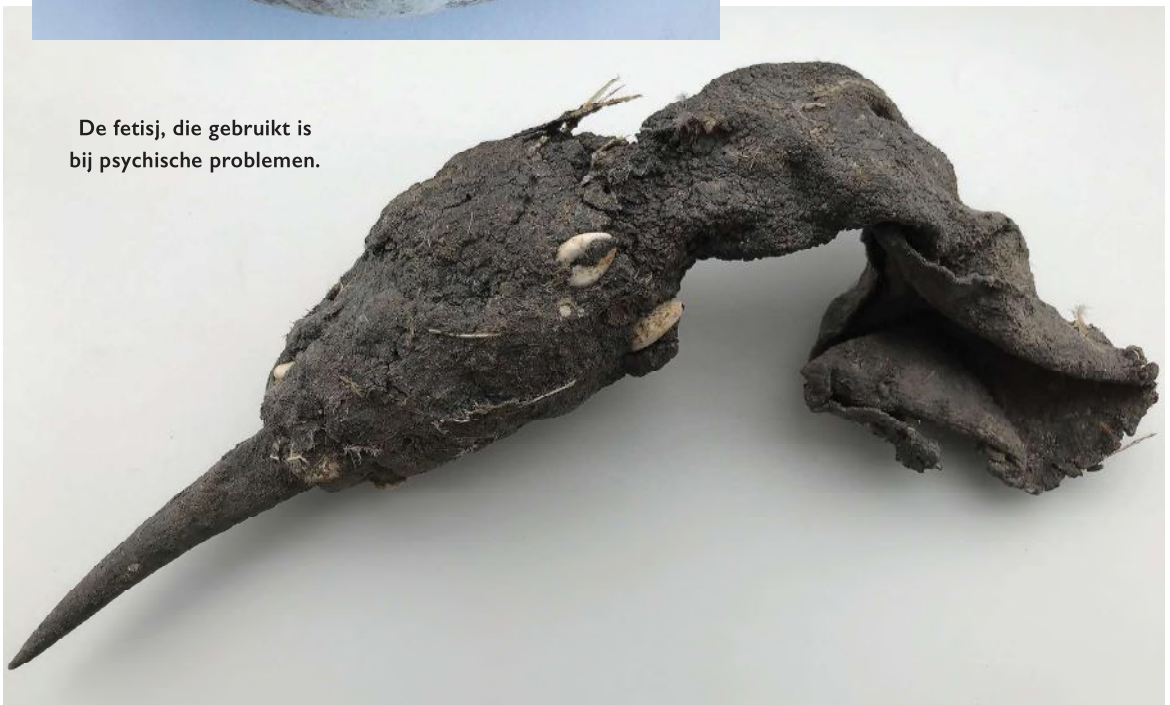
De fetisj, die gebruikt is bij psychische problemen.

geraadpleegd maart 2021 https://www.encyclopedia.com/humanities/news-wires-white-papers-and-books/lebe American Geographical Society (//americangeo.org), 2016