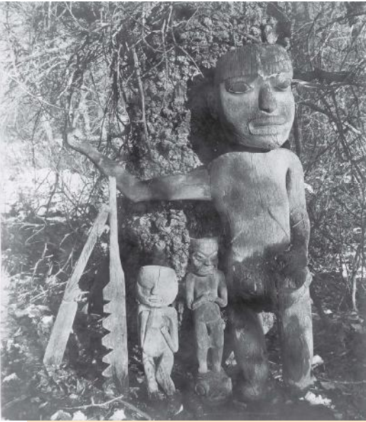
Linksboven: Een begraafhuis van een ixt met op de voorgrond beelden van zijn geesthelpers, Chilkat clan Alaska.

Library of Congress, foto Winter & Pond, 1895