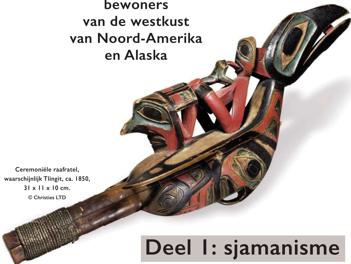
Ceremoniële raafratel, waarschijnlijk Tlingit, ca. 1850, 31 x 11 x 10 cm.

de oorspronkelijke bewoners van de westkust van Noord-Amerika en Alaska