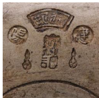
De ingedrukte merktekens.