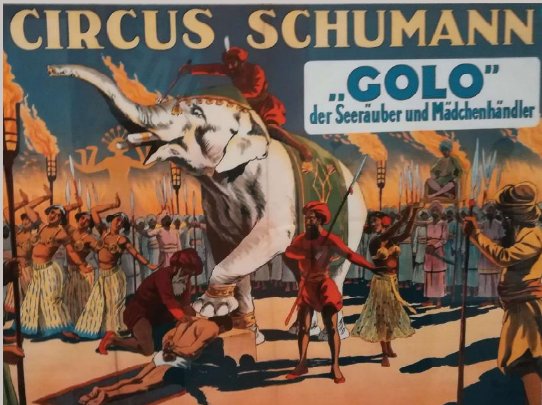
Een affiche van Circus Schumann, begin 19e eeuw. Een tijdsbeeld ...