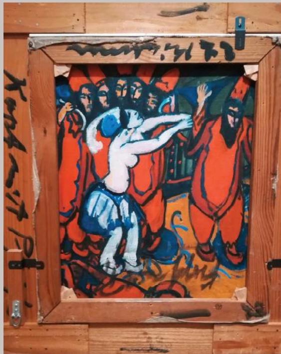
Ernst L. Kirchner, Circus scene, 1911, Coll. Brücke Museum, Berlin

Nolde daarentegen heeft Duits-Nieuw-Guinea bezocht. In zijn werk uit 1913 en 1914 laat hij indrukken van deze reis zien. Nolde voelde zich al vroeg aangetrokken tot het nationaalsocialisme van Duitsland. Hij bleek een antisemiet die bijvoorbeeld joodse kunsthandelaars en schilders in diskrediet bracht. Hij overlijdt in 1956. De werken van deze kunstenaars werden in de tijd van het nationaalsocialisme in Duitsland niet gewaardeerd, belachelijk gemaakt en als 'Entartete Kunst' beschouwd.