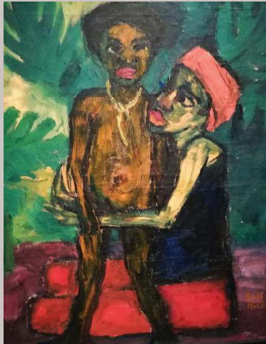
Emil Nolde, Moeder en zoon, 1913-1914