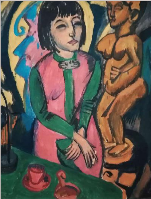
Ernst L. Kirchner, Zittende vrouw met houtsculptuur, 1912, Coll. Virginia Museum of Fine Arts