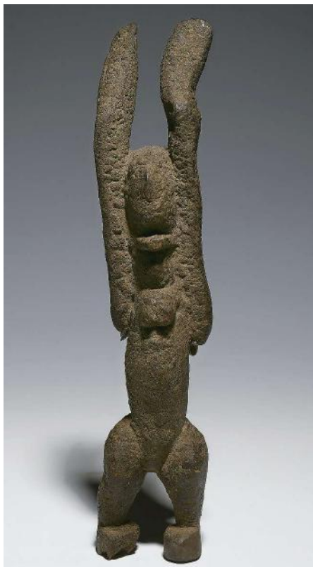
De 'regenbeelden' met geheven armen en dikke offerlaag worden toegeschreven aan de Tellem, maar zijn mogelijks (ook?) van de Djeneké.

Oorspronkelijk was de mens onsterfelijk, maar dit veranderde door de acties van Ogo. Hij werd sterfelijk en moest zich dus kunnen voortplanten. Daarvoor heeft hij zijn acht zielen. Na de dood keren de lichaamszielen terug naar Amma waar ze zullen waken over de nakome-