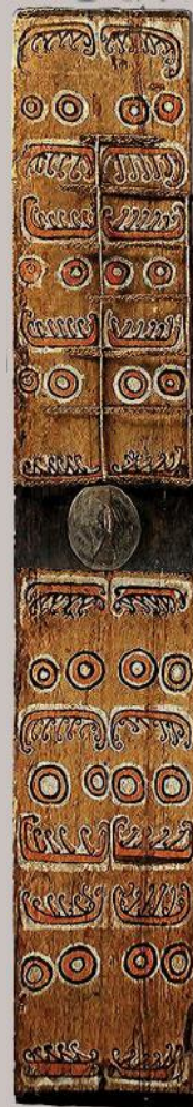
Een schild van 180 x 30 cm ook uit het gebied van de Geelvinkbaai, maar zonder nadere plaatsaanduiding. Dit schild laat een versiering van cirkels en prauwmotieven zien.