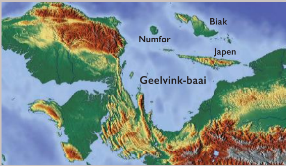
Het westelijk deel van Nieuw-Guinea, de Vogelkop, met de Geelvinkbaai. In het noordelijk deel van de baai liggen de drie grootste eilanden Biak, Numfor en Japen