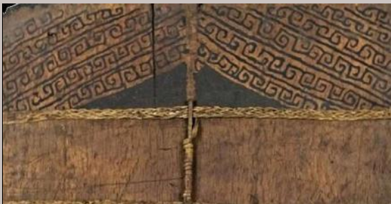
Detail van de bovenzijde van het schild van het eiland Numfor. Soortgelijke versiering komt ook op het midden-deel en aan de onderkant van het schild voor. Tevens is goed te zien dat de verticale strips omwonden zijn met (mogelijk) rotan.