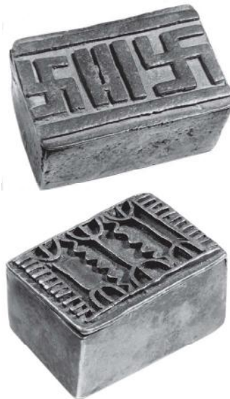
Oude geometrische goudgewichten, coll. NMVW, AHDRC 0051873 en 0051875.

Garrard (1980, p.195-201) probeerde de betekenis van goudgewichten ook te onthullen, maar hij moest concluderen: “Oude mannen en vrouwen kunnen eindeloze informatie geven over de figuurlijke gewichten die vaak worden herkend als traditionele symbolen en spreekwoorden. ... Aan de andere kant kennen ze zelden betekenis toe aan geometrische ontwerpen; zoals een Brong-