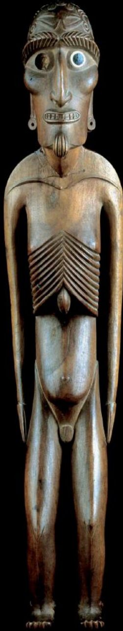
Moia kavakava , voor 1827. h 44 cm.