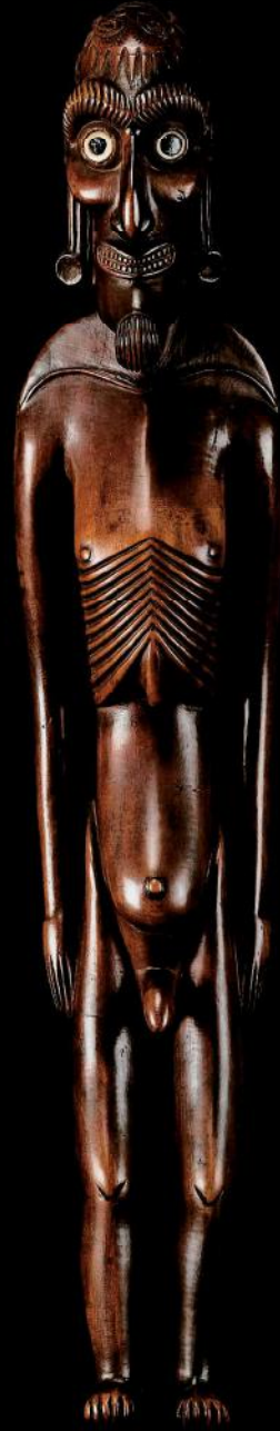
Moia kavakava, voor 1886 h 45 cm.