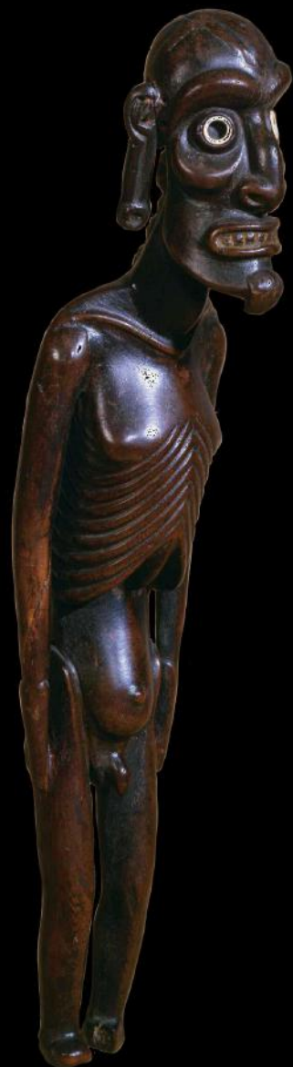
Moia kavakava, voor 1886. h 36 cm, 410 gram. Rechteroog mist inleg van obsidiaan.