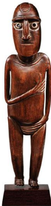
Moai papa, 41 cm hoog.