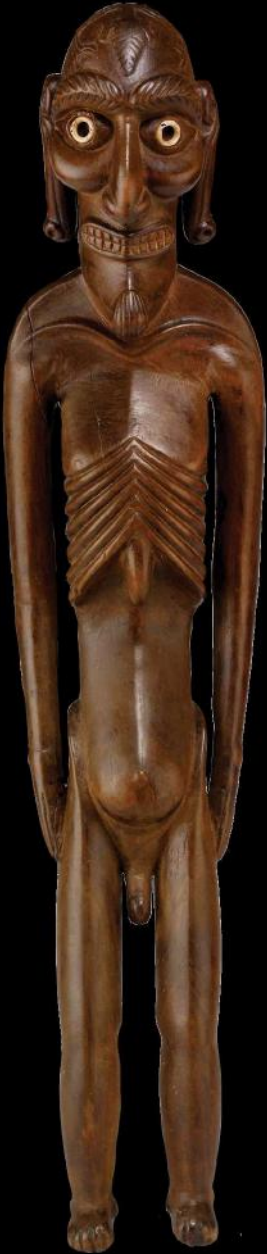
Moia kavakava, voor 1827, h 43 cm, 500 gram.