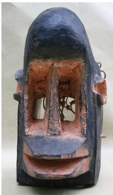
Het kopstuk van een apenmasker. Komakan 1989.

Een Dogon beeld vertegenwoordigt dus in principe een levende tegenover een grillige bovennatuur, maar kan als object veel langer meegaan dan de aanleiding ervan. Wanneer de vrouw inderdaad kinderen heeft gekregen, dankt het beeld Ama voor de nazaten, met als vraag om deze voorspoed te mogen behouden. Na overlijden van de eigenaar gaat het beeld naar de zoon, die bij zijn eigen offers de afbeelding van zijn vader of moeder ‘mee laat eten’. Zo blijven deze beelden verbonden aan het altaar en vertegenwoordigen ze nu de overledene; de wensen van de zoon verschillen trouwens niet zo veel van die van zijn vader, dus de pose blijft relevant. Met een volgende generatie wordt het beeld steeds meer een voorouderbeeld, maar dan alleen een voorouder voor die familie; oer-voorouder zijn niet zo belangrijk in Afrika.