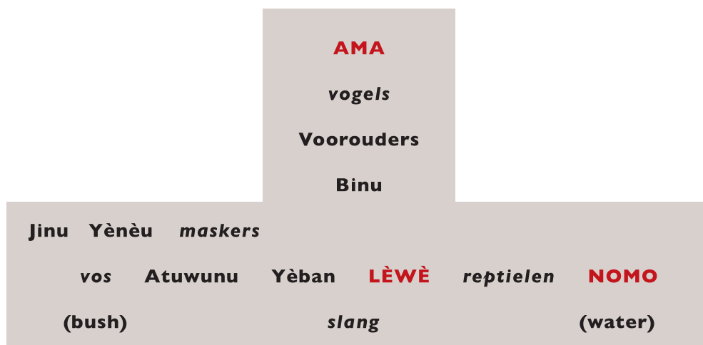
Schema van de andere wereld van de Dogon.

In mijn vorige artikel heb ik laten zien dat de kosmogonische mythen van de Dogon niet bekend zijn bij de Dogon zelf, maar constructies zijn van de vroege Franse etnologen. Die prachtige verhalen vertellen dus niets over de betekenis van de Dogon kunst, en zo rijst de vraag hoe we hun beelden en maskers dan wel moeten interpreteren.