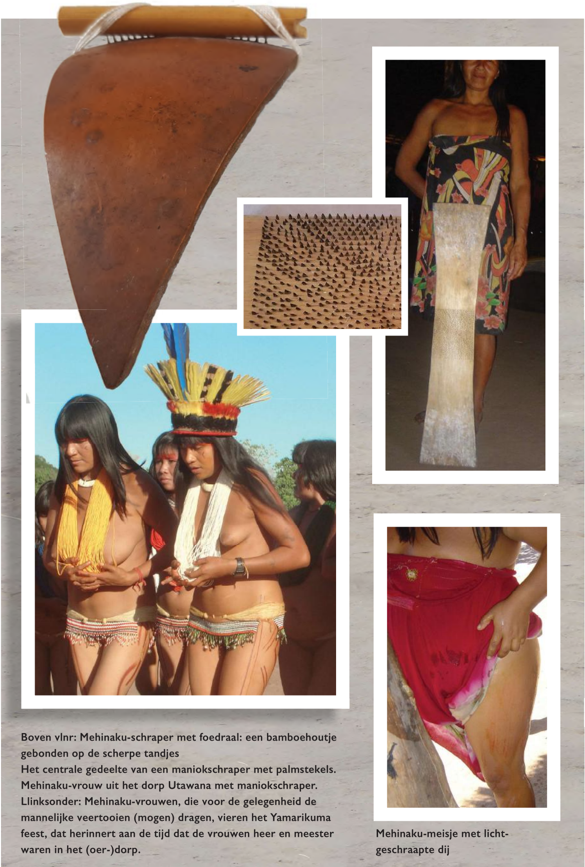
Boven vlnr: Mihinaku-schraper met foedraal: een bamboehoutje gebonden op de scherpe tandjes Het centrale gedeelte van een maniokschraper met palmstekels. Mihinaku-vrouw uit het dorp Utawana met maniokschraper. Linksonder: Mihinaku-vrouwen, die voor de gelegenheid de mannelijke veertooien (mogen) dragen, vieren het Yamarikuma feest, dat herinnert aan de tijd dat de vrouwen heer en meester waren in het (oer-)dorp.