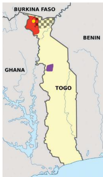
Kaart van Togo met het leefgebied van de Moba (rood) en Gurma (geblokt), de Bassar/Bandjéli-regio (paars) en de plaats Dapaong (oranje stip).