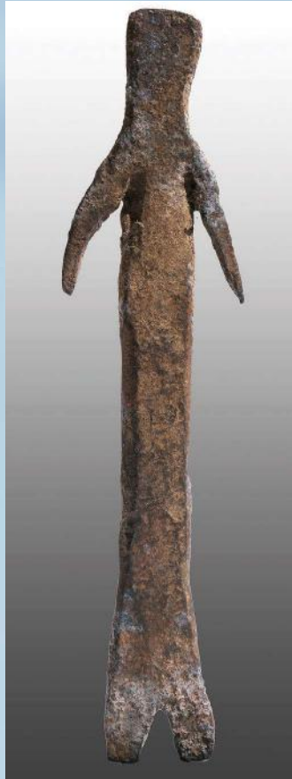
Alle afgebeelde figuren komen uit de collecties van de auteurs

In het vorige nummer van Tribale Kunst stond een bijdrage over houten en ivoren figuren van de Moba. Veel minder bekend zijn de ijzeren figuren. Pas recent konden we kennisnemen van hun bestaan. In 1991 werden enkele exemplaren in een tentoonstelling in Parijs aan het publiek getoond. Tijd dus om wat dieper in te gaan op hun vormen en betekenissen.