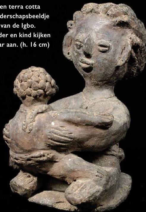
Een terra cotta moederschapsbeeldje van de Igbo. Moeder en kind kijken elkaar aan. (h. 16 cm)