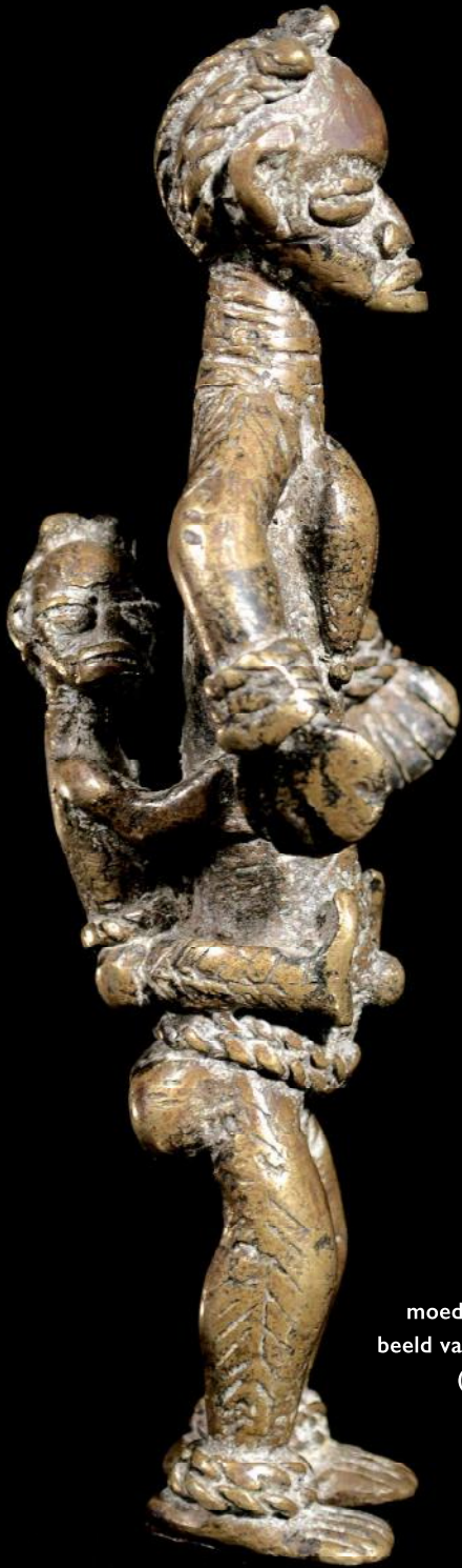
Bronzen moederschaps- beeld van de Dan. (h. 16 cm)

de evocatie van een toekomstige moeder die alle aandacht verdient.