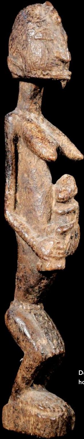
Dogon, mali, hout, h. 24 cm