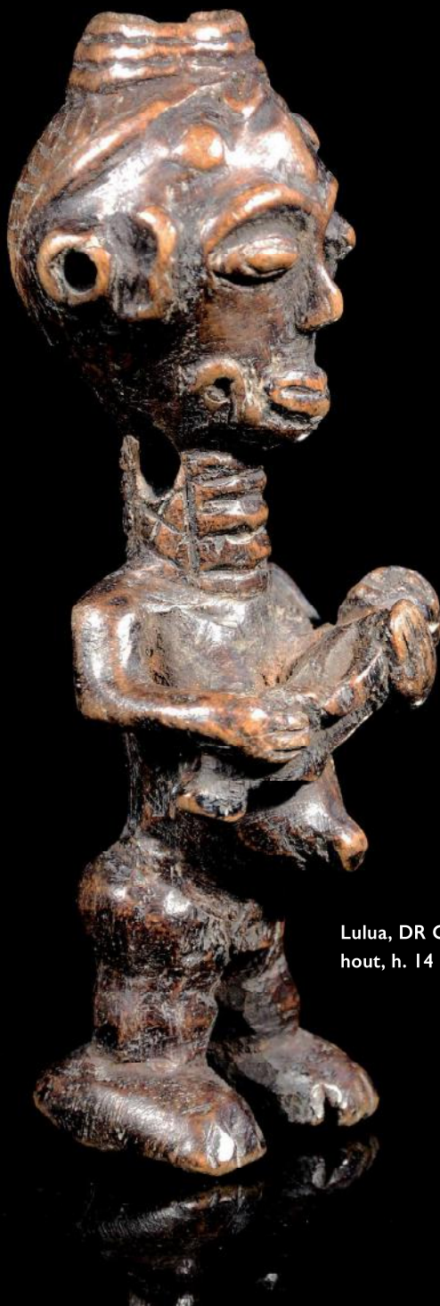
Lulua, DR Congo, hout, h. 14 cm