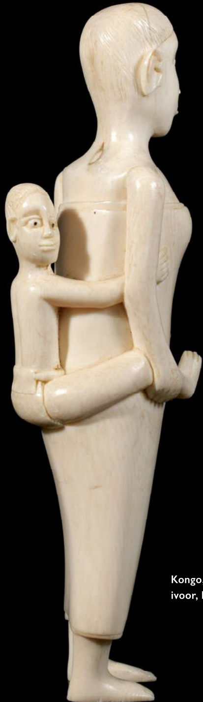
Kongo, DR Congo, ivoor, h. 20 cm