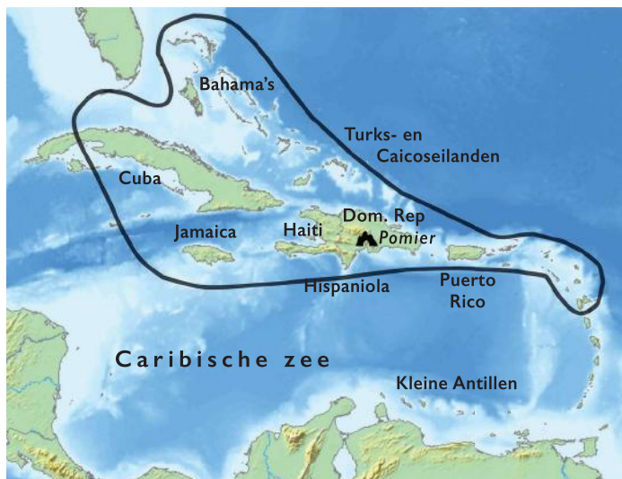
De Caribische Zee met de eilanden waar de Taino gewoond hebben.

De Taino zouden zich niet tegen de bekering verzetten, maar wel tegen het doorzoeken van hun dorpen op goud en edelstenen en het platbranden van hun dorpen als strafmaatregel bij pro-