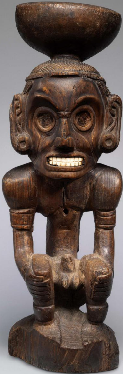
Godenbeeld of zemí, Taino, waarschijnlijk Dominicaanse Republiek, ca. 1000 n.Chr., guaiacum hout en schelp, h 68,5 cm. Coll. The Metropolitan Museum of Art, New York.