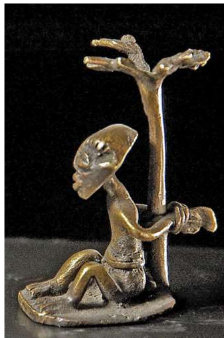
afb 20 - Ashanti brons, 4,5 cm