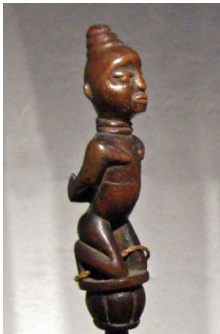
afb 19 - Kongo, hout, ca.h 10 cm

2 Bijna identieke voorstellingen zie je terug in afb 24 ook in steen, en afb 25 in ivoor, beide uit dezelfde regio. Hier lijkt meer aan de hand te zijn dan vrijheidsbelemmering, dit doet toch meer denken aan knevelen als vorm van lijfstraf, en in strikte zin