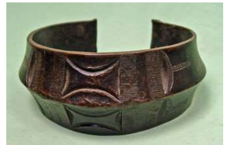
afb 9 - Fang brons, h 7 cm

In Europa worden meerdere typen metalen banden ‘slavenband’ genoemd, die daar echter weinig mee van doen hebben. Meestal betreft het hier gewone westerse sieraden. Maar zelfs de zware Fang ‘slavenband’ (afb 9) die bij ons thuis een ereplekje had, zal veeleer een monetaire functie gehad hebben, zoals zoveel groot Afrikaans ‘metaalgeld’. Als kind probeerden we deze wel eens om onze nekjes te wringen om te voelen ‘hoe dat was om slaaf te zijn’.