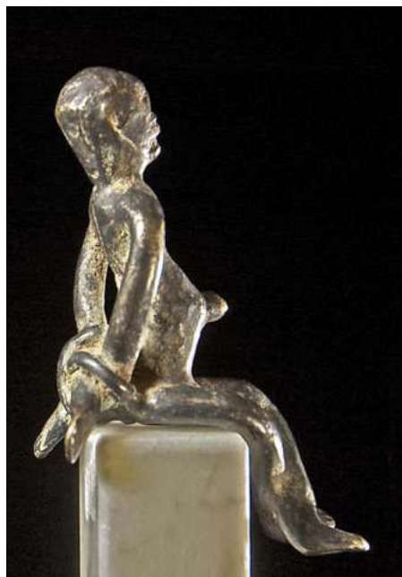
afb 12 - Gan (?) brons, h 7 cm