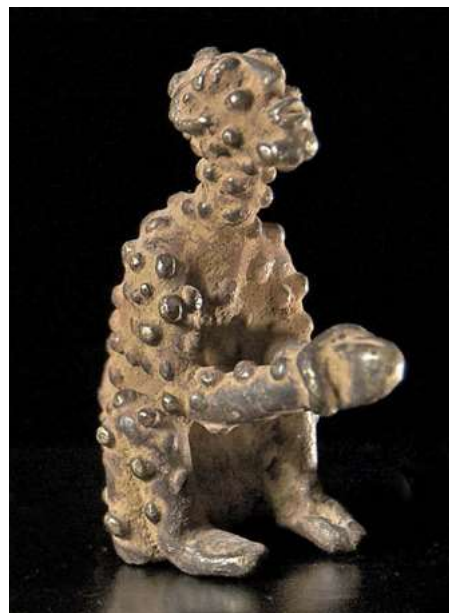
afb 22 - Djenne brons, 6,5 cm - pestbuilen

Als laatste volgt, ook weer uit de Congo, de volgende interessante hardstenen afbeelding van een paar-tje, man en vrouw die naast elkaar zitten en naar elkaar toe neigen (afb 26). Een romantisch tafereel, tot je beter kijkt en ziet wat, of liever gezegd wie er onder hun voeten ligt. Het betreft hier kennelijk hooggeplaatste