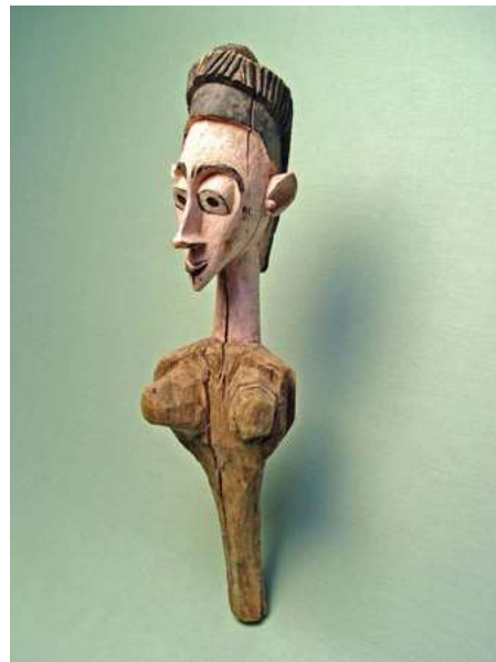
afb 3 - Bozo 'Peulvrouw', h 82 cm

kusten, donker gekleurde Berbers die legio blanke (christen)slaven buit hebben gemaakt (een getal van ruim 1 miljoen wordt geschat) [8]. Ook kun je kijken naar Europese ‘heren’ met Europese lijfeigenen. Maar ook dien je te kijken naar zwarte Afrikaanse ‘heren’ met evenzo zwarte slaven voor eigen ‘gebruik’, wat onder andere bij de Ashanti gemeengoed was. Overigens was slavernij soms ook een eigen keuze, een soort statuut waar in ruil voor bescherming door ‘de heer’ aan hem dienstbaarheid en de persoonlijke vrijheid werden aangeboden, een beetje vergelijkbaar met onze middeleeuwse lijfeigenschap. Slaven werden bovendien lang niet altijd slecht behandeld, en bereikten in sommige culturen zelfs een soort familiale status. Daarin bracht bv een zieke zwakke slaaf meer last dan voordeel, wat (i.t.t. zulke situaties in het Rhemrev rapport) ook geaccepteerd werd. In scherp contrast met zulke meer ‘gesocialiseerde’ vormen van slavernij staat de puur profijtelijke vorm. Vanuit een soms min of meer ‘sociale’ lokale slavernij werden de slaven door hun ‘heren’ voor profijt verkocht naar een westers systeem waarin slechts economische wetten golden. De vraag ging het aanbod beheersen, en zonder de lokale ‘heren’ zou ‘onze’ slavenhandel