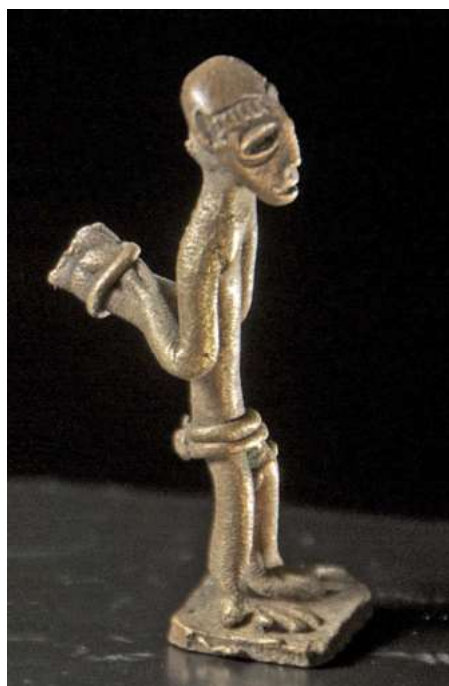
afb 14 - Ashanti brons, h 6 cm