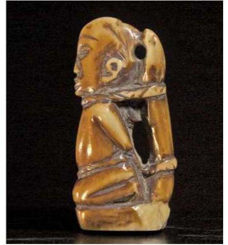
Afb 25 - Kongo ivoor, h 6 cm