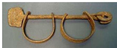
afb 6 - enkelboeien ijzer, L 30 cm

Naast deze gevorkte balk, die bijna symbolisch is geworden voor ‘slavernij’, zijn er nog enkele voorwerpen met een vergelijkbaar markante functie. Ten eerste zijn daar de enkelboeien, die in de loop der eeuwen hun basisvorm hebben behouden (afb 6), zoals je deze ook wel kunt tegenkomen als Ashanti goudgewichtje. Zelf heb ik ze in Mali nog zien gebruiken bij een jonge, psychisch zieke vrouw die bij haar ouders thuis woonde en verzorgd werd, maar daar niet weg mocht lopen.