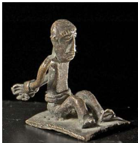
afb 13 - Ashanti brons, h 4 cm