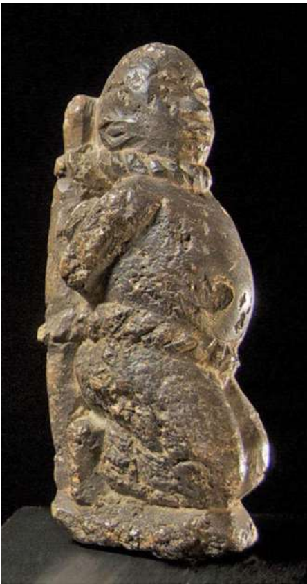
afb 24 - Kongo steen, h 15 cm

persoon veel kleiner is afgebeeld dan het koppel is in Afrikaanse termen heel begrijpelijk door de relatieve 'onbelangrijkheid' van deze liggende figuur ten opzichte van de zittende. Het blijft 'interpreteren', maar met de nodige kennis van het huidige Afrika kom je toch een heel eind.