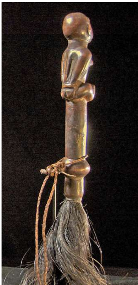
afb 18 - Kongo, vliegenkwast, h 16

Met deze voorbeelden wordt ook duidelijk, dat waar ik spreek over slaven, het evenzeer slavinnen betreft.