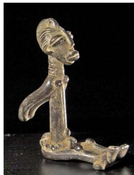
afb 17 - Lobi brons h 8 cm