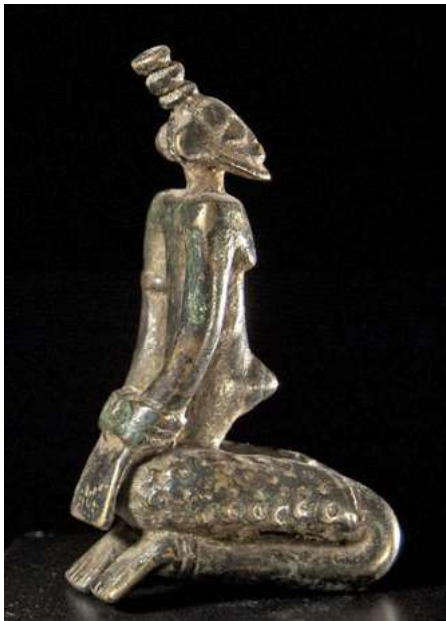
afb 10 - Dogon brons, h 11 cm

De meeste Afrikaanse 'slavenbeelden' tonen een geboeide persoon in staande, zittende of geknielde houding, met de handen of op de rug gebonden (afb 10 t/m 20), of vooruit (afb 21 & 22). Ook de enkels kunnen gebonden zijn (afb 15 & 16). Aan een boom gebonden blijft er wel heel weinig bewegingsvrijheid over (afb 20).