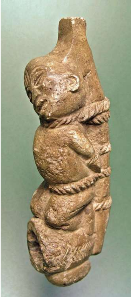
afb 23 - Kongo stenen pijp, h 20 cm