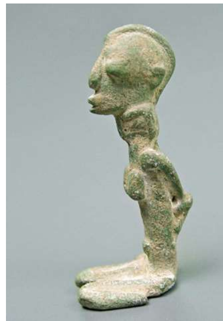
afb 15 - Guimbala brons, h 7 cm