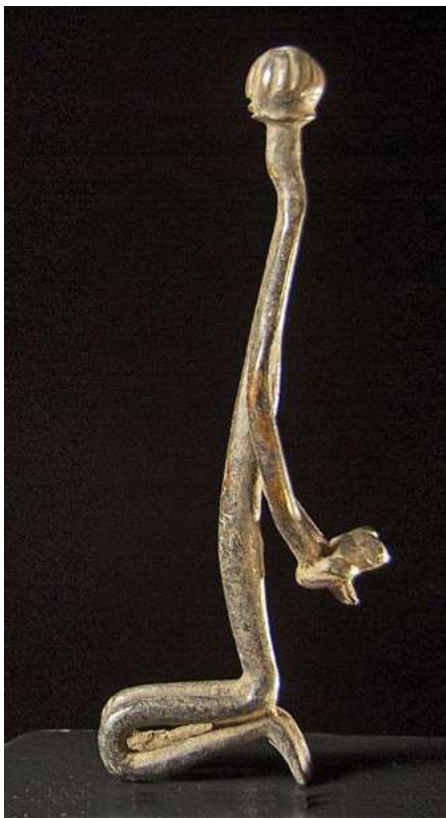
afb 11 - Dogon brons, h 19 cm