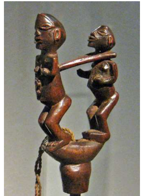
afb 5 - transport, gevorkte balk