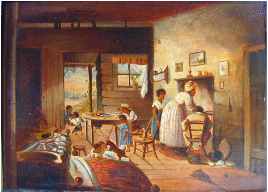
afb 2 - vrijverklaarde slavenfamilie, olieverf, 23x33 cm

De geschiedenis van de slavernij is waarschijnlijk zo oud als de mensheid. De Egyptenaren hadden nooit hun piramides kunnen bouwen zonder een enorm cohort aan slaven. Na de Grieken volgden de Romeinen met een uitgebreid systeem van lijfeigenschap, waarvan ons vooral de arena's en gladiatorenengevechten uit onze geschiedenisboekjes bijblijven. Ook binnen deze oude culturen bestonden grote verschillen in de vormen van slavernij, waarbij de status van de slaaf kon variëren van 'bijna-burger' tot onmenselijk uitgebuite 'dwangslaaf' [7]. Vervolgens de Arabisch/Afrikaanse slavenhandel, die al stamt al uit de 6e eeuw [8]. Dan onze middeleeuwen, met gewone burgers, ridders en hoge heren met lijfeigenen, in een systeem, dat met name in Rusland nog lang heeft voortgewoerd (1861). Zelfs het woord 'slaaf' is afkomstig van de Slavisch sprekende Oost-Europese bevolkingsgroep