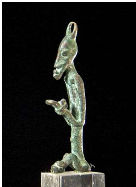
afb 21 - Dogon brons, h 6 cm

vallen deze beelden dan ook niet meer onder de noemer 'slavenbeelden'. Wat bepaald niet wil zeggen, dat lijfstraffen voor slaven ongebruikelijk waren.