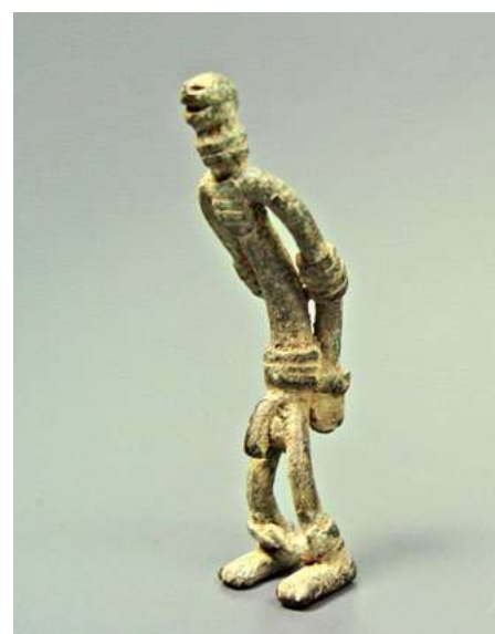
afb 16 - Guimbala brons, h 7 cm