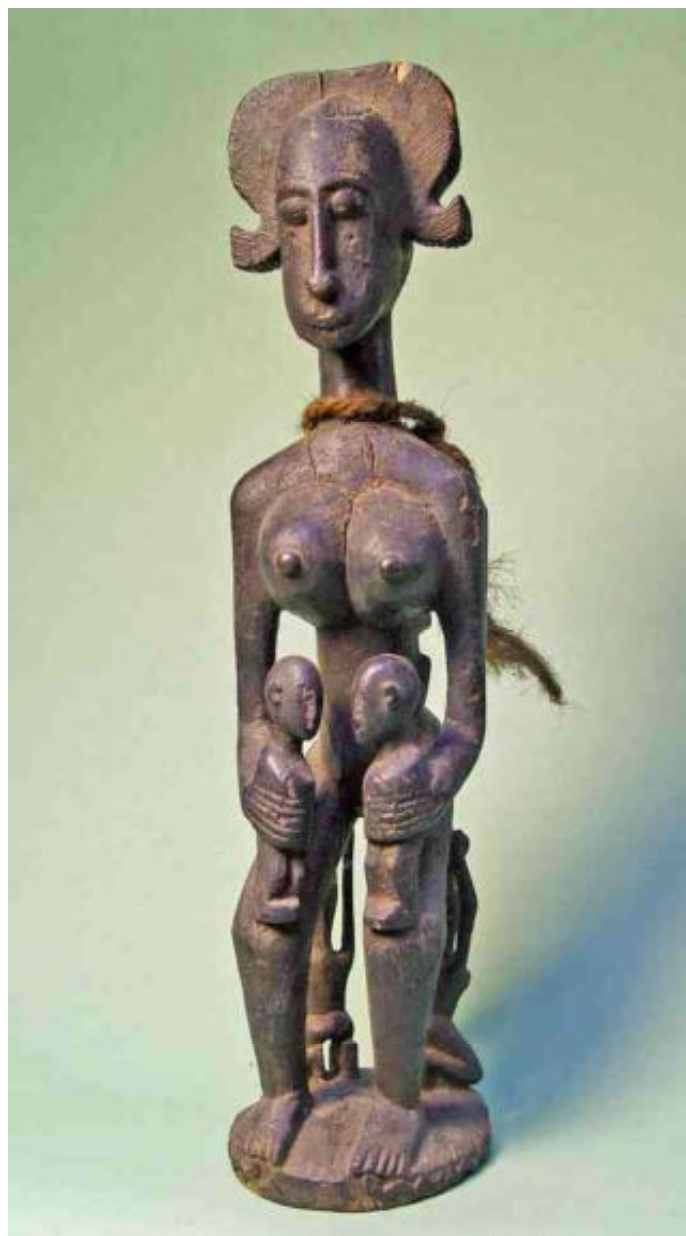
afb 2 - Jajimou - h 71

smoezelde een van de broers op de geheimzinnige toon, die veel toeristen er toe doet besluiten om een 'echt Dogonbeeld, zó van het altaar' te kopen. Dat ik dat echt niet wilde was teleurstellend, maar uiteindelijk nam hij toch maar genoegen met een aangeboden biertje in de buvette van het dorp. In ganzenpas liepen we terug, maar opeens was hij weg. Is hij teruggelopen? "Nee, natuurlijk niet, als er een biertje te scoren is, laat hij dat heus niet zijn neus voorbij gaan. Nee, hij neemt even een andere route om niet langs deze vijver te hoeven lopen ..... " noemde gids Ana. Die open vijver langs het pad bleek een euvel. Als bewoner van Koundou