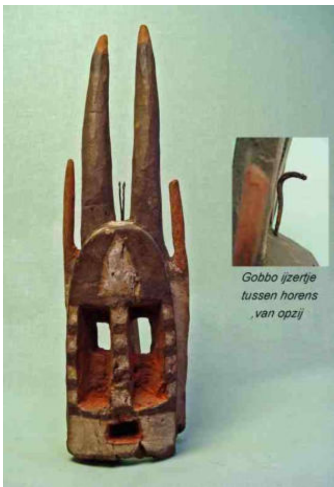
afb 9 - Gobbo ijzertje op Walu masker - h 54