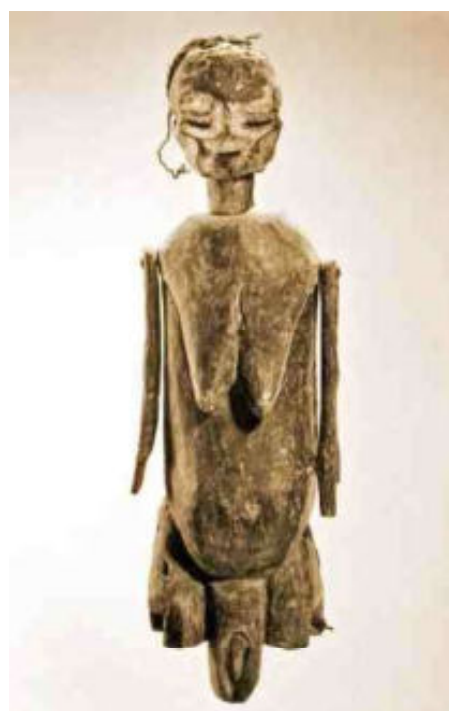
Sukuma - toch vrouw?

opende om bij de onderstaande afbeelding nu ook te kunnen denken aan een puur vrouwelijk beeld. Marchinus Hofkamp