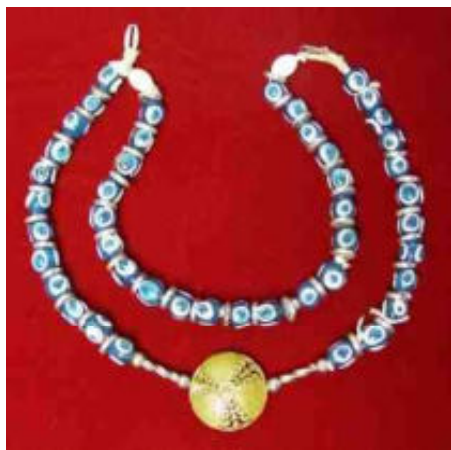
afb 17 - 'boze oog' collier

Om met dat lichaamsdeel te beginnen: fallussen en vulva's zijn al millennia over de hele wereld dé symbolen voor vruchtbaarheid. Voorwerpen, die er op lijken, kregen daardoor gemakkelijk een symboolfunctie, met in het verlengde daarvan een geloof in hun potentie de vruchtbaarheid te bevorderen. Het bekendst hierin is de kauri-schelp, waarvan de gleuf aan een vulva doet denken. Je ziet ze als 'versiering' op veel beelden en maskers (afb 16). Een mannelijke pendant is bv de kruidnagel, die gebruikt als afrodisiacum dienst kan doen, maar die ik in West Afrika slechts eenmaal gezien heb als 'vruchtbaarheidsketting' om de hals van een vrouw, niet om een beeldje. Kruidnagel is ook nauwelijks een Afrikaans product en werd vooral op de Molukken verbouwd, maar door de VOC wel overal naar toe gebracht..