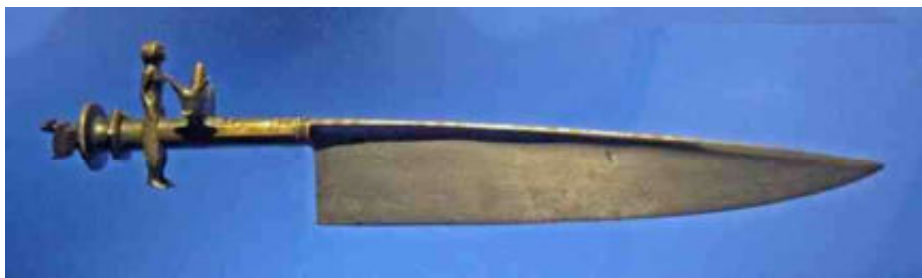
afb 4 - offermes Madagascar - lengte ca 35

op kosten van de overtreder natuurlijk – in de vorm van een lam of rund. Maar niemand zit te wachten op een dergelijke complicatie, en dat is dan ook de voornaamste reden, dat iemand van buiten het dorp hier altijd begeleiding krijgt [5].