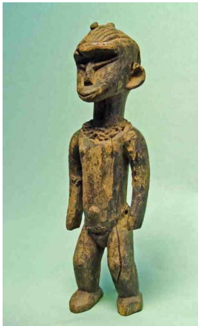
afb 7 - lemen gordel & collier - de zaden missen - h 43

delijk pogingen om te schreeuwen en zager best uit. Maar de kungwi moest natuurlijk laten zien wat ze kon. Een helpster bood haar een kalebas met water aan. Ze nam er een mond vol van, zodat het water door haar tandeloze kaken naar buiten kwijlde, en spuwde toen met volle kracht proestend haar mond leeg over het inmiddels blèrende kind en .. de moeder. Wel tien of twaalf keer werd deze behandeling herhaald” [8]. Hij vertelt daarbij, wat een geluk het was, dat ook dít kind deze traditionele en rituele verwelcoming te beurt viel, en daarmee dan toch geaccepteerd was door de goegemeente. Want dat had maar weinig gescheeld : De vader van dit kind was onderwijzer van een missieschool en had de euvele moed gehad – tegen de stamgebruiken in -