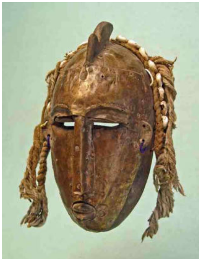
Afb 12 - koperbeslagen Bamanan uit Korè - h 25