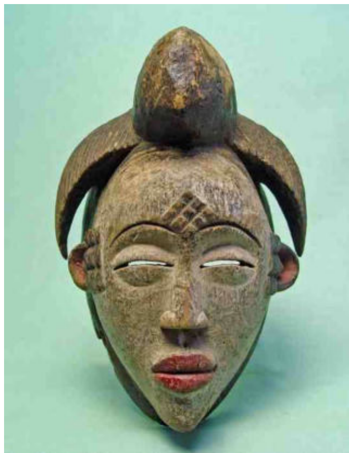
afb 14 - Punu masker met kaolin - h 28