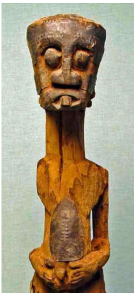
afb 13 - koperbeslagen Songye

ken'. Dat gebeurde bij de Putsch Guinadji [9] door het amulet er in te koken, maar meestal wordt de fetisj of het masker ermee ingesmeerd of besprenkeld. Over kruiden en andere medicinale stoffen is natuurlijk heel veel meer te vertellen [3] en dat zal in een toekomstig artikel ook zeker wel gebeuren. Maar omdat hiervan in de korst of patina van een object niet veel zichtbaars terug is te vinden, weid ik daar hier niet verder over uit.