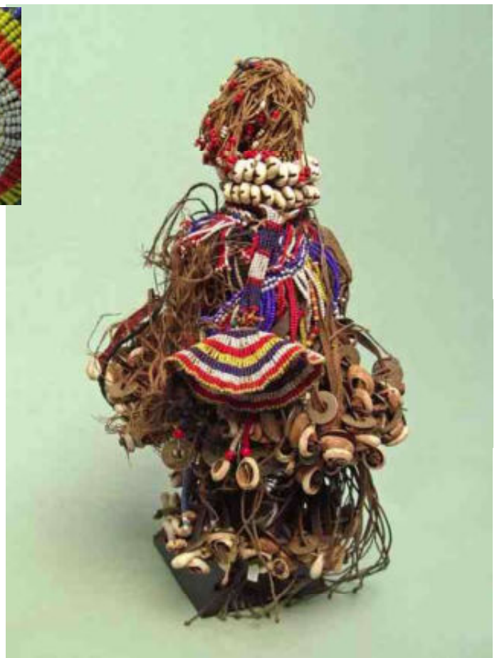
afb 18 - Ham Pilu beeld - b 26

Want om je zorgvuldig 'opgeladen' fetisjbeeld of masker nog wat extra's mee te geven, kan je het nog 'versieren', 'optuigen' met kostbaarheden. Enerzijds betoon je daarmee je dankbaarheid voor 'gedane diensten', en anderzijds versterkt dit ook