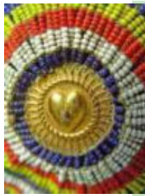
afb 16 - sex-symbolen

Een ander sterk gelijkend kracht-symbool is dat tegen "het boze oog", dat in grote delen van de wereld als bescherming tegen onheilsdreiging gedragen wordt, hetzij als stip op het voorhoofd (Hindu), of als amulet in de vorm van een kraal met iristekening (afb 17). Het wordt ook in