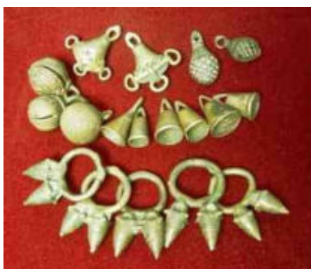
afb 10 - allerlei bronzen gerinkel

digd van koper , messing en brons, en daar dus veel over te vertellen moet zijn, weet ik daar zelf relatief weinig van af. Allerlei belletjes (afb 10), die bij rituele dansen tegen elkaar aan klingelen om boze geesten op afstand te houden, worden relatief weinig nagemaakt en zijn mede daardoor leuke en interessante verzamelobjecten. En zo kun je ze ook hangend aan een Dan masker (afb 11) tegenkomen.