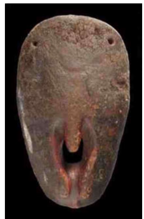
Sukuma vr. masker - K.F.Schädler