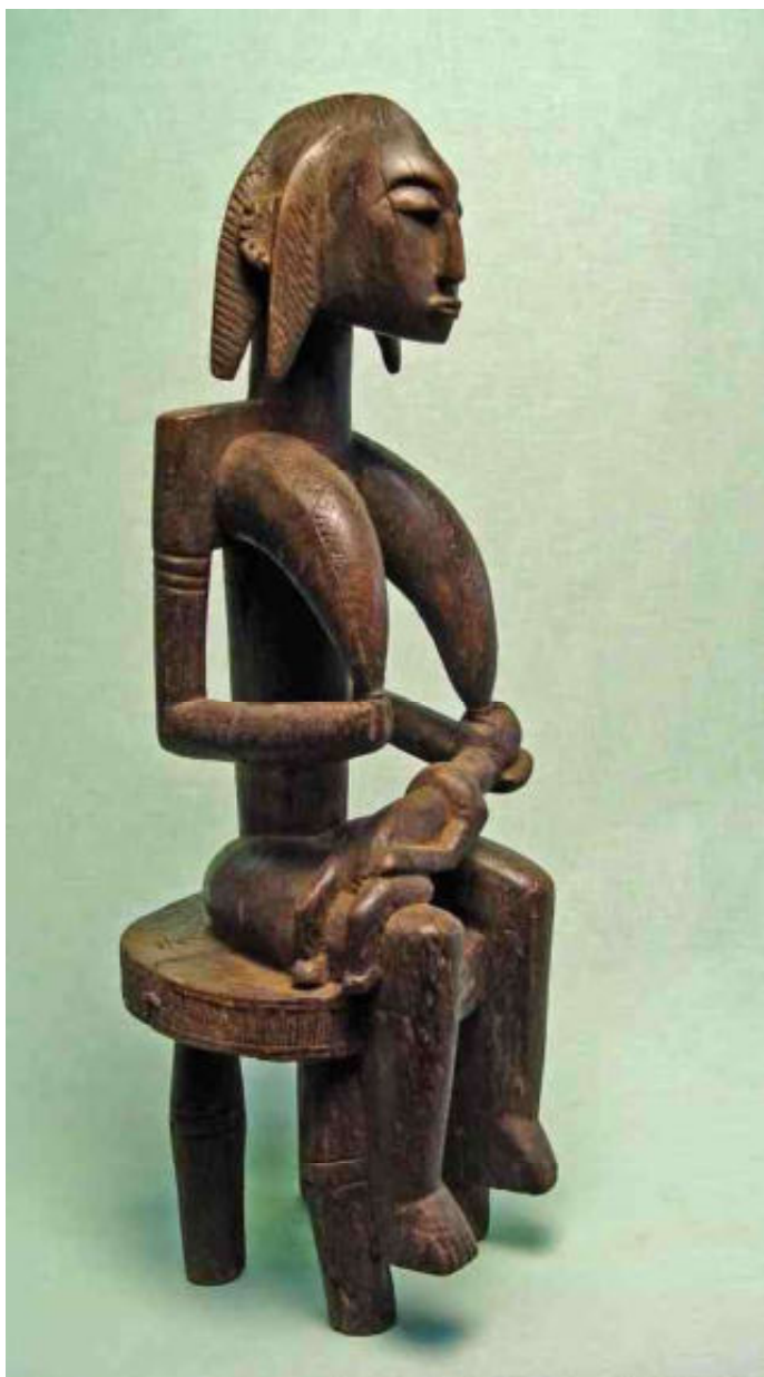
afb 1 - Gwandusu - h 57