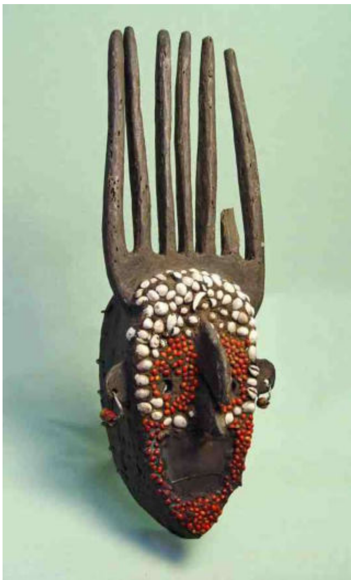
afb 6 - Ntomo masker met leem & zaden - h 55