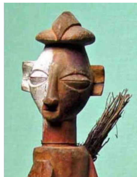
afb 15 - Yaka rood & wit

' Krachtsymbolen ' zijn tekens, die je in allerlei vorm op heiligdommen, maar ook op een fetisj of masker kunt aantreffen. Die betekenis ontleenen ze aan hun vorm, die op een lichaamsdeel of een stuk gereedschap