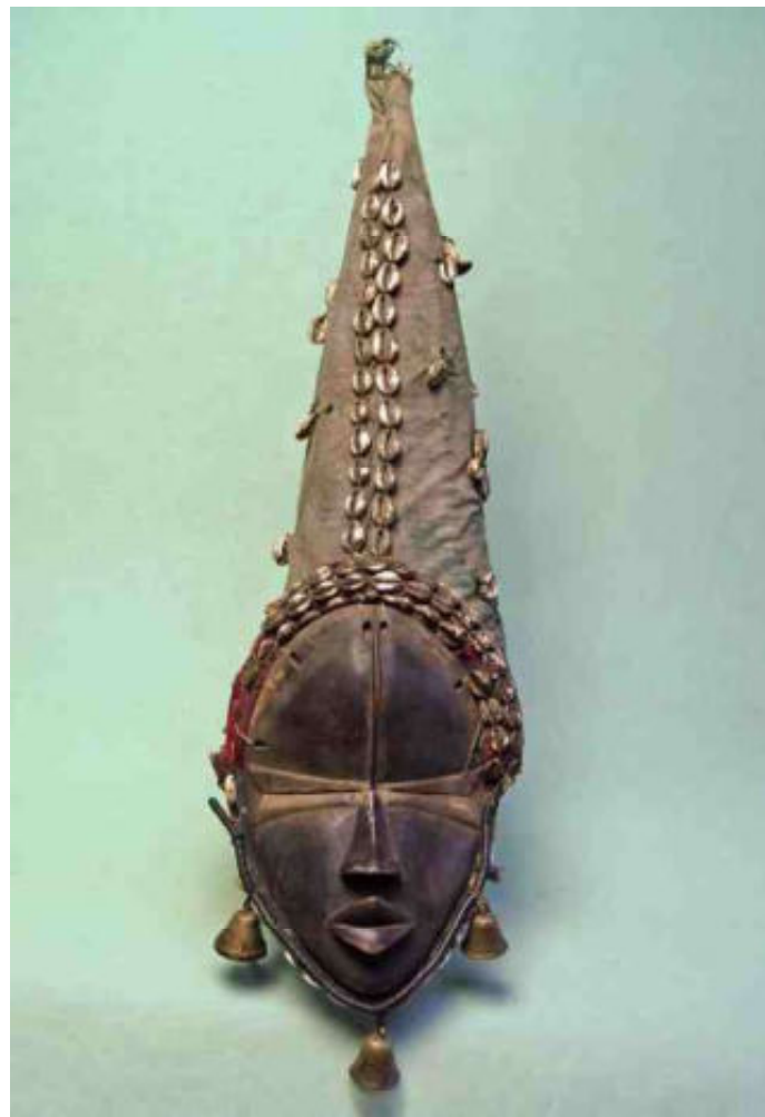
afb 11 - Dan masker compleet, met belletjes - h 66

magische rol. Bij de Dogon worden de T- of kruisvormige Binu-ijzertjes heel veel gezien. Binu is de god van het ijzer & vuur, met legio aparte heiligdommen die ook 'Binu' genoemd worden ('on top' in afb 8), hier met leemreliëffiguren. Maar voor verzamelaars zijn de 'Gobbo'-ijzertjes interessanter, omdat je ze op beelden en maskers kunt vinden, zoals in afb 9 tussen de horens van dit Walu masker. Ze lijken op Binu ijzertjes, maar hebben slechts 1 'armpje'. Ook de ijzeren krammen in het Otobo-masker (juninummer) zullen een dergelijke functie vervullen. Het beroemdste zijn natuurlijk de Kongolese Kisi spijkerbeelden, waar vaak niet alleen spijkers in zijn geslagen maar ook mesjes en ander scherp ijzeren spul.