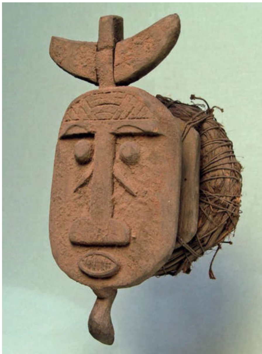
5. Het tweede verworven masker heeft de vorm van een menselijk gelaat in combinatie met een vis/vogel. Ook dit masker wordt horizontaal op het hoofd gedragen door middel van een 'vezelhoedje'. Lengte 40 cm.

In het zelfde gebied verzamelde ik nadien nóg een aantal kruinmaskers waaronder een exemplaar, waarin elementen van Nijlpaard en krokodil op een abstracte manier zijn samengevoegd ( afb. 6 ). De tanden van dit masker zijn bamboe