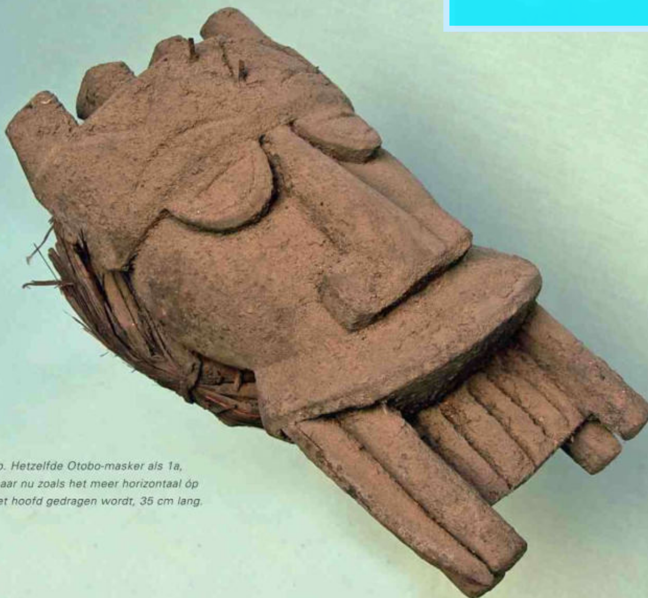
1b. Hetzelfde Otobo-masker als 1a, maar nu zoals het meer horizontaal óp het hoofd gedragen wordt, 35 cm lang.

4. Dit Otobo masker in het IUAM is van hetzelfde type als het masker in afb. 1