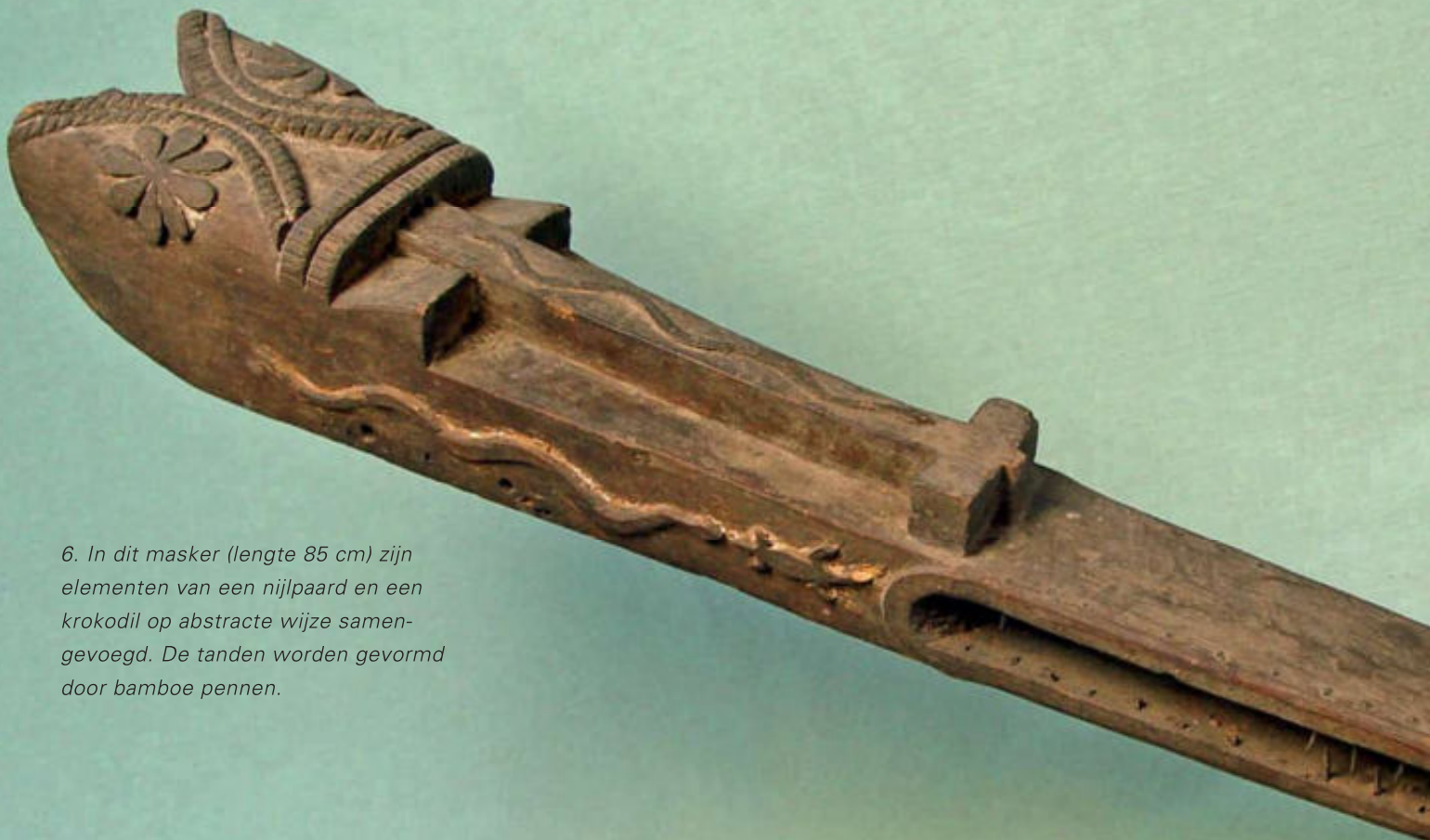
6. In dit masker (lengte 85 cm) zijn elementen van een nijlpaard en een krokodil op abstracte wijze samengevoegd. De tanden worden gevormd door bamboe pennen.