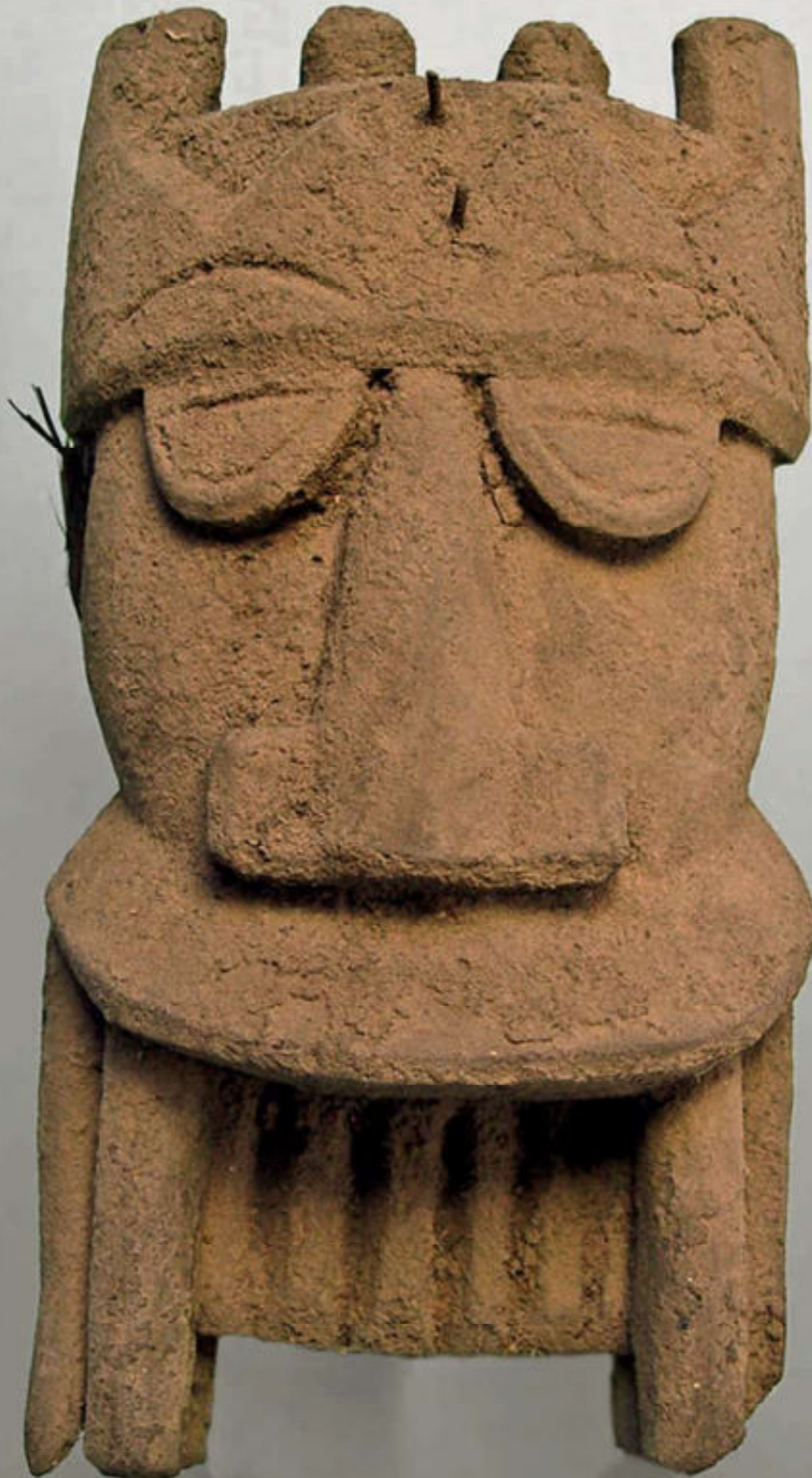
1a. Otopo masker, half mens/ half nijlpaard, h 35 cm