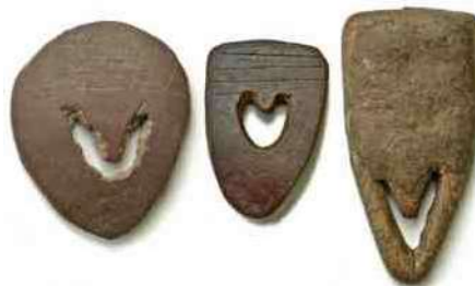
10 a, b, c