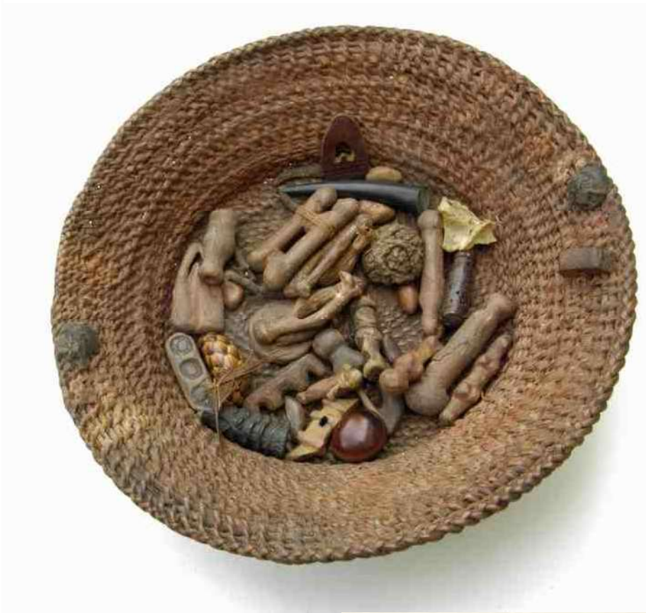
1. de mand met inhoud