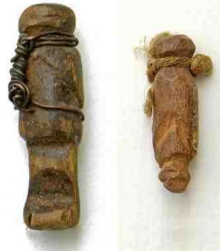
9 a & b.