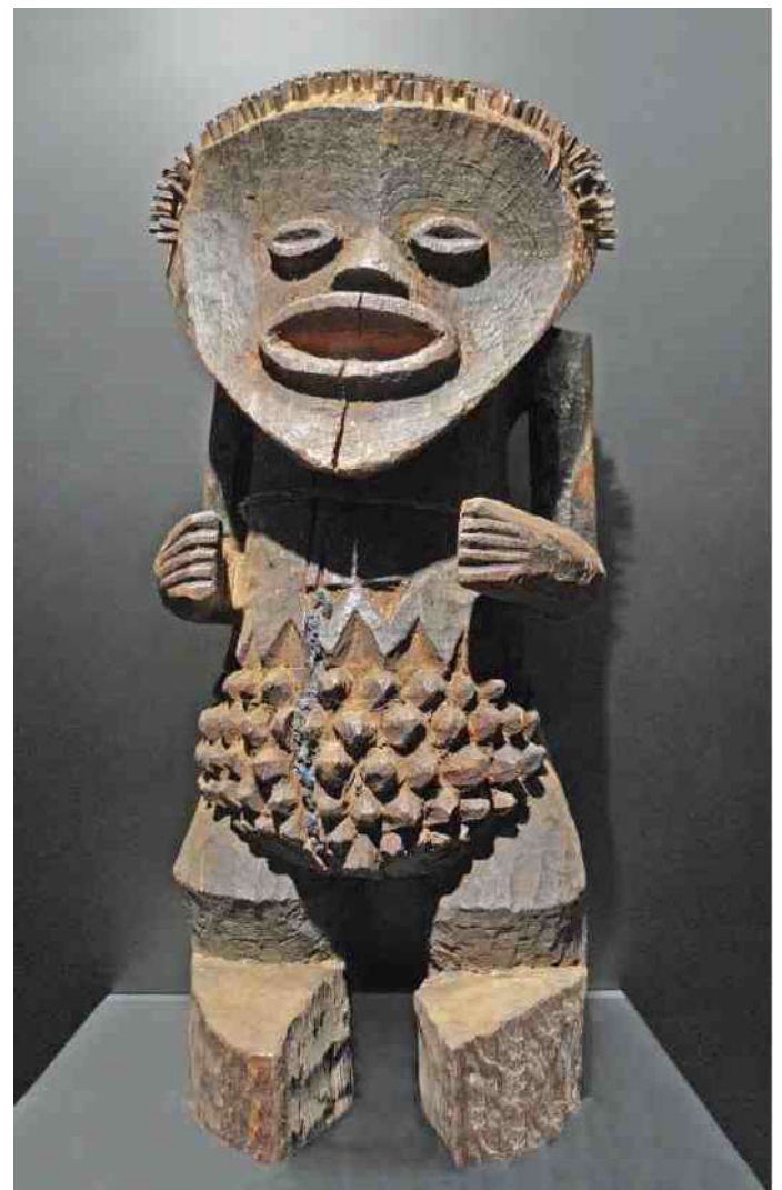
1. Houten Mambila beeld, h?

Er bestaat in de Mambila regio een grote variatie in keramiek wat betreft onderwerp, stijl en vorm. Dat vindt zijn oorsprong in het feit dat bij de grens Nigeria - Kameroen diverse volkeren met en door elkaar kunnen leven in één dorp, zoals de Kaka, Mfunte en Mambila. Behalve Mambila kruiken (afb 2, 4, 5, 8, 9, 10 en 11) met een grote diversiteit aan vormen, zien we ook Kaka kruiken waarbij de figuren een soort "pet" op hebben (afb 6)). Daarnaast zijn er kruiken waarin een duidelijke stijlinvloed uit het iets zuidelijker gelegen Tikar gebied zichtbaar is (afb 3).