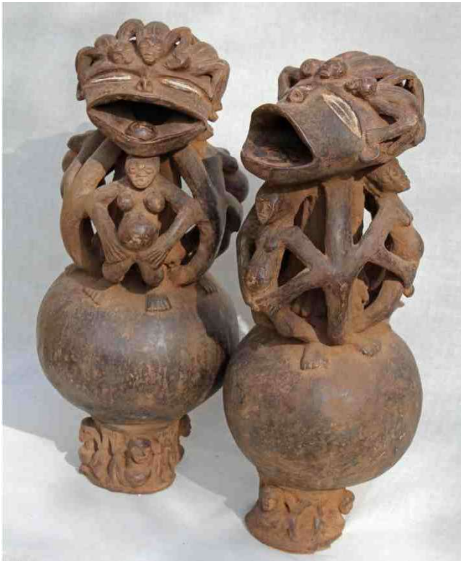
3. Mambila-Tikar kruiken, h 49cm