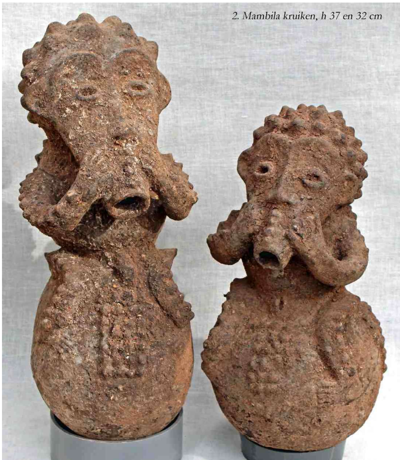
2. Mambila kruiken, h 37 en 32 cm

Het koppel Mambila kruiken op het voorblad vormde voor Koos en Roelie aanleiding om wat meer te laten zien van dit bijzondere keramiek, en om ook wat meer over de achtergrond te vertellen.