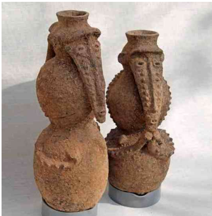
6. Kaka kruiken h 36 en 42 cm