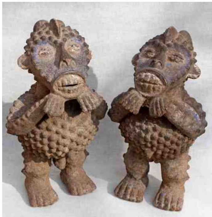
7. Mambila Mantab, h 38 en 38 cm