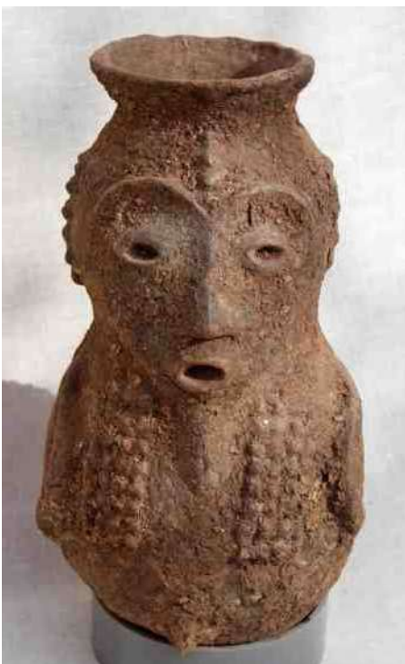
9. Mambila kruik, eenvoudig, 28 cm