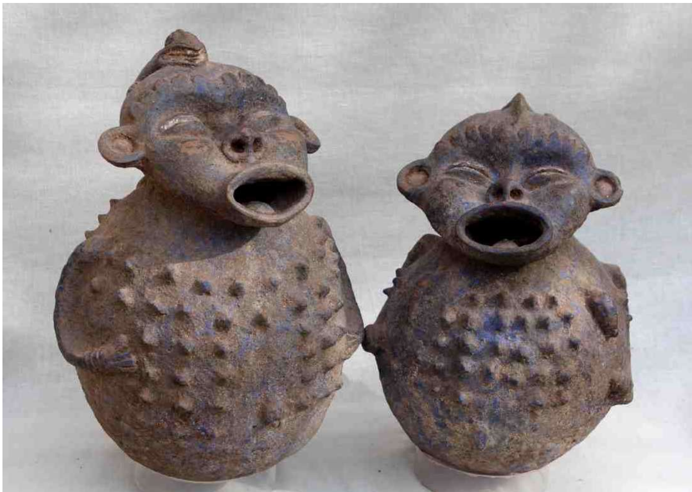
Onder afb 5. Mambila Dieven fetisj, h 40 cm