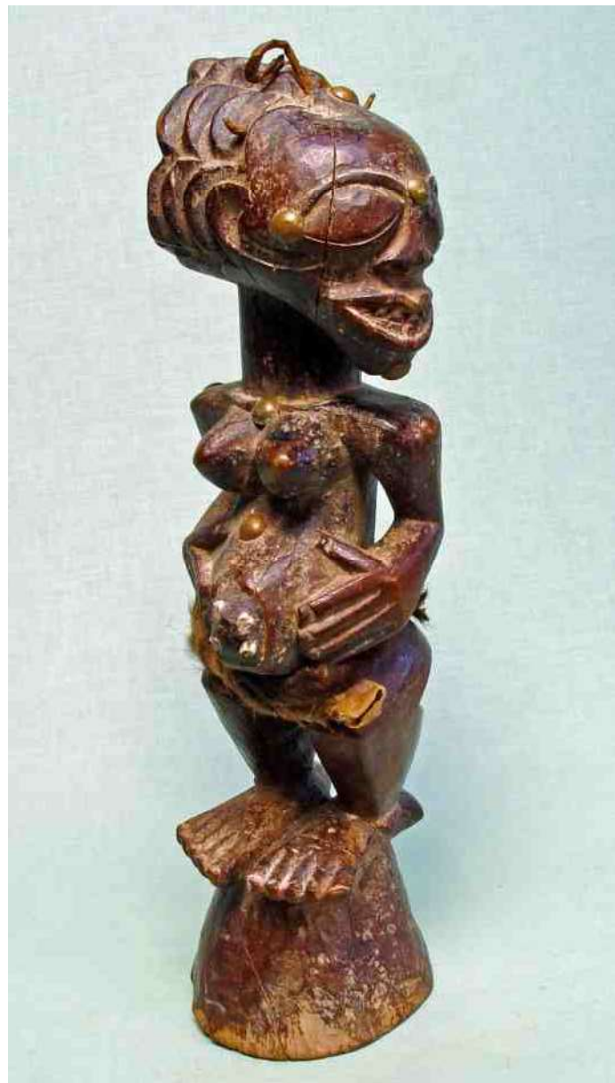
4. Onheilspellende dreiging - Songue h 36,5 cm