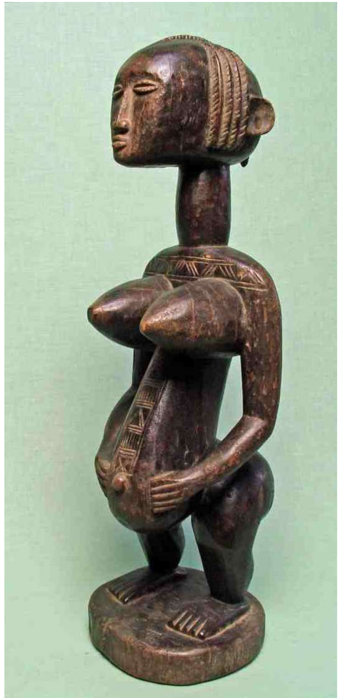
2 - Evenwichtige schoonheid - Bamanan, h 52cm

Het Dionysische is een oerkracht, een oerdrift, genoemd naar de Griekse god Dionysus, de god van de wijn en van de groeikracht van de aarde. Het Dionysische vertegenwoordigt de extase, de roes, de chaos waaruit nieuwe dingen kunnen ontstaan, het mateloze, het geluk en de levenskracht, de veerkracht die maakt dat we verder willen. Maar ook het besef van de invloed van het toeval, het onverwachte dat vaak verdriet met zich mee brengt, het ondoorgrondelijke en de verandering. Het leven verandert immers voortdurend,