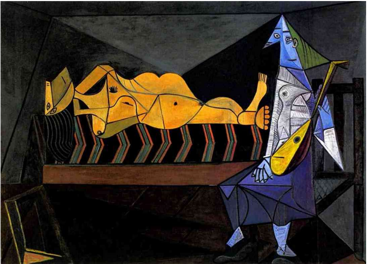
1. "De naakte aubade", Picasso 1942

De filosoof Friedrich Nietzsche (1844-1900) leefde in een tijdspanne, die de Romantiek en het Impressionisme omvat. Die omwenteling maakte hij volop mee, en niet alleen dat, hij blijkt er ook een belangrijke inspirator van te zijn geweest. Die inspiratie dreunt ruim een eeuw later nog steeds door in wat dan steeds 'moderne kunst' genoemd wordt. Maar in wezen grijpt dit terug op oerkrachten in en om de mens.