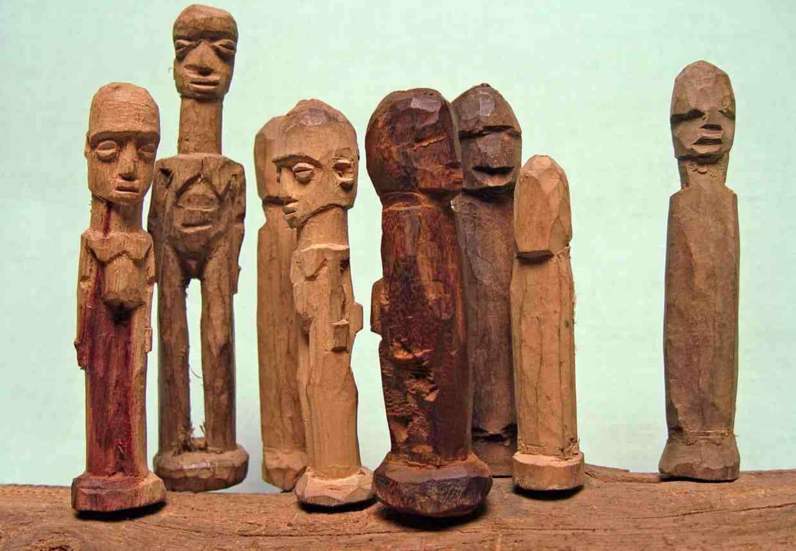
1. Groep van acht beeldjes van Kambou Sipine

Daarentegen las ik in Kunst & Kontext de uitspraak „Geen Lobi zal ooit een beeld voor het eigen altaar kopen bij een beeldhouwer die voor de westerse handel bezig is of met kolonialen samenwerkt” [1]. Een boude uitspraak, die dus nuancingering behoeft : Het Lobi-land is groot en strekt zich behalve in Burkina Faso ook nog uit in Ghana en Ivoorkust. Religieuze gebruiken kunnen van regio tot regio sterk verschillen, zoals ook mijn ervaring in het Dogongebied is, en zoals wij uit ons eigen land maar al te goed weten.