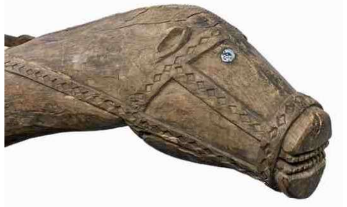
9. ogen van Chinees porselein - detail van afb.6