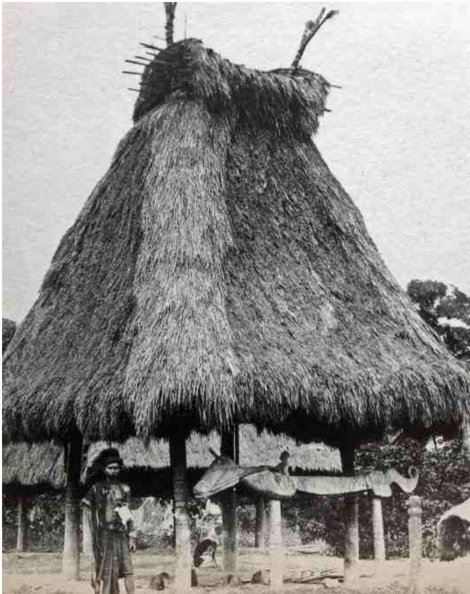
1. ceremonieel huis van de Nage, de 'sao heda'