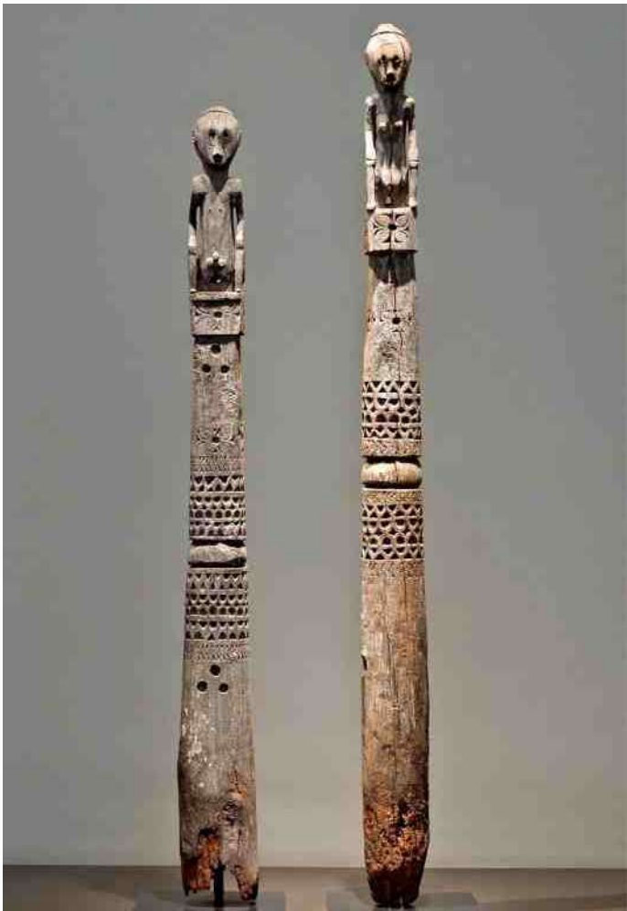
3. beelden van de huisgeesten, de 'ana deo'