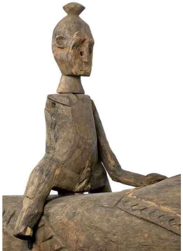
8. erectie - detail van afb.6