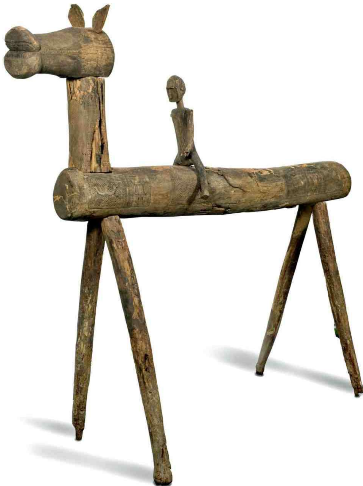
10. het tweede Flores 'paard' uit de collectie Museon, h 230 , L 265 cm