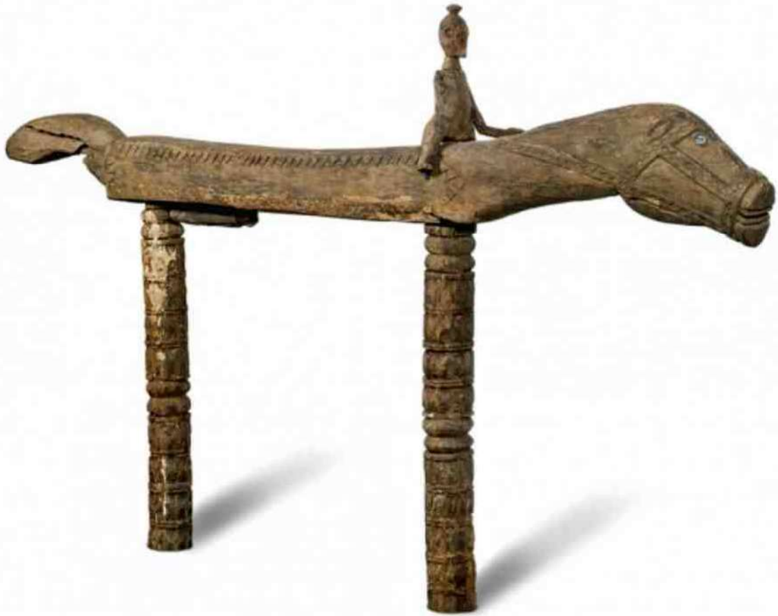
6. eerste 'ja heda' in het Museon, h 175, L 280 cm, 20e eeuw

naga' zelfs "bereden" worden. De 'naga' is zowel dorpsgeest als huisgeest. Armoede en rijkdom kunnen aan de manier van verschijnen van de 'naga' voorspeld worden, evenals leven en dood. In de regenboog zien de Nage een paard, waarmee de goden naar de aarde afdalen.