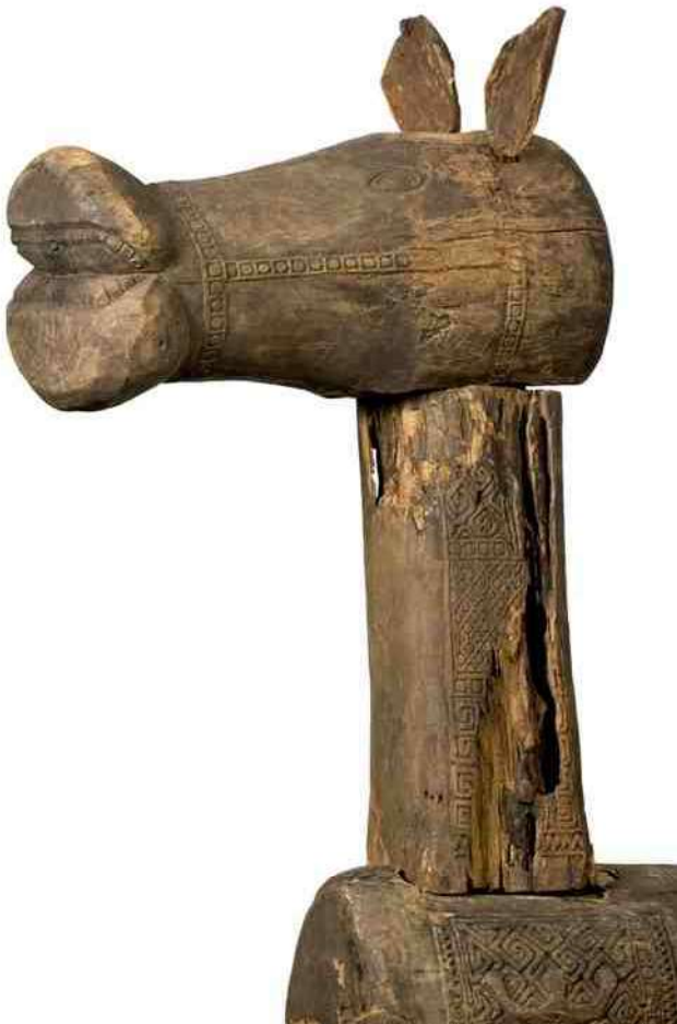
13 onder 12 boven 11 rechts