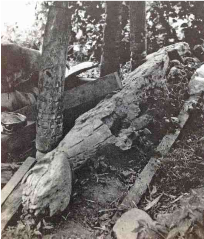
7. vergane glorie - omgevallen 'ja heda', Boawai, Flores, 1983, Foto: Susan Rodgers.

De tweede 'ja heda' van het Museon (afb 10, 11, 12 en 13) is van een afwijkend type, waarvan ik tot op heden niet een vergelijkbaar oud exemplaar ben tegen gekomen. Vreemd genoeg wel een kleinere toeristische versie in een modern interieur in San Francisco. Het Nagepaard in het Museon heeft veel meer losse onderdelen dan de gebruikelijke 'ja heda'. Het heeft vier losse, onbewerkte poten, een afzonderlijke romp, een afzonderlijke nek en een afzonderlijke kop, met losse oren. Interessant is dat op de kop van de 'ja heda' op een foto uit ca. 1920 (afb 1), genomen in Boawai, ook losse oren lijken te zijn bevestigd. Bij het Museon paard ontbreekt de afzonderlijke staart. Hoofdstel en tanden zijn zichtbaar, maar de paardenkop heeft sterk omgekrulde lippen. De ogen zijn ingekerfd en niet van scherven porselein gemaakt. Nek en romp zijn van inkervingen voorzien met geometrische patronen en met mensfiguren. Ruiters en slangen-lichaam hebben de gebruikelijke erectie.