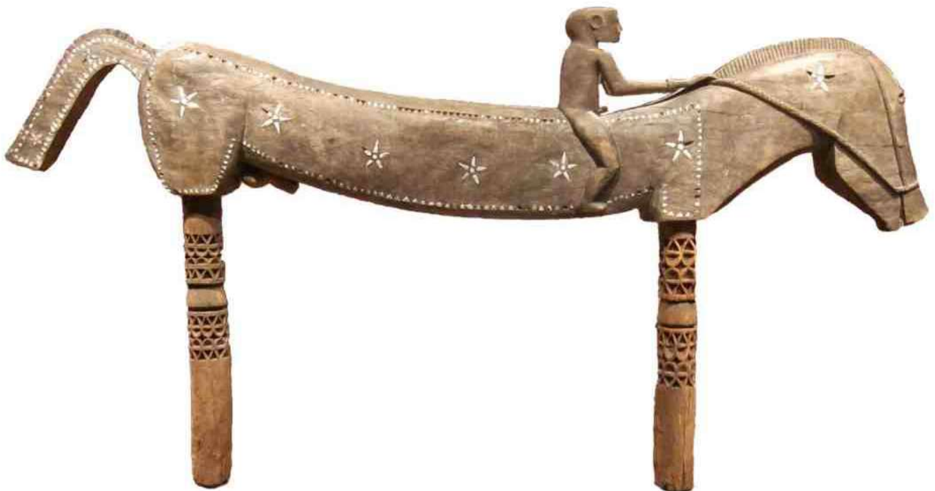
5. 'ja heda' in Honolulu Museum of Art, Hawaï, ca. 1900

De grote paarden met hun ruiters werden 'ja heda' ( afb 5 ) genoemd. Zij behoren tot een ingewikkeld systeem van voorstellingen en gedachten over religie, de clanstichters, de voorouders en het hierna maals. Opvallend genoeg verbinden de Nage aan de paardenkop niet de verbeelding van een paardenlichaam, maar zien zij hierin de voorstelling van een slang (python). De "poten" zijn dan ook geen werkelijke benen van het paard, maar worden slechts als steunen voor het "zwevende" slangenlichaam gezien. In deze samenstelling van paardenkop en slangenlichaam zien de Nage een 'naga', d.w.z. een speciale (slangen) geestenverschijning. Deze verschijning wordt gerelateerd aan zeer uiteenlopende zaken, die onderling niet altijd een samenhang lijken te vertonen. Zo wordt verwezen naar waterstromen en de regenboog, maar ook naar vuur en ziekte en naar het zich door de lucht bewegen. In dat laatste geval kan de '-