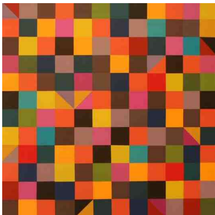
6. "Welcome to Jordan", 2014 - idem, 120x120 cm

Zoiets groeit geleidelijk. Door de huidige overdaad aan beelden en informatie die op ons afkomt via internet, televisie, digitale camera's en media, verloor ik de interesse om hier nog eigen figuratie aan toe te voegen. Alles moet tegenwoordig snel, flitsend, veel en druk zijn. Ik merkte dat ik het steeds prettiger ging vinden om me terug te trekken in m'n atelier. Ongeveer vanaf 2000 schilderde ik onder invloed van songs van Randy Newman. Flarden tekst, zijn ritme en het uitzicht op de ateliertuin maakten dat kleur en muziek samen kwamen. Meer en meer maakte ik me los van figuratie. Belangrijk werden doeken die het materiaal zelf als uitgangspunt hebben, maar ook het formaat en de