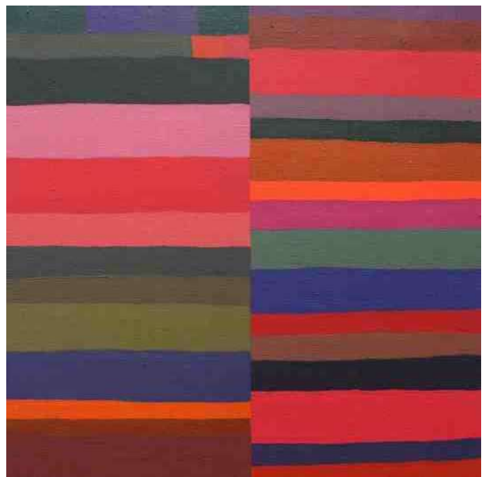
4. "december", 2011 - acryl op linnen, 50 x 50 cm