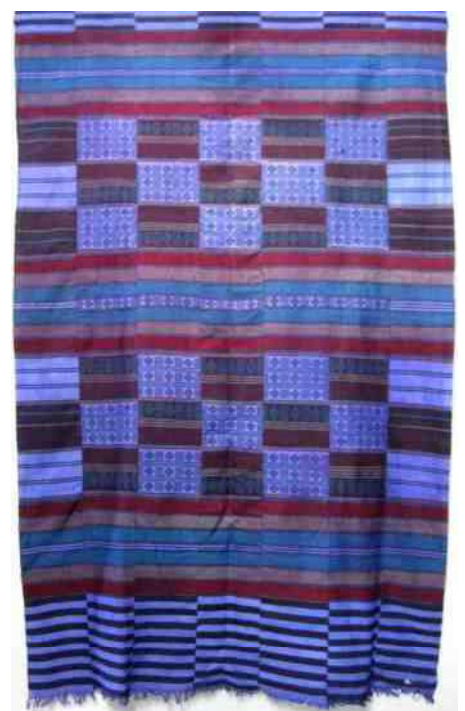
3. omslagdoek van de Peul

werk is voor velen een inspiratiebron. Daarom ook is dit werk altijd in ons huis, in mijn atelier, om ons heen en is het bijna niet meer los te denken van mijn eigen werk.