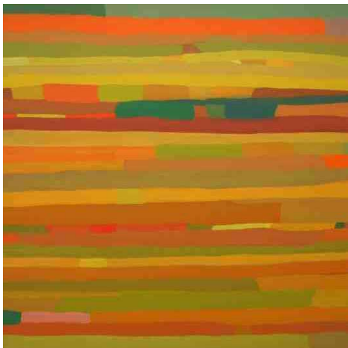
5. "juli", 2011 - acryl op linnen, 90 x 90 cm

Ap had ook een bijzondere visie over lesgeven: "Je moet de mensen op zo'n manier aansturen dat ze uit zichzelf de dingen gaan zien. Als ze aanleg hebben, kan je dat eruit halen door ze techniek te leren".