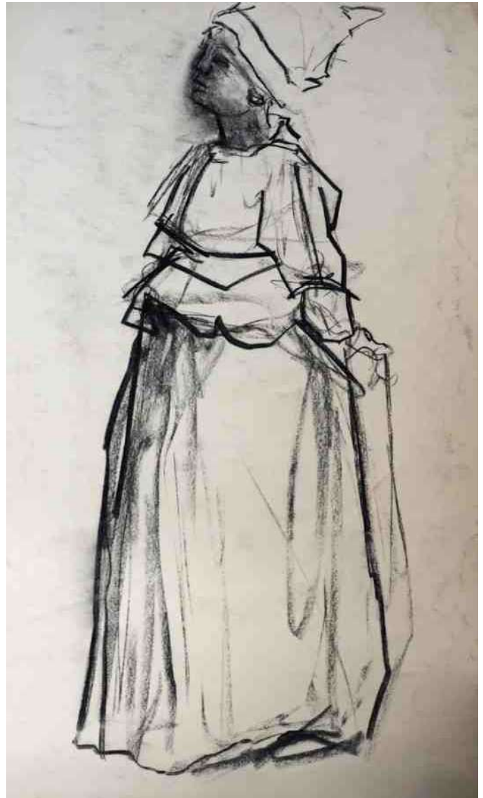
2. Surinaams model, "Kotomissi" - (gespiegeld)