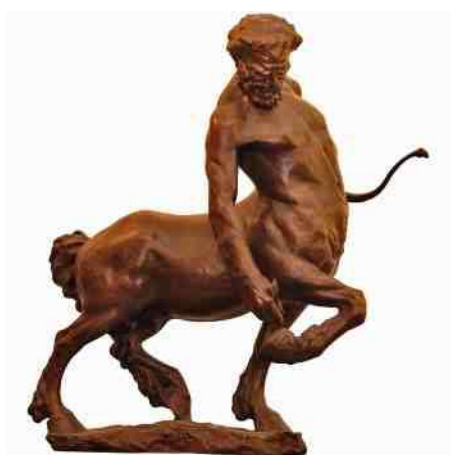
9. paardmens Centaur

zwaan (afb 4) toen hij Leda verleidde, of in de gedaante van een stier (afb 5) toen hij Europa wegvoerde. Eigenlijk staat de hele Griekse en Romeinse mythologie vol van gehele of gedeeltelijke transformaties en bizarre vervormingen, zoals de driekoppige hond Cerberus (afb 6) en hybride wezens die deels mens en deels dier zijn, zoals de god Pan (afb 7) en zijn satyrs, de Syrenen (afb 8) en de Centaur (afb 9).