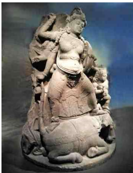
2. Durga met veel armen en veel wapens verslaat de demon.