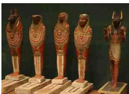
3. Egyptische goden met dierenkop