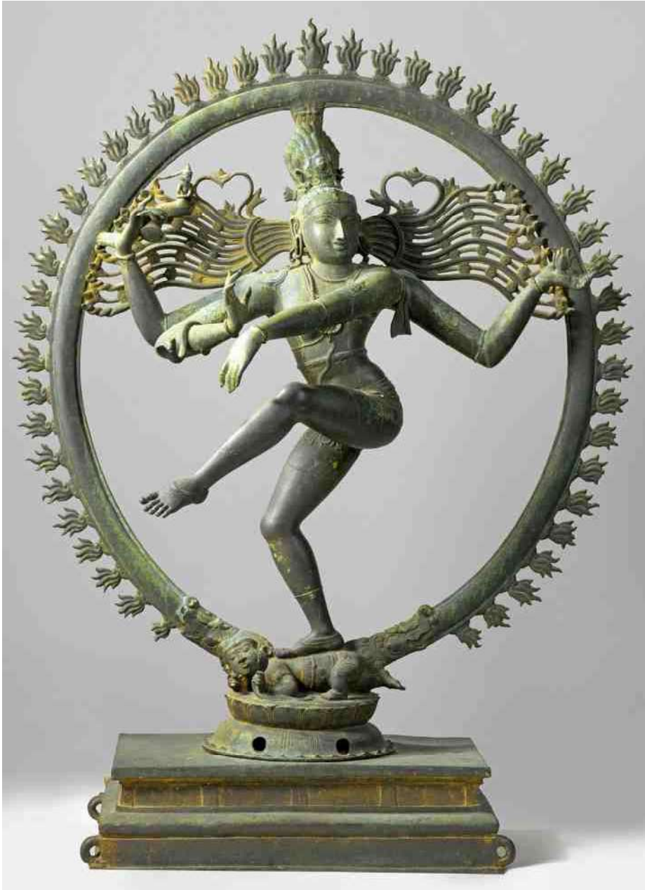
1. Shiva met 4 armen, brons h 153 cm - icoon v/h Rijksmuseum afd. Aziatica

Raar gevormde wezens in de kunst. We kennen ze van de Brabander Jeroen Bosch, maar ook uit India, China, én uit allerlei tribale kunst. Bizar, maar welke betekenissen schuilen er in ?