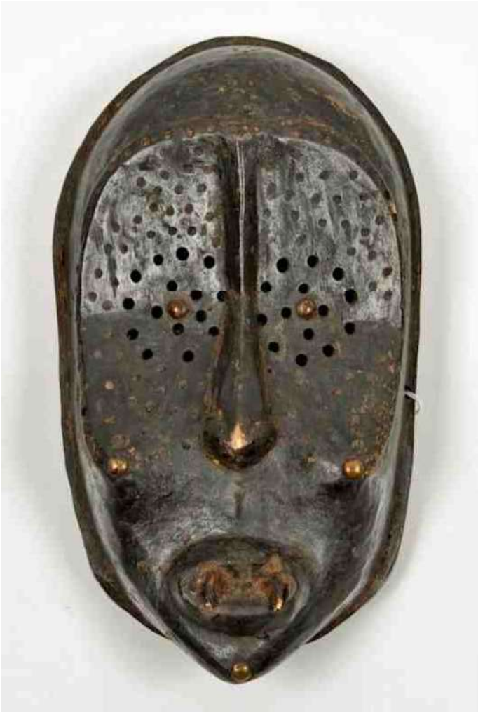
24 B. Chokwe masker zonder ogen, h 27 cm