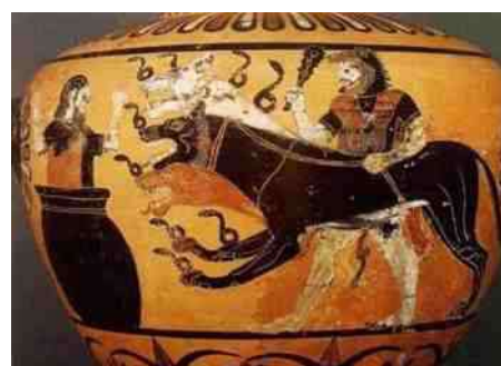
6. Heracles met Cerberus bij koning