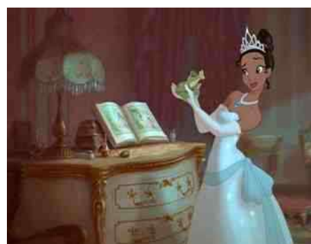
11. Kikker wordt prins

Over deze verbeeldingen werd in de Griekse en Egyptische (=Noord Afrika) mythologie verteld, en in Hindoeïstische verhalen zoals de Ramayana. Op school werd je interesse ervoor gewekt, en je luisterde er naar als sprookjes. Op zich niet gek, want ook sprookjes zijn beladen met fantasie en magie. Andersen's verhaal over de 'kleine zeemeermin' en het beeldje (afb 10) in