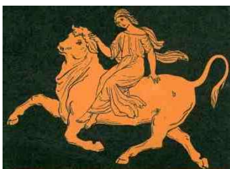
5. Europa ontvoerd door stier Zeus