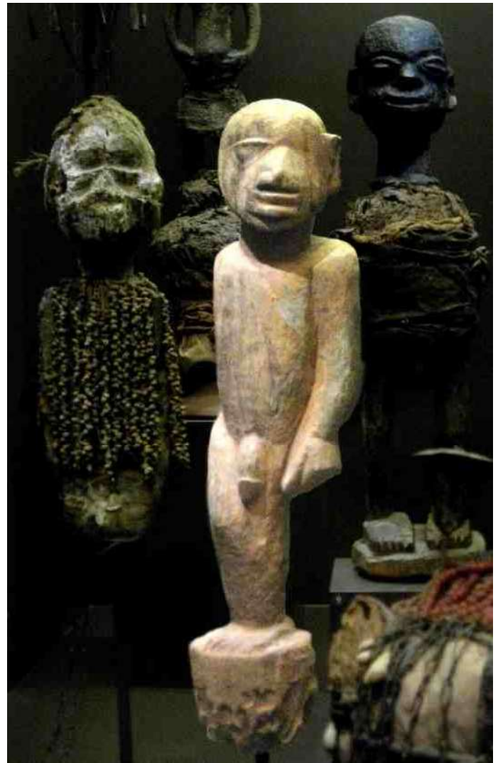
17. Lemen Amma beeldjes, h 14 cm. Rechts met 4 armen. 18. de god Aga heeft slechts 1 been e.a. nodig - Afr.Mus.

kwaad. Demonen zijn uit op het 'eeuwig-leven-elixer', dat in handen is van de goden. Durga voert deze strijd en ze bevecht haar belagers op alle mogelijke manieren, waartoe zij gelukkig beschikt over een hele reeks wapens. En om deze effectief, en zo nodig allemaal tegelijkertijd te gebruiken, beschikt zij over even zovele armen. Uiteindelijk overwint Durga de demon en blijft het 'eeuwig-leven-elixer' in handen van de goden. Deze overwinning wordt nog elk jaar gevierd met het "Durga-puja-festival".