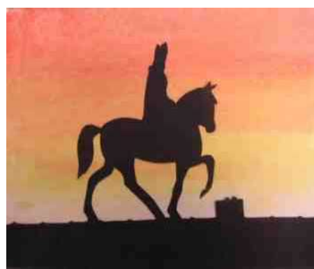
13. Wodan? Sinterklaas op het dak