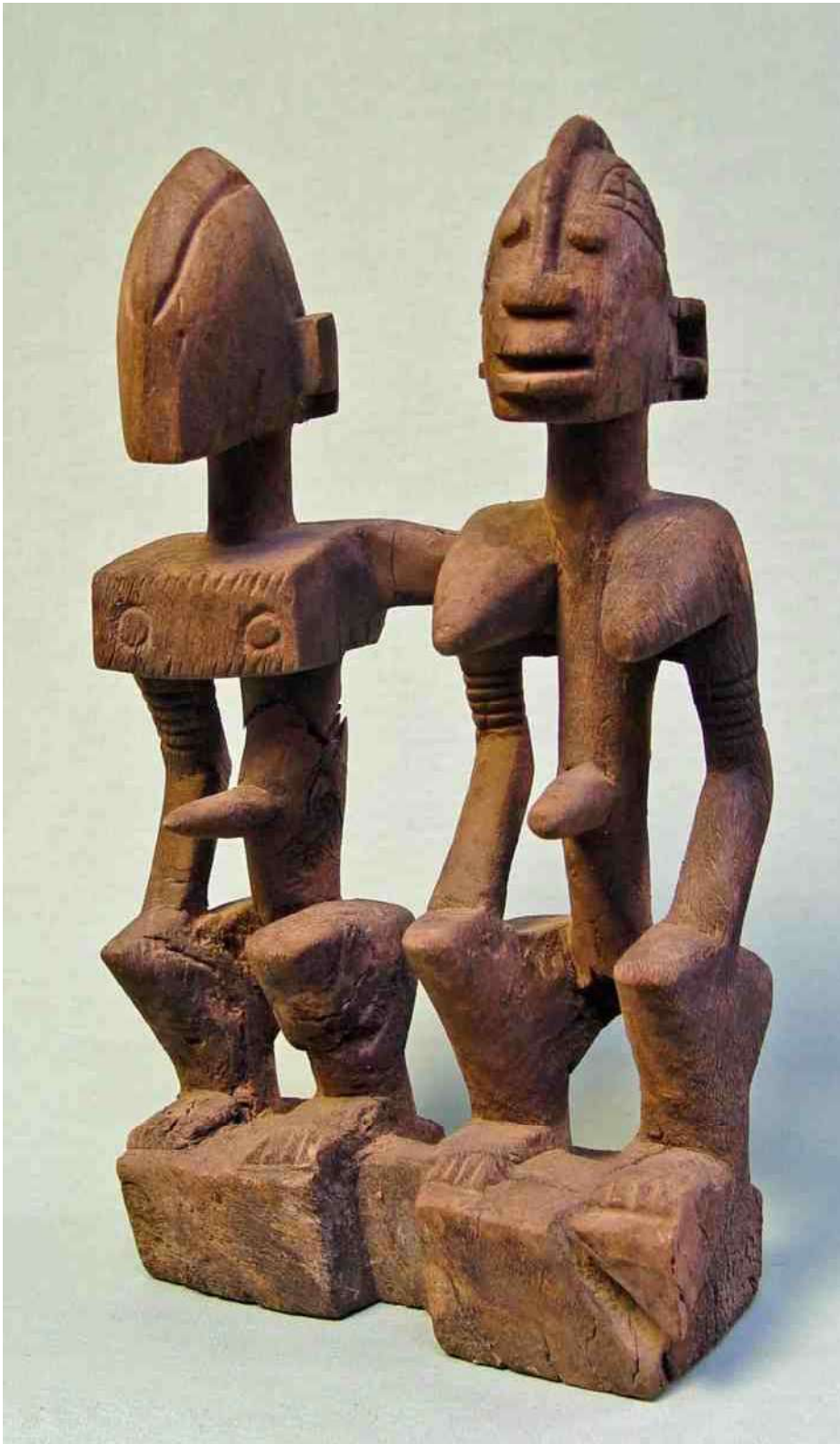
27. Dogonkoppel. De vrouw mét een gelaat, de man zonder. h 37 cm