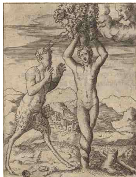
7. Pan en Pitys, 16e eeuwse prent Giulio Bonasone - Gem. Bib. Lyon