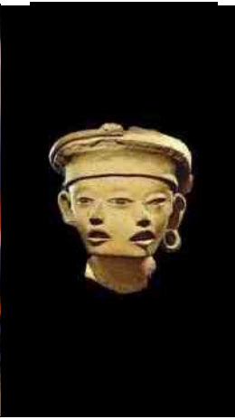
20 A & B. 2 pre-

Age mist ook nog een oog, een euvel waar ook al in de Ilias van Homerus over te lezen is. In dat verhaal ontsnapt Odysseus aan de mensenetende Cycloop Polyphemos door hem ook nog dat ene oog uit te steken. En eenogigheid kwamen we verder ook tegen in een sprookje van Grimm bij een van drie zusjes. Naast “Eenoogje” waren daar ook nog “Tweeogje” en “-Drieoogje”. Bij deze laatste sliepen