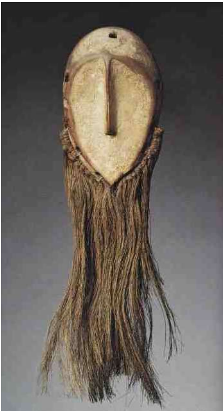
24 A. Lega masker zonder ogen, h 11

bij de Dogon een bekend verschijnsel [1].