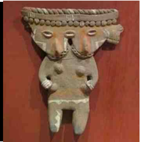
columbiaanse afb. 3 ogen, 2 kinnen

slechts twee van de drie ogen, zodat zij met haar derde oog toch nog zag wat er gebeurde, en daar had niemand op gerekend. Ook de stip op het Hindoe voorhoofd, ‘tegen het boze oog’, is een afspiegeling van drie-ogigheid, zoals te zien in deze Shiva speler (afb 19), maar ook bij Shiva in afb 1. Dit derde oog op zijn voorhoofd ontstond toen Parvati, Shiva's vrouw, voor de grap diens ogen bedekte.