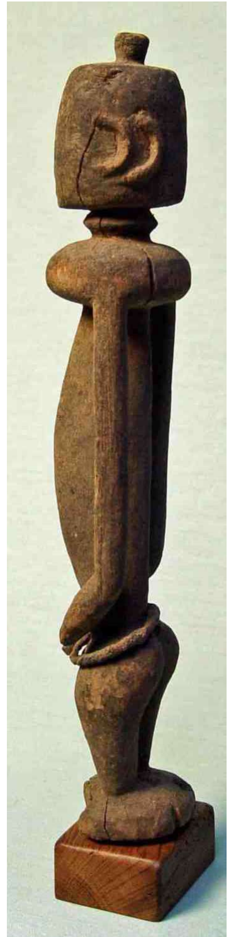
28. Dogonbeeld met 4 oren, h 32 cm