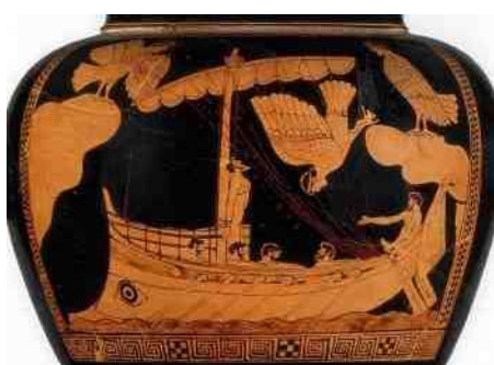
8. Syrenen verleiden Odysseus