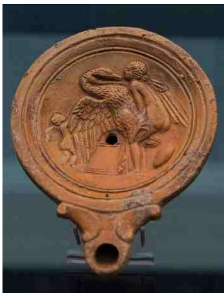
4. Leda en de zwaan op Romeins olielampje