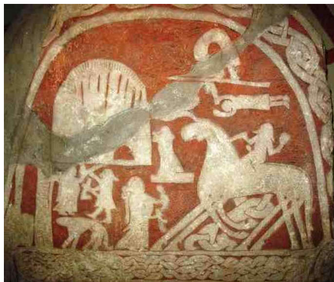
14. Sleipnir met 8 benen. Vikingsteen, Gotland, 600 AD

de haven van Kopenhagen zijn wereldberoemd. Net als Grimm's sprookje over de kikker die een prins werd (afb 11), het sprookje van de zes zwanen (afb 12) en de bekende Langnek uit het verhaal van de zes dienaren.