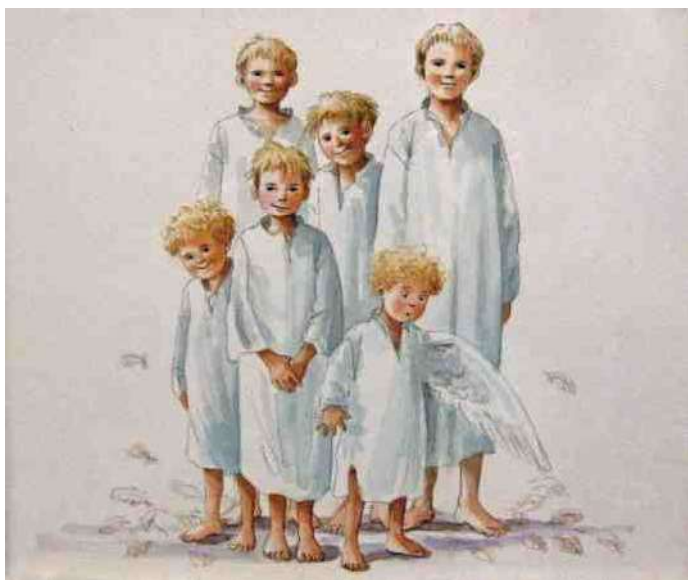
12. Grimm's "Zes zwanen" door Charlotte Dematons