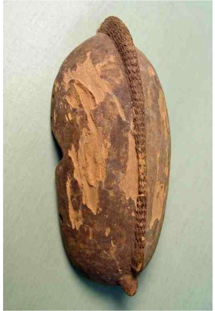
24 C. Dogonmasker zonder gelaat, h 29