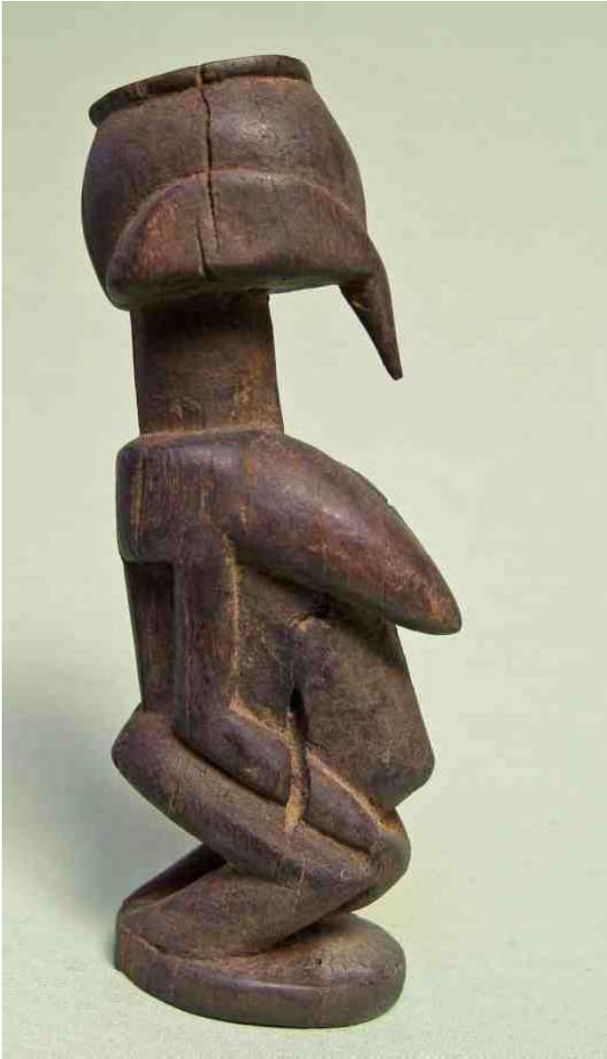
23. Fijn gesneden, geen gelaat. h 19