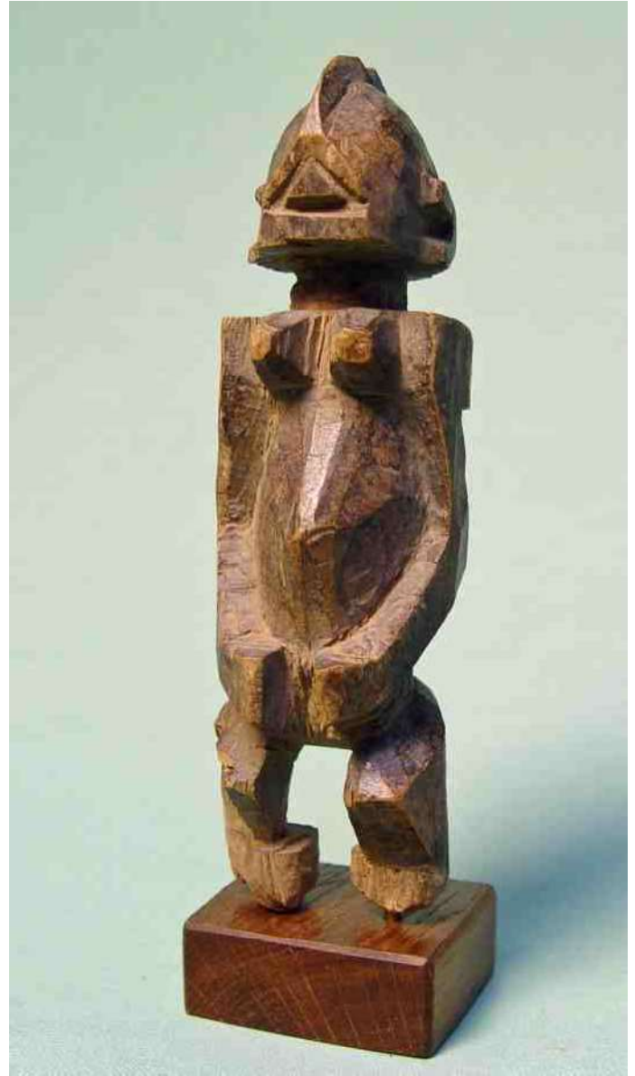
25. Driehoek gelaat, Dogon, h 14 cm

met in die pot een krachtig beeld zónder gelaat. Slechts die pot was te zien, niet het beeld. Aan mij werd uitgelegd, dat deze 'blinde' fetisj 'alle zicht op het dorp ontnemt' aan mensen die het dorp niet goed gezind zijn – door deze fetisj was het dorp voor hen onzichtbaar! Het ontbreken van het gezicht zou voor ons kunnen gelden als metafoor voor 'het zicht benemen', maar dan in een wel heel letterlijke betekenis. Dit is een duidelijke achtergrond van een fetisj zonder gelaat. Met die Tabitongo uitleg ben ik blij, omdat deze weer wat prijs geeft van de manier van denken en van de belevingswereld in het Dogongebied. Maar deze uitleg kan dus niet zomaar rechtlijnig doorgetrokken