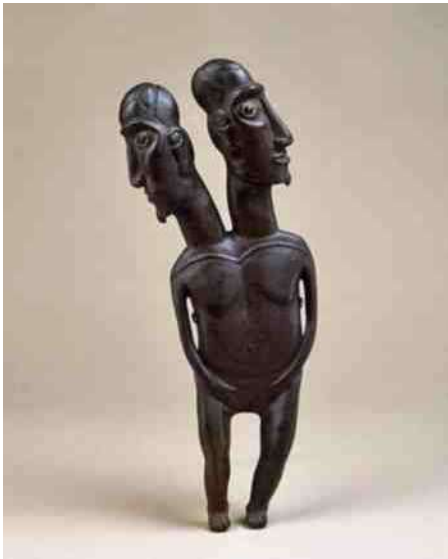
Twee hoofden in de Pacific: 43. Paas-