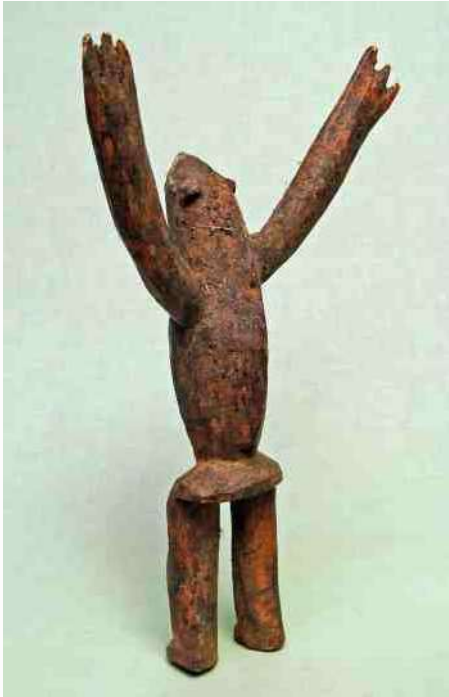
48. Lobi - half man, half pad - h 30