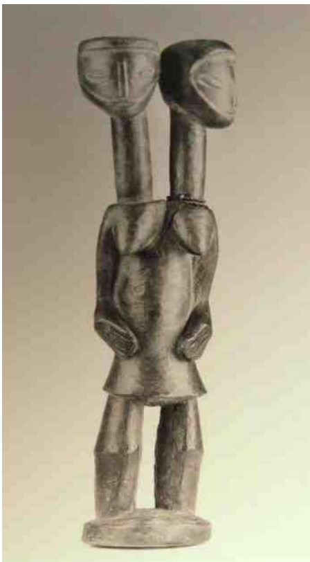
Ook in Oost-Afrika bij de Mambwe 36. en Westelijk bij de Chamba 37. en

beeld (afb 49). Transformatie in de zin van een veel groter of kleiner lichaamsdeel zoals we bij het sprookje 'Langnek' zagen is in de Afrikaanse kunst niet een specifiek verschijnsel, hoewel disproportionaliteit natuurlijk veel gezien wordt. Het buiten verhouding groter afgebeeld zijn van het hoofd, en vaak van geslachtskenmerken berust vooral op het grote belang, dat aan deze lichaamsdelen wordt toegekend.