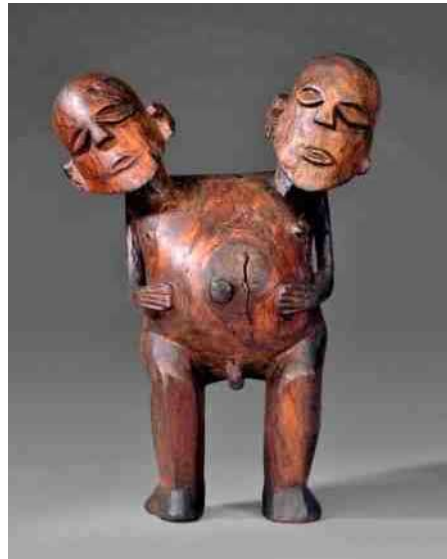
eiland ; en 44. de Societeits Eilanden