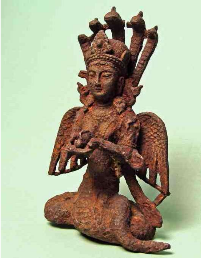
57. Slangenstaart & vleugels - Hindoe? Boeddha? - h 27