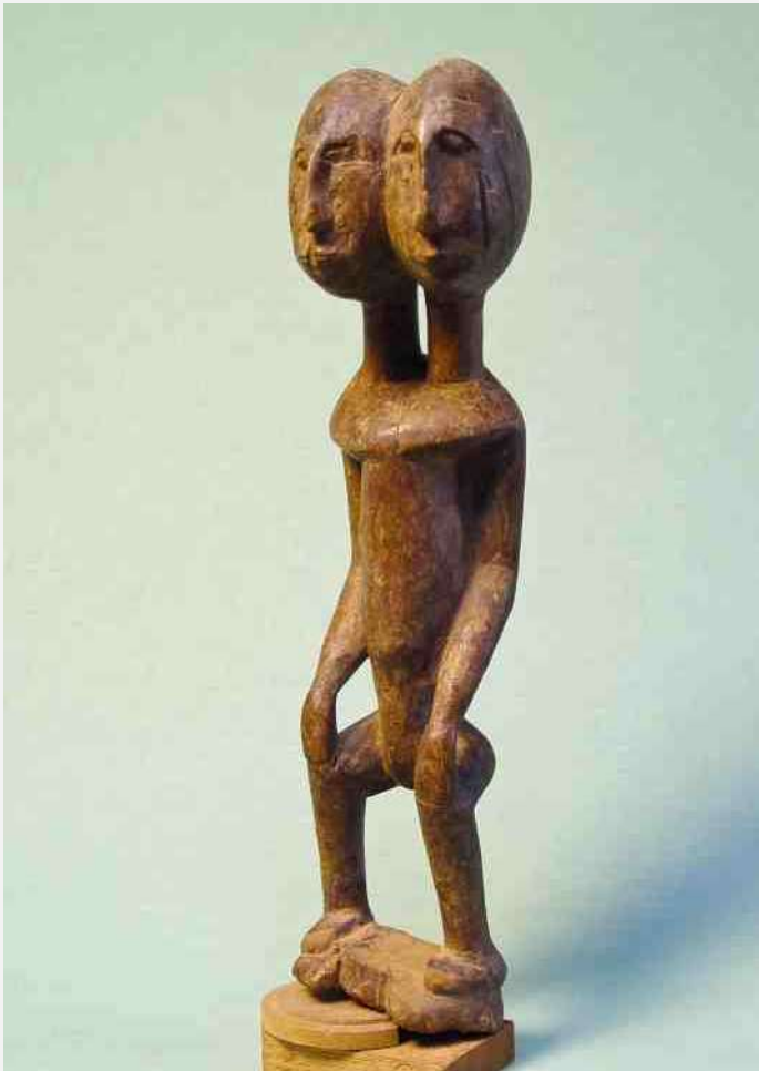
39. Dogon, tweehoofdig - hout h 41 cm - Sangha, en