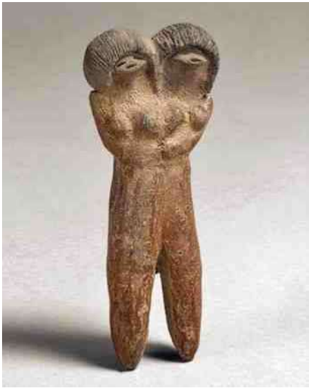
Twee-hoofdig - 33. pre-Columbiaans

(of wilde) men mij niet vertellen. Hetzelfde was het geval bij het drie-hoofdige Dogon bronsje (afb 40). Een beeld van een Dogonruiter op de rug van de antilope 'Ka' (afb 32) heeft zelfs ook twee bovenlijven. Hierna zal het niemand meer verbazen, dat tweehoofdigheid op veel meer plekken op de wereld te vinden is. Als voorbeelden laat ik nog twee beeldjes uit Oceanië zien, een van Paaseiland (afb 43) en een van de Sociëteits-Eilanden (afb 44).