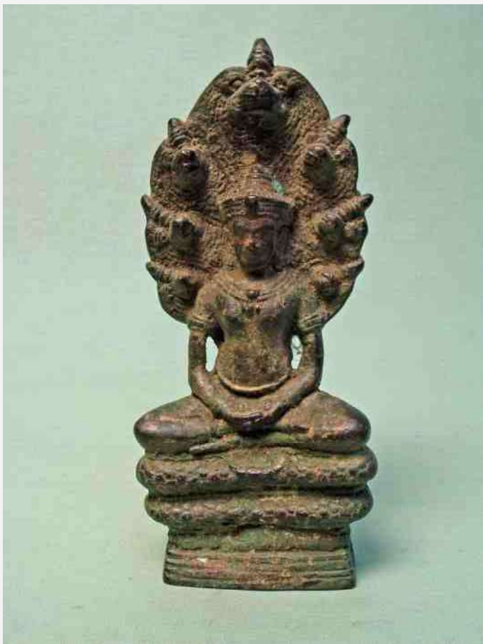
41. Boeddha óp en overhuifd door 7-koppige Naga. h 19