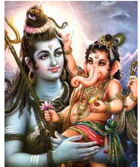
45. Ganesha nog steeds van deze tijd