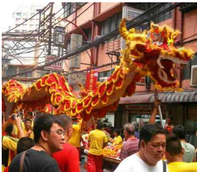
61. Chinese draak in de stad