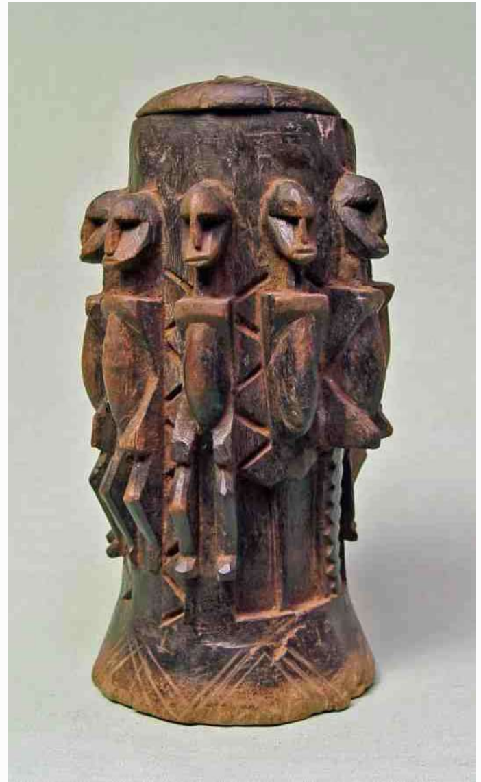
52. Dogon zalfpot - 7 vd 9 mensen hebben benen - h 24