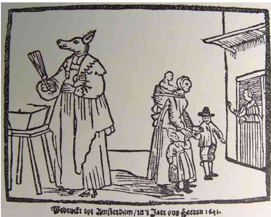
46. het meisje met de varkenskop van de 17e tot ver in de 19e eeuw populair

Toch zie je in de Afrikaanse kunst niet echt vaak een mensfiguur met dierenkop, maar het bestaat wel, zoals het aardewerken Dogon beeldje van een mens met geitenkop op afb 44. Andere Afrikaanse voorbeelden zijn een Lobi mensfiguur met paddenkop (afb 48) en een Senufo beeldje van een zittende menselijke gestalte met een paardenkop (afb 50). Voor de meest