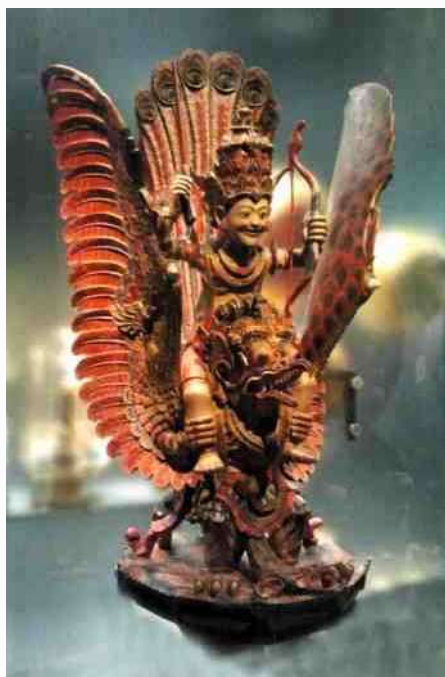
55. Het rijdier van de god Vishnu : Garuda, als vogel met tanden