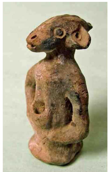
47. Dogon terra, geitenkop h 11 cm