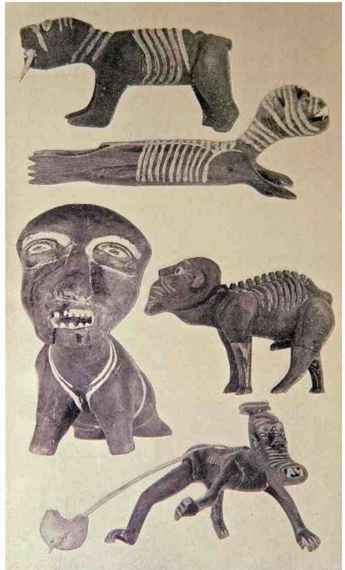
onbestemde wezentjes bij de Inuït. Links uit bot gesneden.