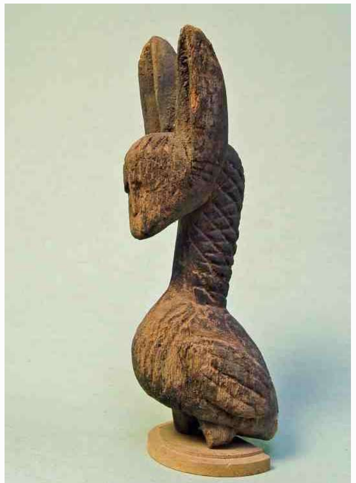
60. Dogon - combinatie van vogel en haas - h 25 cm