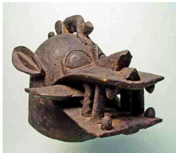
62. Senufo - krokodil & zwijn, Wabele masker – L 43

vereend met de veelkoppige slang zoals hier. En weliswaar wordt hij vaak met vleugeltjes afgebeeld, maar dan alleen met rudimentaire vleugeltjes aan de zijden van zijn nek, zoals dit ijzeren beeld ook heeft. Maar daarnaast heeft dit beeld tevens 'echte' vleugels. De figuur van afb 57 zal waarschijnlijk dan ook niet de Boeddha voorstellen, maar een Hindoeïstische tegenhanger.