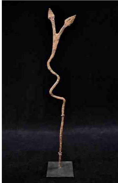
49. Lobi - tweekoppige slang, ijzer