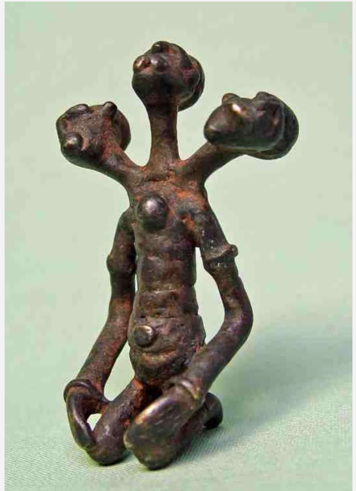
40. Dogon, driehoofdig - brons h 7 cm - Jadianga