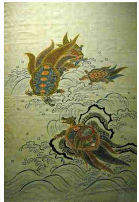
56. Kraanvogel & schildpad combi staat voor : lang leven & geluk