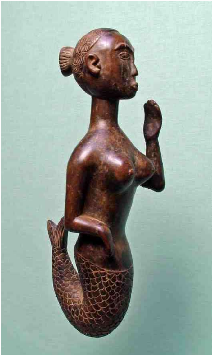
51. Ovimbundu - Mami Wata, hout - h 43 cm