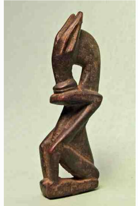
50. Senoufo-man met paardekop, h19