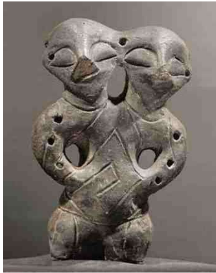
34. in Neolitisch Servië, maar ook in

(of wilde) men mij niet vertellen. Hetzelfde was het geval bij het drie-hoofdige Dogon bronsje (afb 40). Een beeld van een Dogonruiter op de rug van de antilope 'Ka' (afb 32) heeft zelfs ook twee bovenlijven. Hierna zal het niemand meer verbazen, dat tweehoofdigheid op veel meer plekken op de wereld te vinden is. Als voorbeelden laat ik nog twee beeldjes uit Oceanië zien, een van Paaseiland (afb 43) en een van de Sociëteits-Eilanden (afb 44).