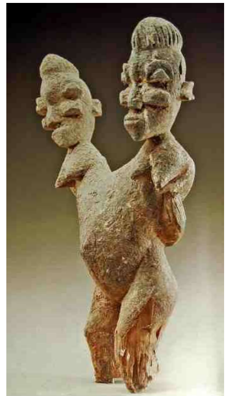
de Lobi 38. zien we Tweehoofdigheid