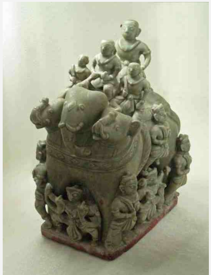
42. Driekoppige olifant, Thais aardwerk 15e eeuw