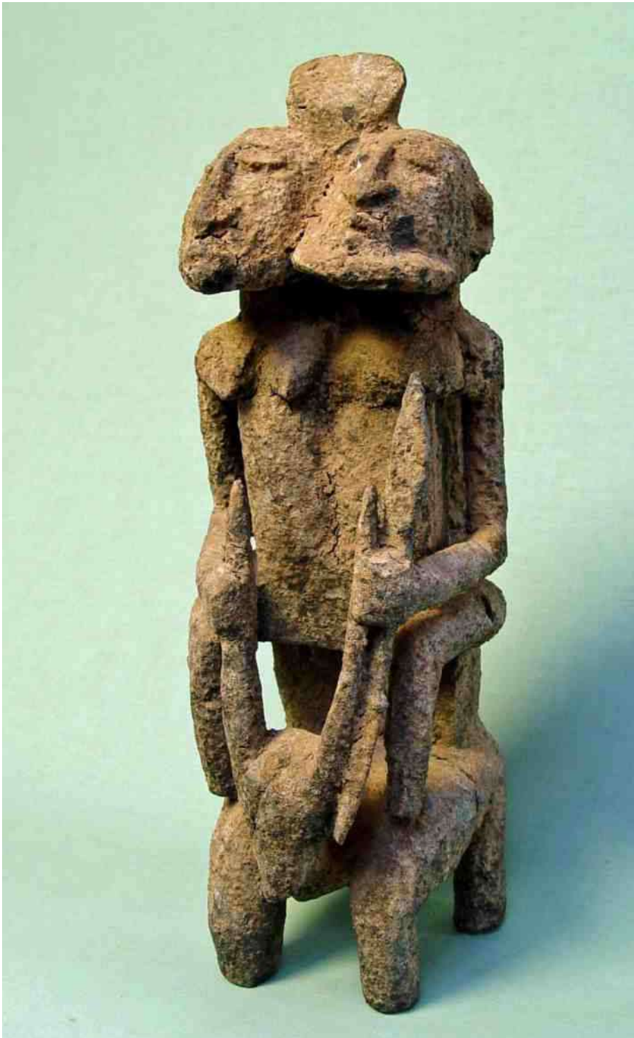
32. Dogon - Samen in één onderlijf, ruiter-koppel op de Antilope 'Ka' - h 42

Bij allerlei vreemdsoortige wezens, die in tribale en religieuze kunst zijn afgebeeld, realiseren wij ons nog nauwelijks, dat de tribale mens zulke wezens steeds in zijn directe omgeving weet. In het vorige nummer hebben we ze leren kennen als de goddelijke mogelijkheid om een afwijkende gestalte aan te nemen.