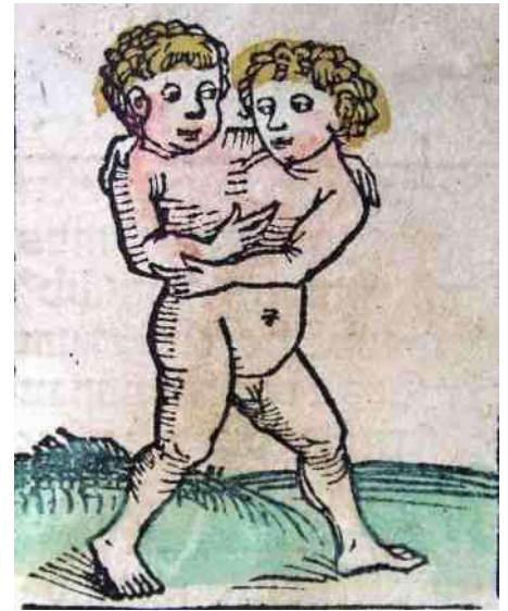
35. het Middeleeuwse Neurenberg

Meerkoppigheid van dieren kenden we al uit de mythologie, bij 'onze' hellehond Cerberus (afb 11), en bij de veerkoppige slang Naga, (afb 41) die de Boeddha beschermend overhuift. Een mooi Swankalok beeld van een olifant met drie koppen (afb 42) bevindt zich in de collectie van het Leeuwarder Museum Princessehof. Dit komt uit Thailand en stamt uit de 15e eeuw. Maar ook bij de Afrikaanse Lobi is de meerkoppige slang vaak afge-