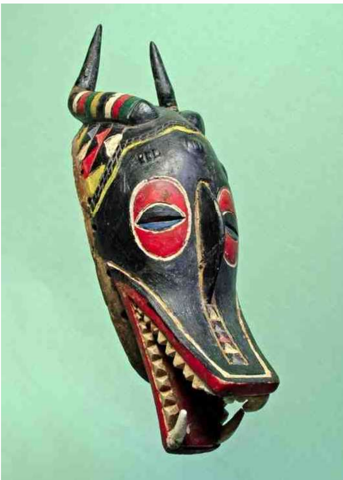
59. Guro - Luipaard & antilope: Zamble masker - h 40