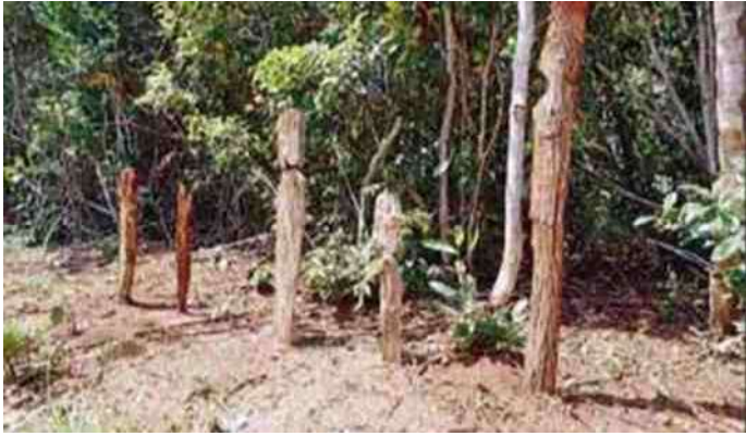
9. Kaya Forest met eenvoudige palen