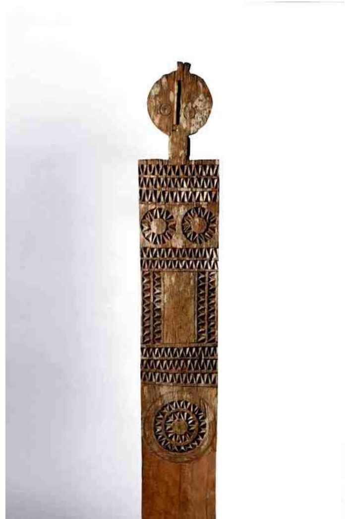
5. Kigango van de Girijama in Kenia