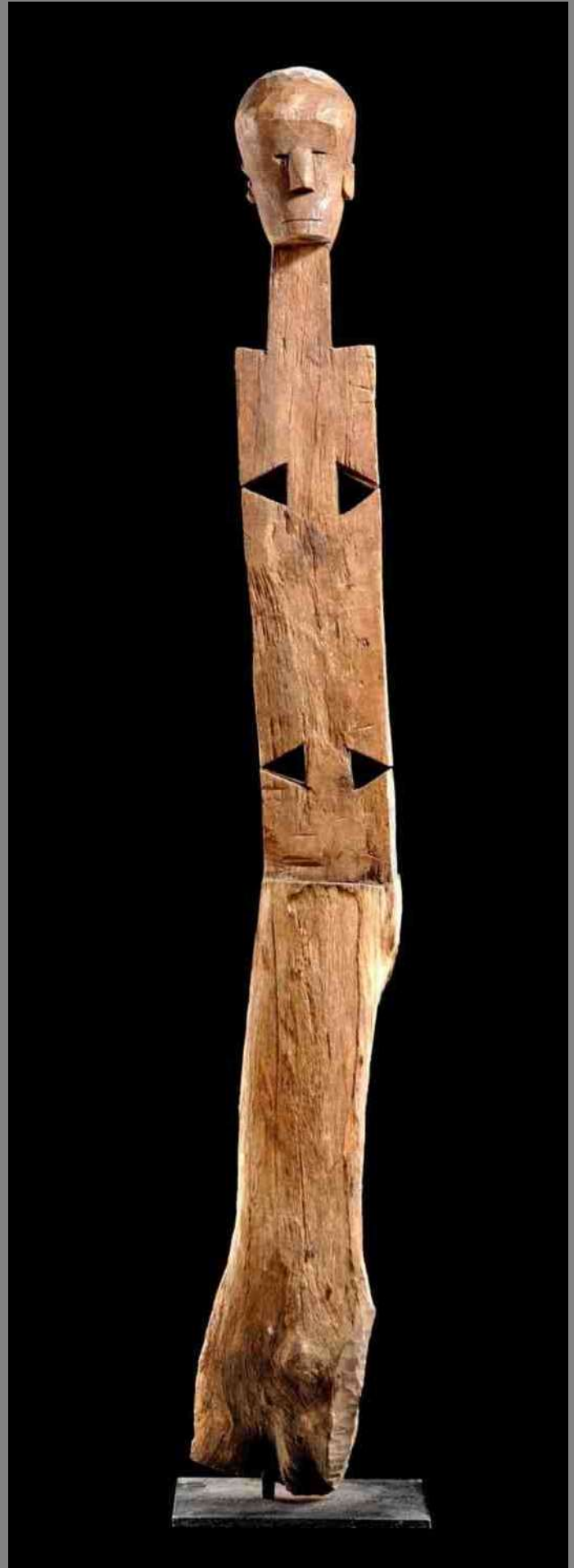
3. Kikango, 157 cm, in 2009 geveild bij Zemanek