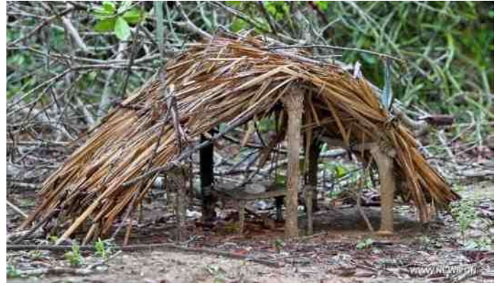
10. mini-geestenhuisje bij de ingang van het heilige bos

11. De palen maken nog steeds deel uit van een levende cultuur bij de Mijikenda. Maar mooi gesneden oude palen zijn nauwelijks meer te vinden. Is dit het einde van een artistieke traditie of de poging gedenkpalen te maken die er zo oninteressant mogelijk uitzien, zodat men mag verwachten dat ze niet worden gestolen?