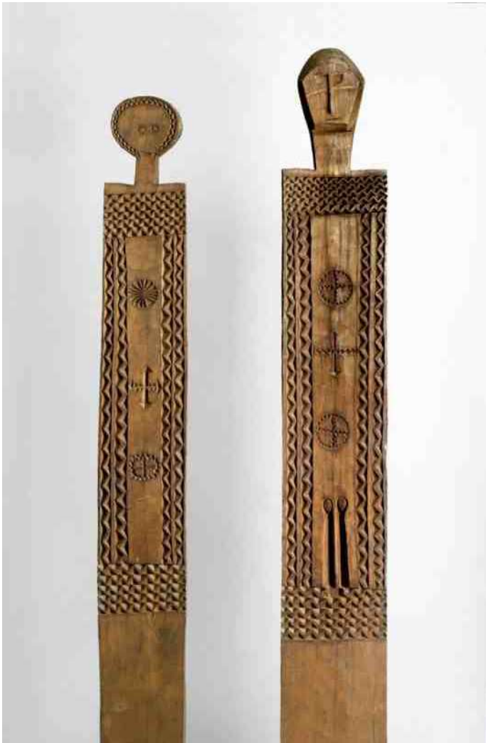
4. Vigango van de Girijama in Kenia, hout, 196 cm