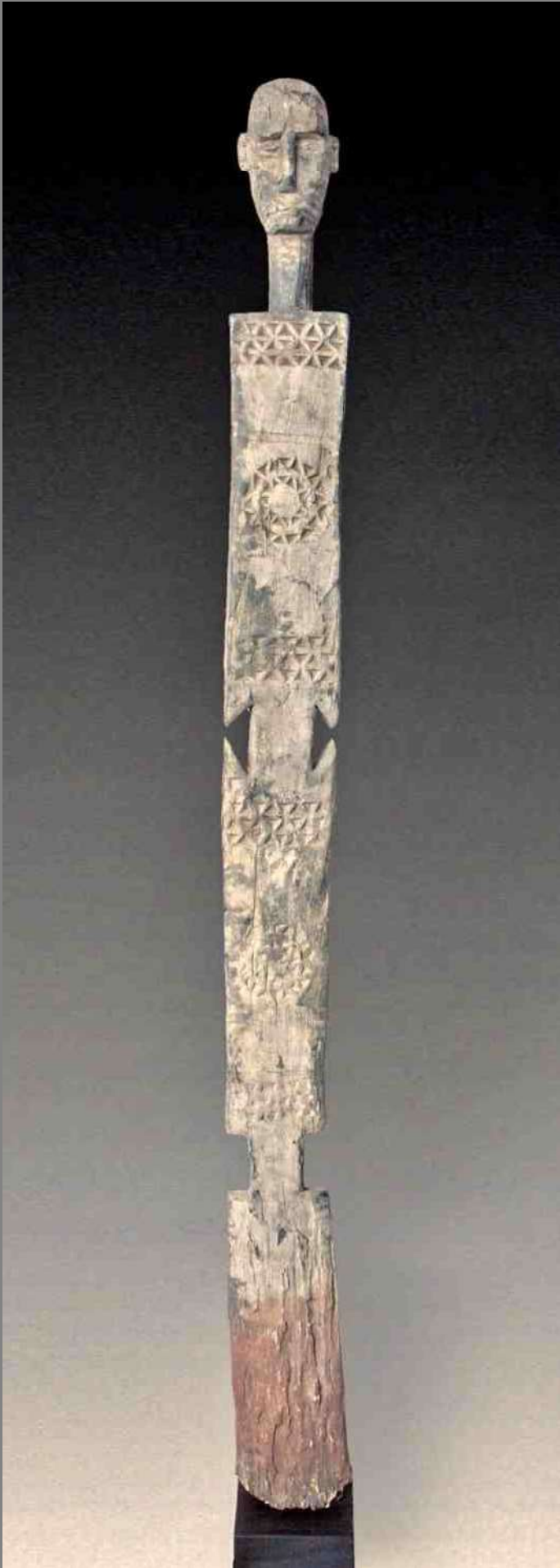
2. Kigango van de Girijama, 169 cm - Bwoom Gallery