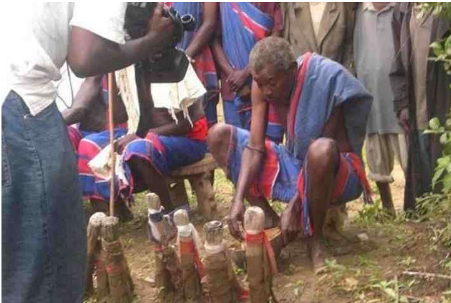
8. Verzorging van de houten palen bij een Mijikenda dorp