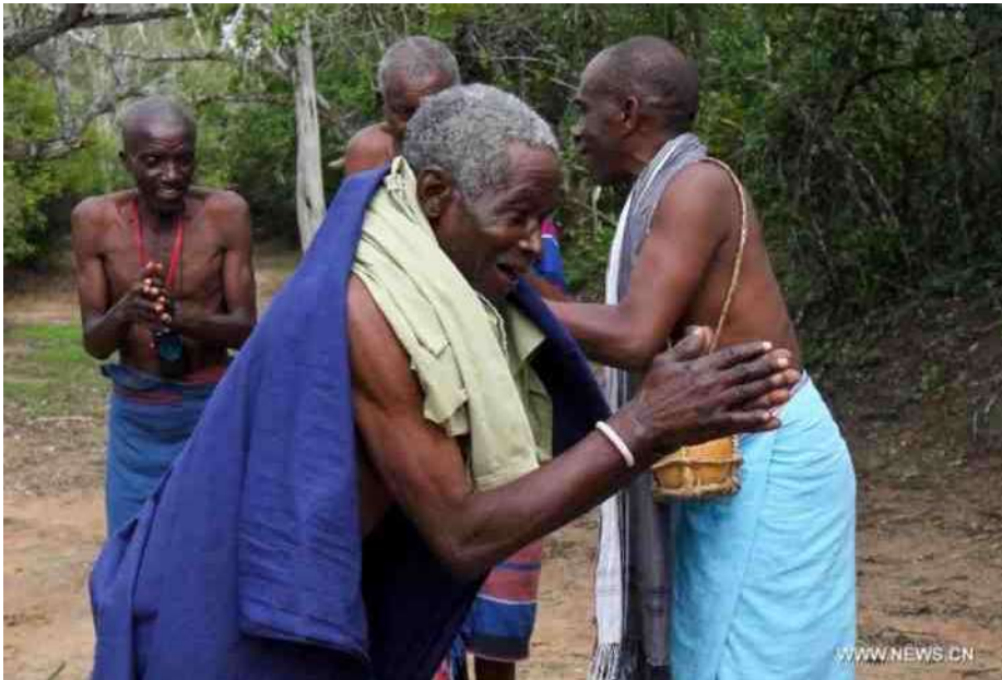
7. Traditionale dans door Mijikenda ouderen in het heilige bos