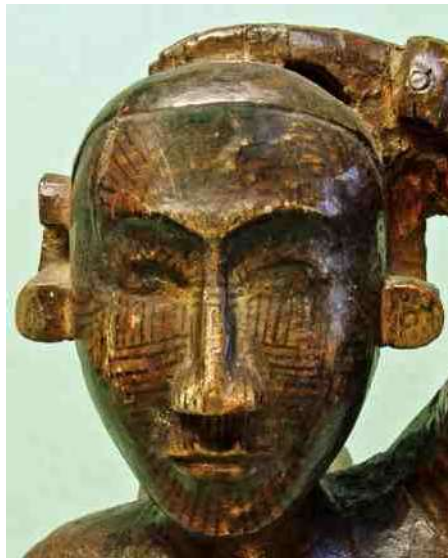
1. 'weer Chin vrouwen onder elkaar'