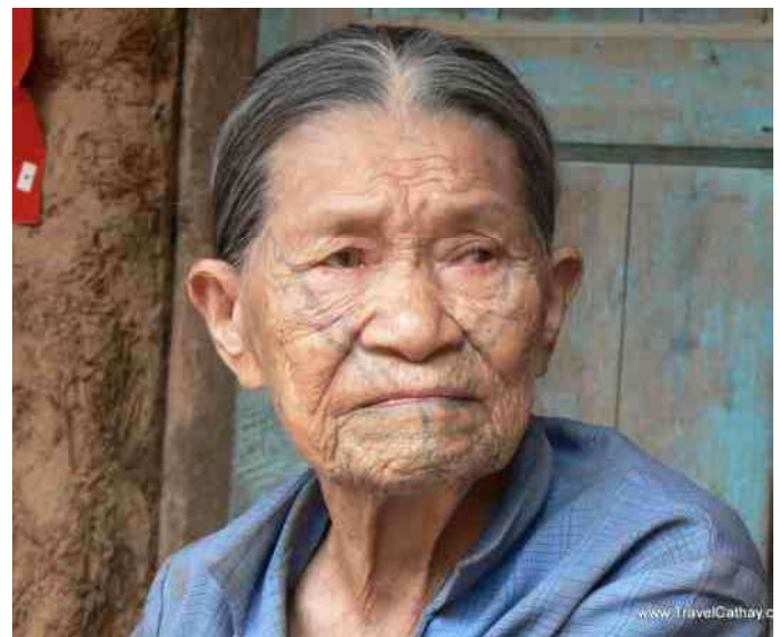
8. Vrouw van eiland Hainan in de Zuid Chinese Zee