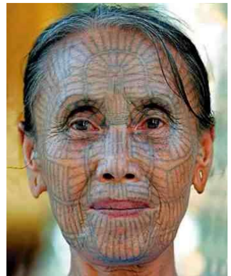
7. Chin vrouw - Birma

women' (mannen hebben geen tatoos) vond ik steeds zo'n zelfde soort lijnenspel in het gelaat, met wát variatie tussen de verschillende portretten, maar bij de meesten met precies zo'n 'zonnetje' op het voorhoofd en radiaire stralentekening op de kin. En daarbij ook nog de cilindrische oorpluggen. Daarmee was de puzzel over de herkomst van dit beeldje zomaar ineens opgelost!