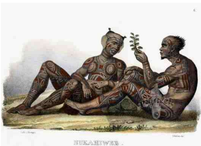
4. Nuku-Hiva - tatoeages op de Markiezen-eilanden

wand van vrouwen met een gezichtstatoeage die naar mijn idee wel heel erg leek op die van mijn beeldje! Stomtoevallig was juist daar een tentoonstelling geweest over de gezichtstatoeages bij Chin vrouwen in Birma. De catalogus was zowaar nog te koop [1]! Thuisgekomen ging ik vergelijken, en inderdaad, precies zo'n geometrische figuratie als op mijn beeldje (afb 6). En daarna Googlend op het Internet onder 'Chin