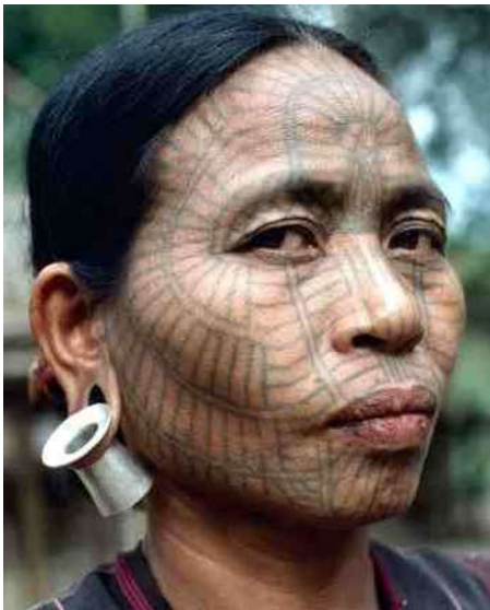
6. Chin vrouw - Birma