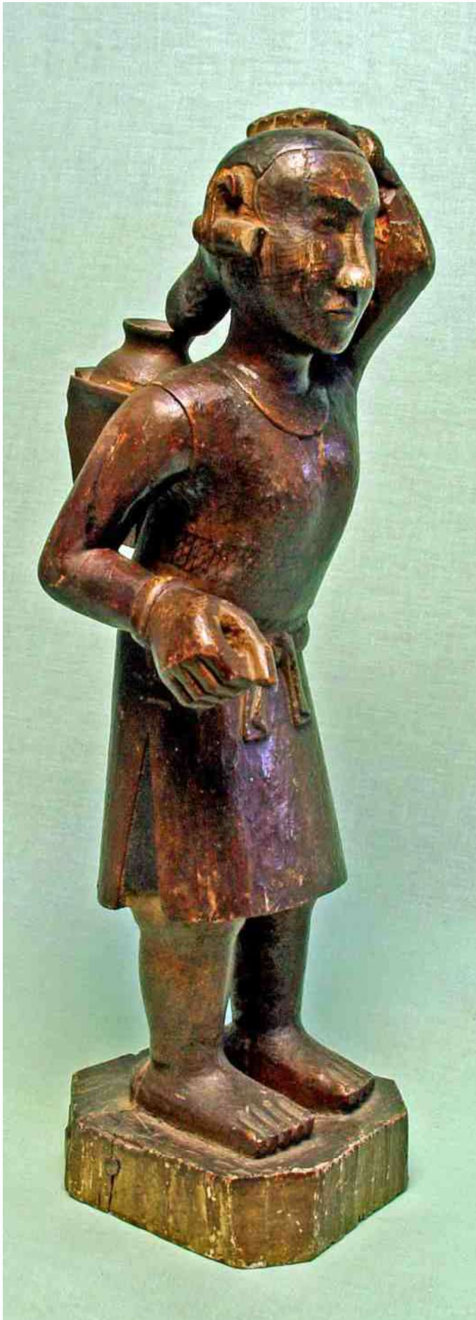
1b. Mand op de rug - Vol getatoeëerd gelaat.