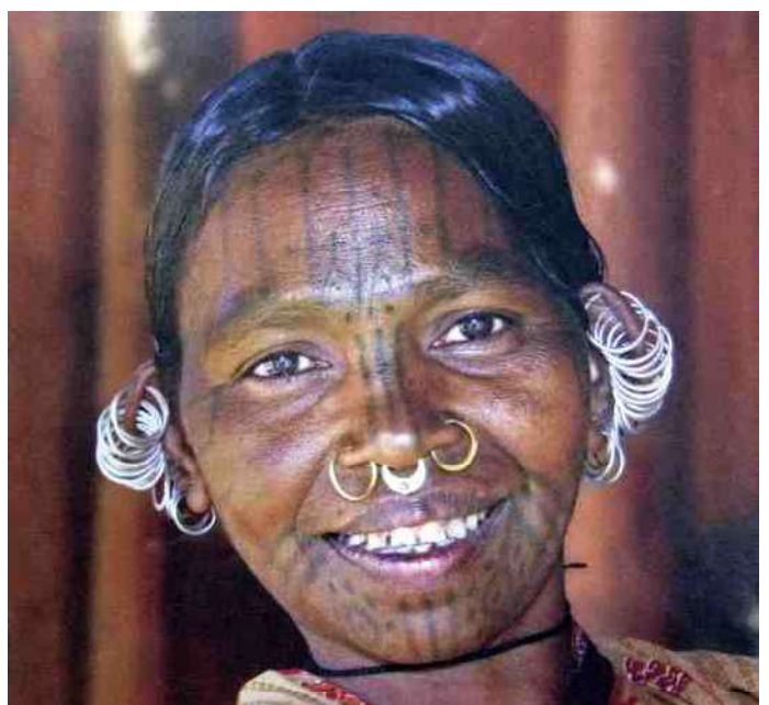
9. Adivasi vrouw - Kutia Khond-stam in Orissa, India