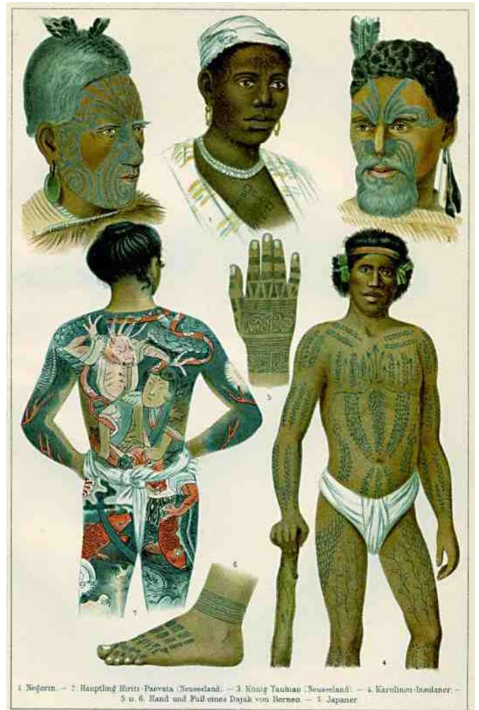
3. Tatoeages uit verschillende werelddelen

vergelijkbare mand op de rug gebruikelijk (afb 5). Maar dit tattoo-patroon, en zó uitgebreid over het hele gelaat bij vrouwen, dat vond ik niet. En daarna liep het spoor dood en werd het weer jarenlang stil rond dit beeldje.