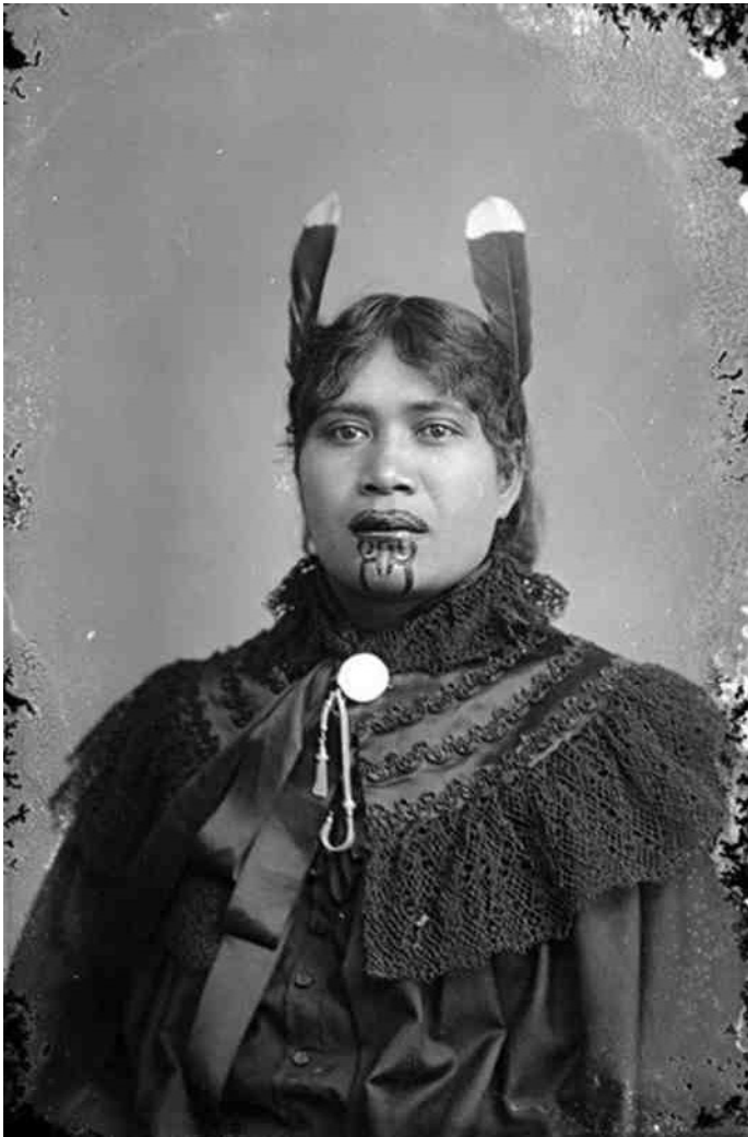
2. Maori vrouw met kin-tatoeage - eind 19e eeuw