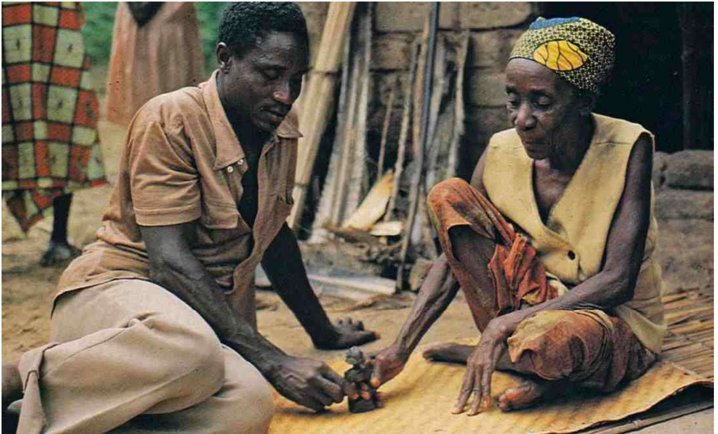
10. Het schuiven van de Kashekesheke op de mat voorspelt te toekomst.