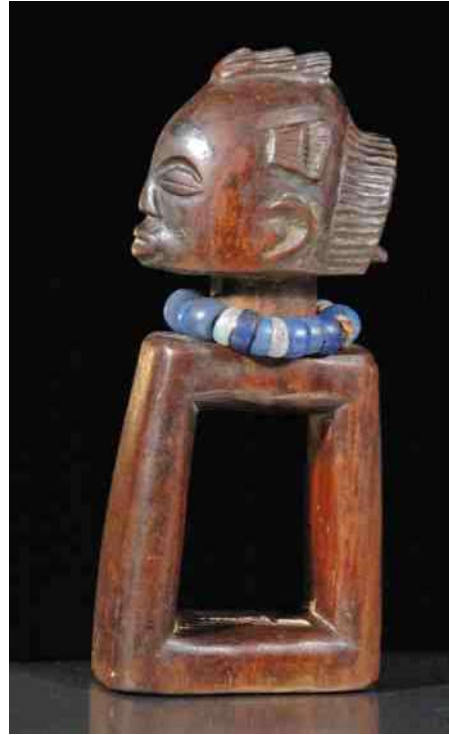
6. Soms omhangen met kralen.