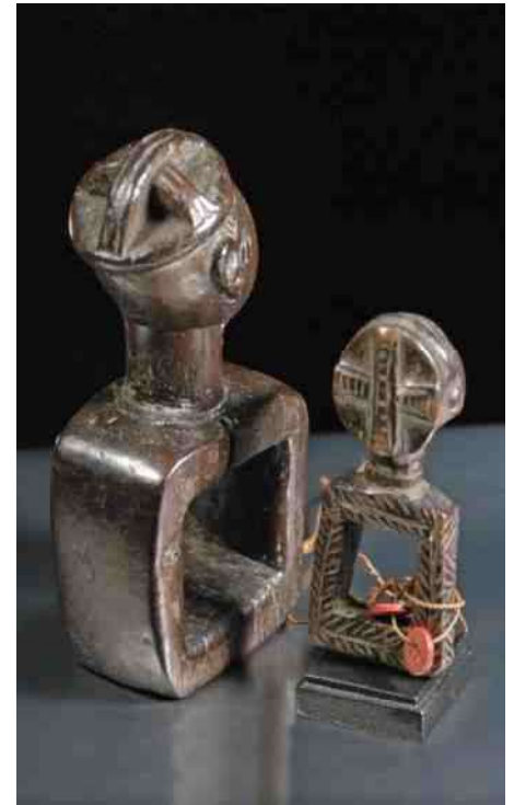
7. Katatora's met 'kruis-kapsel'

ten aanzien van de techniek, de historische betekenis en de symbolische dimensie. Daarom wordt bij de beschrijving van deze stukken intensief gebruik gemaakt van zijn tekst. Het kruisvormig kapsel, zoals te zien op de katatora van afb 7, is terug te vinden bij alle volken van de oostelijke Luba, grenzend aan het gebied van de grote meren. De afgeronde vorm van het hoofd en de opgeschoren schedel roept het beeld op van de hemel, de vier vlechten symboliseren de vier windrichtingen.