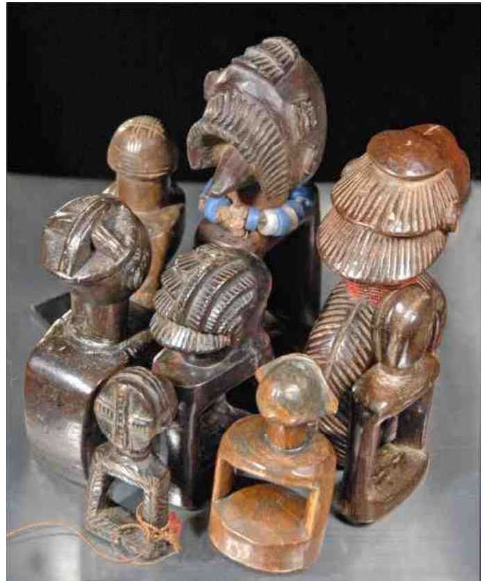
15. verscheidenheid aan kapsels bij een achttal Katatora

De afbeeldingen 2, 4, 5, 6, 7, 8, 9, 11 en 15 zijn foto's, die zijn vervaardigd door de auteur. Deze voorwerpen zijn uit zijn eigen collectie. De afbeeldingen 1, 3, 10, 12 en 14 zijn minder van kwaliteit, doordat dit scans zijn van print-foto's (bewerkt ter vermindering van het printtraject)