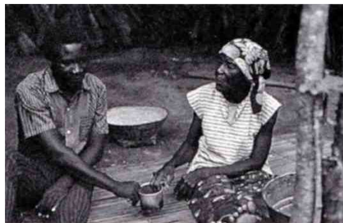
2. Ook een beker kan goed functioneren als wrijf-orakel.

ving is te vinden op de site van het Tropenmuseum te Amsterdam als toelichting bij de katatora uit hun collectie. Zij schrijven dat het orakel een middel is om een geschil tussen twee partijen te beslechten. De ruziënde partijen moeten zo hard mogelijk aan het orakel trekken en "degene die het hardst trekt (geholpen door bovennatuurlijke krachten) heeft gelijk".