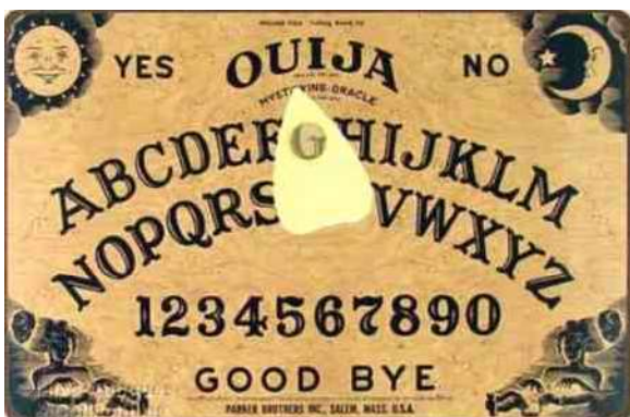
13. Het 'ouija-bord' = 'ja-nee-bord', met fiche.

Een seance met het wrijf-orakel begint met het omschrijven van de vraag, het bepalen van de vergoeding voor de waarzegger en het voorbereiden van het orakel. Dan wrijft de waarzegger met aromatische kruiden over het hout, om slapende krachten van de geesten wakker te maken en spreekt dan een eregroet uit