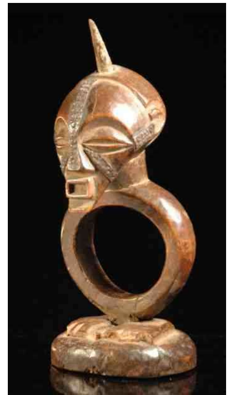
4. Songye wrijfforakel - h 23 cm