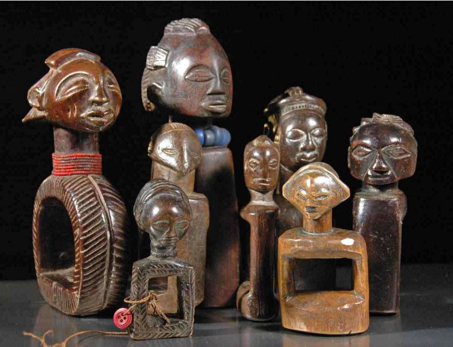
Collectie "Katatora" - de hoogste meet 21 cm

Na "de Waarzeggersmand van de Chokwe" in september 2014, zijn nu de attributen van de Luba-waarzegger aan de beurt. Om zicht te krijgen op de toekomst worden door de Baluba wrijfborakels gebruikt, die zij "kashekesheke" of "katatora" noemen.