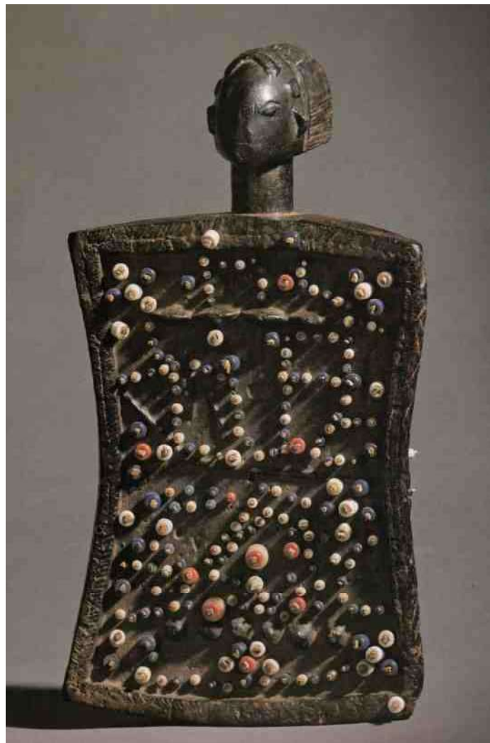
1. Een Luba 'geheugenbord', met uitgebreide codes

Strikt genomen kan deze vorm van waarzeggerij door iedereen worden beoefend. Toch zal men zich in de meeste gevallen voor het gebruik wenden tot een ingewijde, meestal een vrouw. Het orakel wordt niet alleen gebruikt voor het waarzeggen maar ook voor het regelen van schuldkwesities. Het orakel is er niet zozeer om de toekomst te voorspellen, maar eerder een reconstructie van het verleden om het ongeluk in het heden uit te leggen [3 - p178]. Een opmerkelijke omschrij-