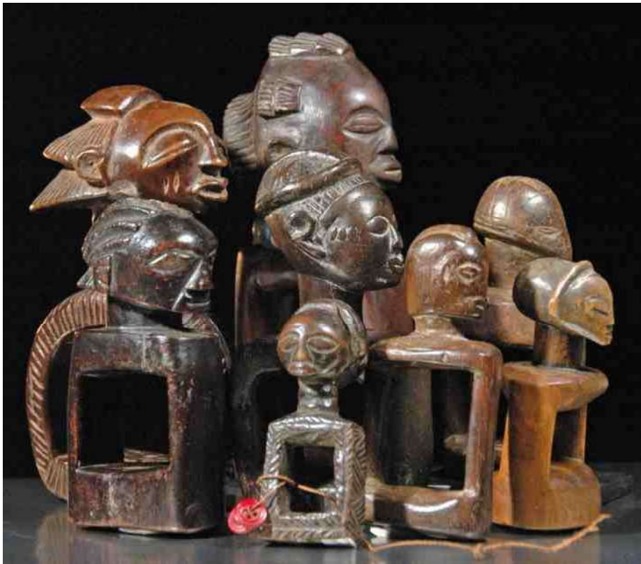
3. Wrijfforakels, gezien van de 'open' zijde