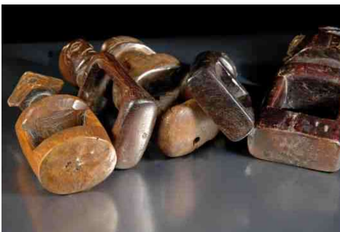
11. Vaak voorspellen maakt de voet mooi glad.

De inwijding in het beroep van waarzegger zou gepaard gaan met het inbrengen van medicijnen in de huid van de rechterhand via een kleine insnijding en wel tussen de duim en de wijsvinger waar de hand het orakel raakt [3 - p185]. Dit "lusalo" ritueel zou dienen om de kracht en de voorspellingsgaven te vergroten [10 - p335]. Om de krachten van de geest Mpombo in het orakel op te wekken wordt bij het begin van de seance het orakel ingewreven met prikkelende kruiden, want door de ogen en de oren van deze geest geeft het orakel een antwoord [5 - p52].