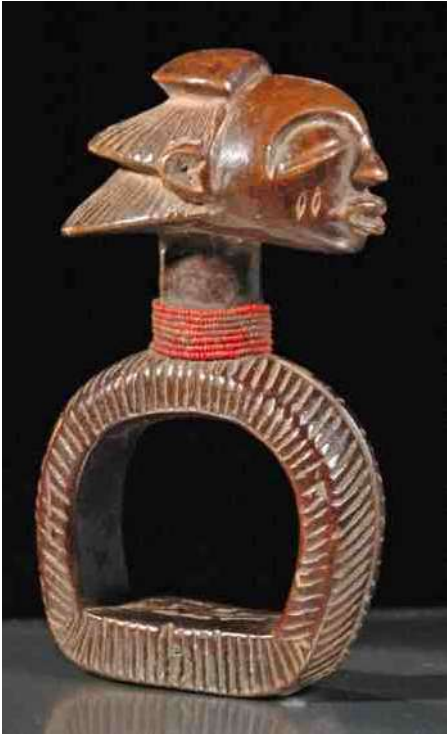
5. Karakteristiek 'Waterval-kapsel'.