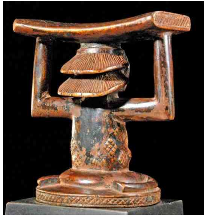
8. Neksteun ter bescherming van het Waterval-kapsel

Watervalkapsels vinden we bij de centrale Luba. Ze zijn zonder meer spectaculair. Het kapsel bestaat daar uit diverse horizontale golven haar, die boven elkaar worden geconstrueerd met behulp van onder meer buffelhaar, raffia en andere materialen. Koperdraad, het rode tukulapoeder (Afrikaans Sandelhoutpoeder) en olie worden ter versteviging aangebracht. Er zijn ook varianten, waar deze golven niet horizontaal maar verticaal lopen.