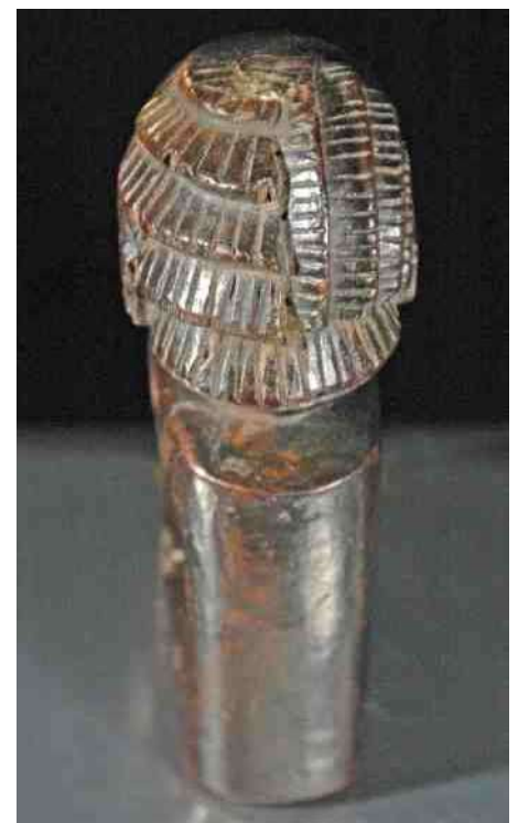
9. Kopje van wrijforakel, met aan de ene zijde het vrouwelijke waterval-kapsel, en aan de andere zijde het mannelijke kapsel met het haar in vertikale banen.