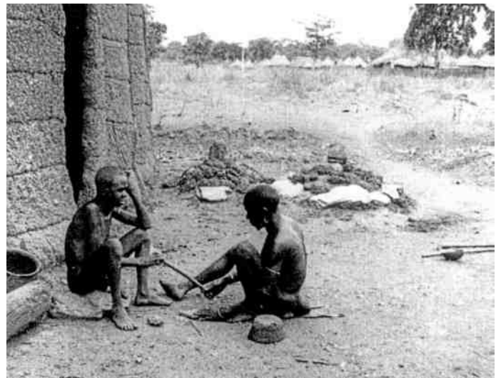
14. Opanhou waarzegger met orakel-stok. Benin 1930.