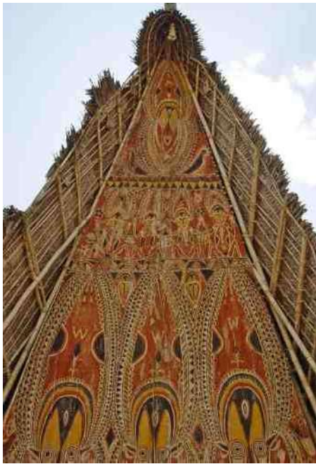
2. Beschilderde gevelnok van het ceremoniële Tambaran-huis in het dorp Apangai. Op de vorige blz. dit huis in zijn omgeving.