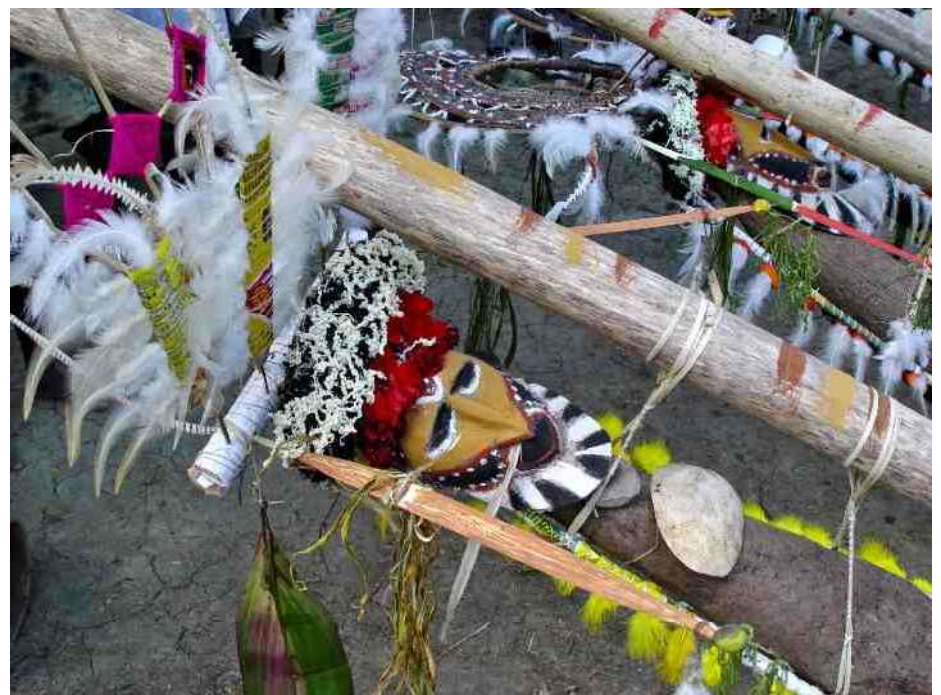
7. Maskers van hout, plantenvezels en veren

Aan het einde van het groeiseizoen worden de Yams tijdens een feestelijke ceremonie opgegraven. De mannen versieren de yams met veren, maskertjes, vruchten e.d. Ook jongetjes mogen helpen. De yams zien er dan net zo uit als de mannen die de feestdans uitvoeren. Waardesymbolen als de karahut (of gumbale - zie afb. 10b) en geldringen worden soms op de yams gelegd. De reuzen yams worden gezien als geestvolle wezens, als persoonlijkheden die kunnen zien en horen. Die menselijke identiteit van de yams klinkt ook door in termen als 'borstomvang' en 'bovenbeen', die