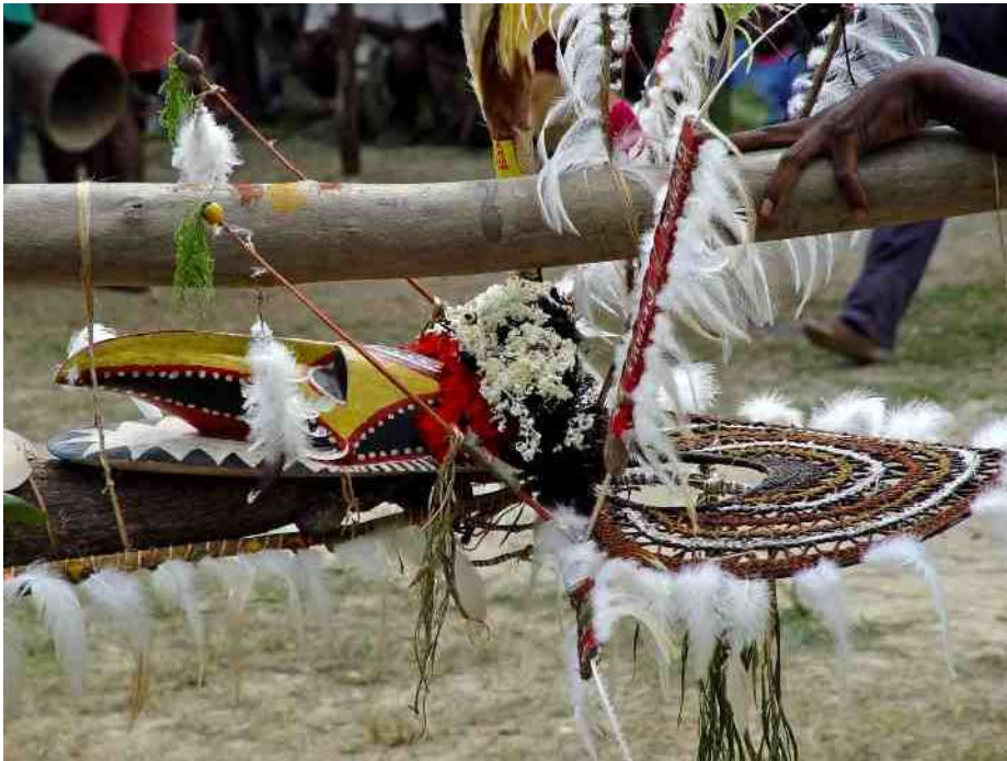
6. Masker op de bovenkant van een reuzen-yam, hangend onder een staak