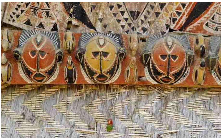
9. Houtsnijwerk op de draagbalk van het Tambaran-huis

ste en mooiste yam heeft ingebracht. Elk dorp dat mee doet levert slechts één yam, dit is de ceremoniële Yam. Het winnende dorp moet het volgende jaar de festiviteiten organiseren. Na afloop van de festiviteiten worden de yams weggeven aan een ander dorp, om op te eten. Niet naar iemand uit de eigen familie. Je eet uiteindelijk niet je eigen voorvaderen op. Daarmee ontstaat echter ook bij de ontvanger (uit een andere sociale groep) een zekere schuld, en is deze daardoor verplicht een tegenprestatie te leveren. Direct of wellicht jaren later, als het maar in verhouding staat. Achter deze jaarlijkse yamwedstrijden zit een gedachte van het hebben van overwicht – superioriteit over de verliezers. Hoe groter jouw yam is, hoe meer invloed, macht en prestige je krijgt over de ontvanger van de yam. Weigeren is er niet bij.