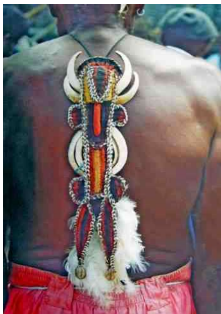
10b. Karahut op rug van 'Big man'

gingen werd de karahut in de mond gedragen om de vijand angst in te boezemen. Het is zeker geen dagelijkse versiering.