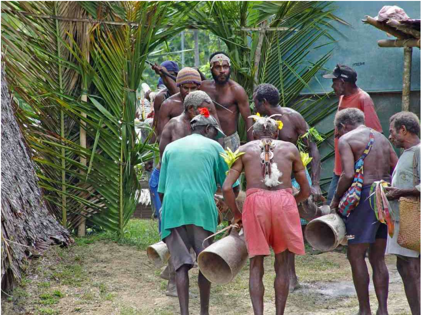
10. De trommelende 'big men' komen achterwaarts het feestterrein op.