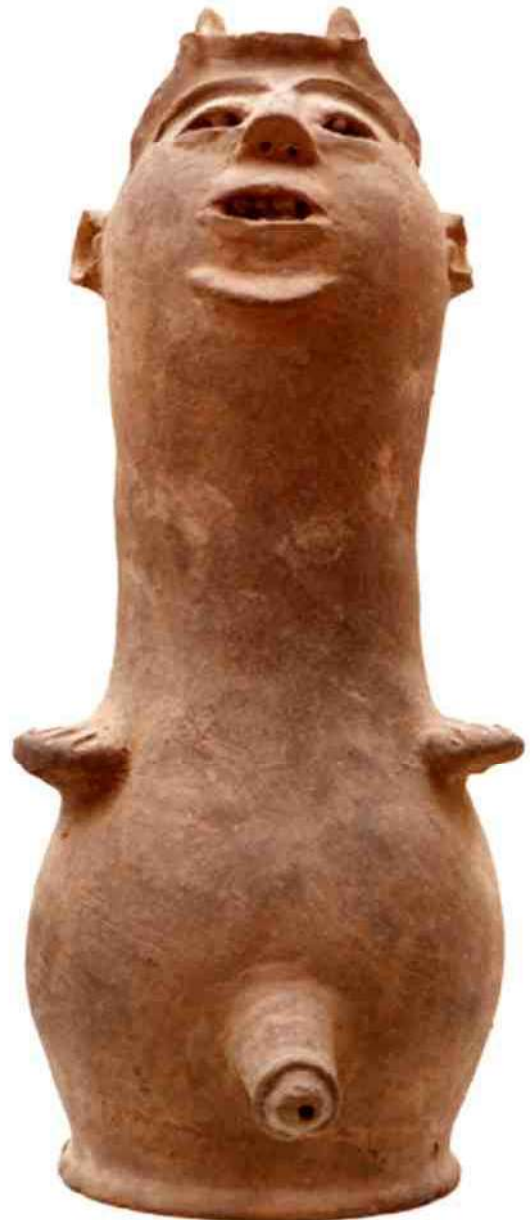
5b. de mannelijke kant in vooraanzicht

De Légba wordt traditioneel geplaatst op een verhoging of altaar in het huis of op de binnenplaats, met het gezicht naar buiten gericht. Het is voor de bewoners een vast ritueel om de Légba zoveel mogelijk te laten meegenieten van spijsen en dranken, anders zou hij wel eens rare streken kunnen uithalen. Boven op het hoofd is meestal een omranding met een gat gemaakt om het offeren van spijs en drank gemakkelijker te maken (afb 6b).