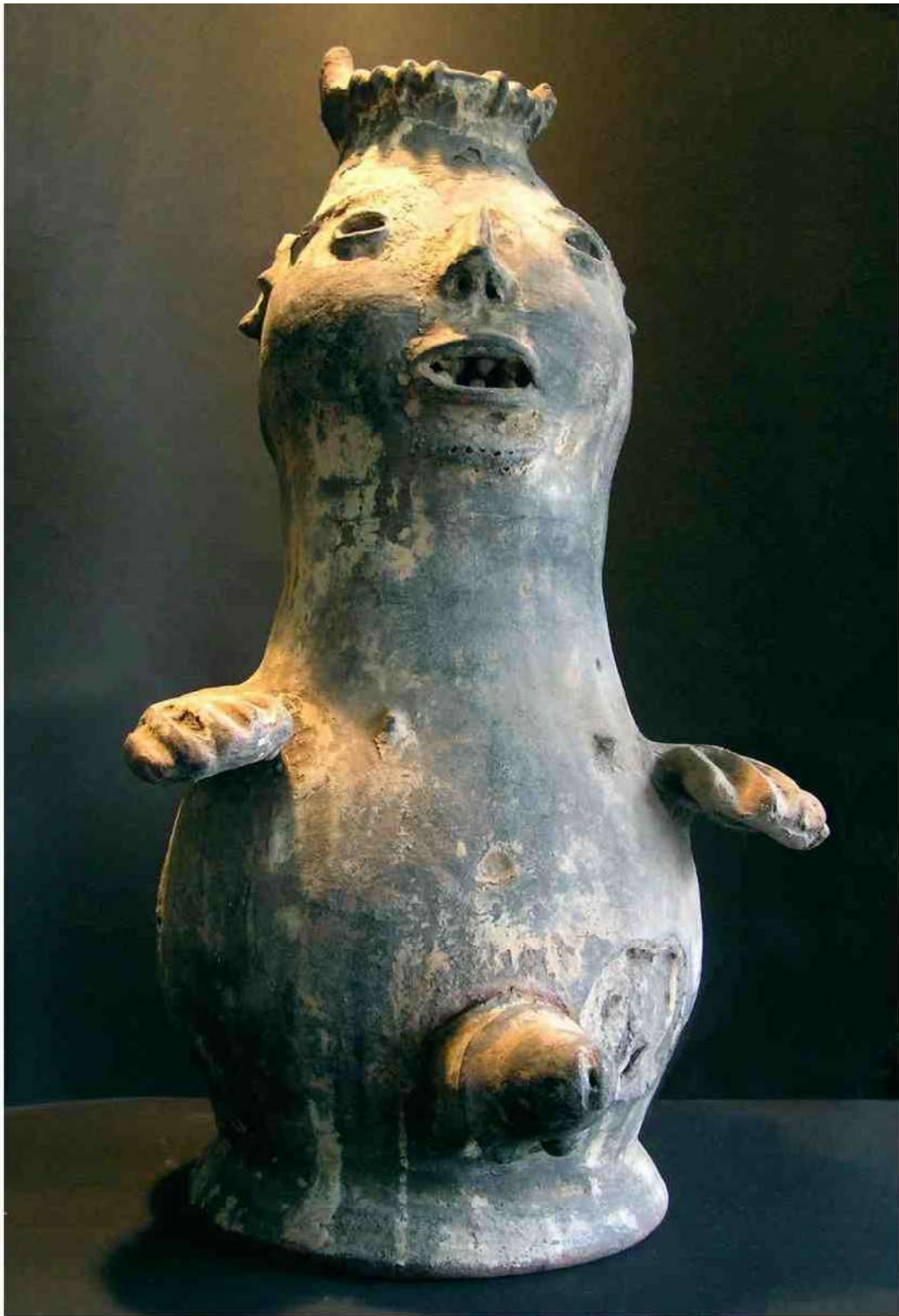
6c. de 'huis-Légba' van de auteur. h 54 cm