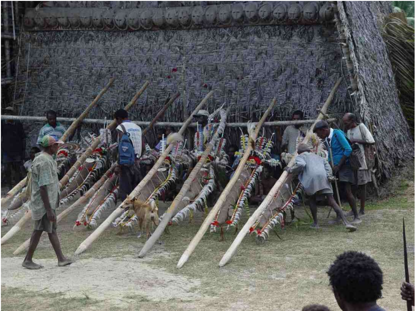
8. De ceremoniële Yams staan opgesteld voor het Tambaran-huis, klaar voor het opmeten.

gebruikt worden tijdens het meten van de grootte van de yam. Want die grootte is belangrijk in de onderlinge competitie. Op het dorpsplein, waar de yams zijn opgesteld,