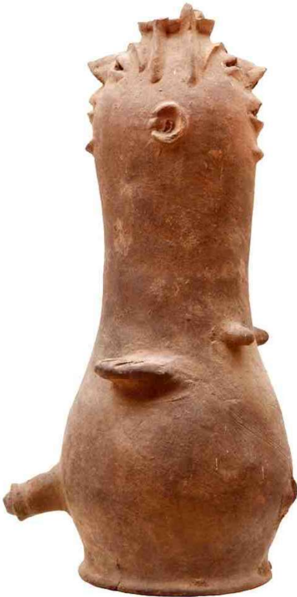
5a. een Légba, die aan een kant mannelijk is, en aan de andere kant vrouwelijk