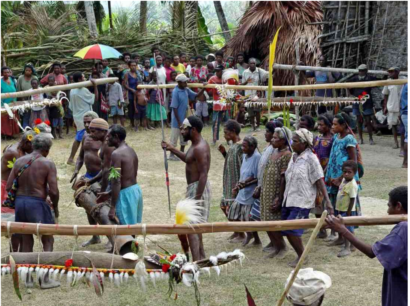
11. Onder tromgeroffel worden de versierde yams in een rondedans getoond.

Tja, wat is tijd in Nieuw Guinea? De mensen waren open en vriendelijk naar ons toe. Wat ons verbaasde is, dat er een Franse en een Japanse antropoloog aanwezig waren. Zij memoreerden, dat de cultuur van de Abelam verloedert en dat er onder de jongeren geen interesse meer is voor de culturele gebruiken. Rond half twee kwam er plots tromgeroffel uit het mannenhuis. Mannen liepen tromroffelend achterwaarts het plein op en werden gevolgd door zingende vrouwen. De ouderen keken geboeid toe, terwijl de jongeren ongeïnteresseerd met andere dingen bezig waren. Er leek inderdaad duidelijk sprake van een generatiekloof. De mannen droegen de gigantische yamwortels. De wortelknollen waren prachtig versierd, de één nog mooier dan de ander. We stelden vast dat de abelam met hun tijd meegaan, want