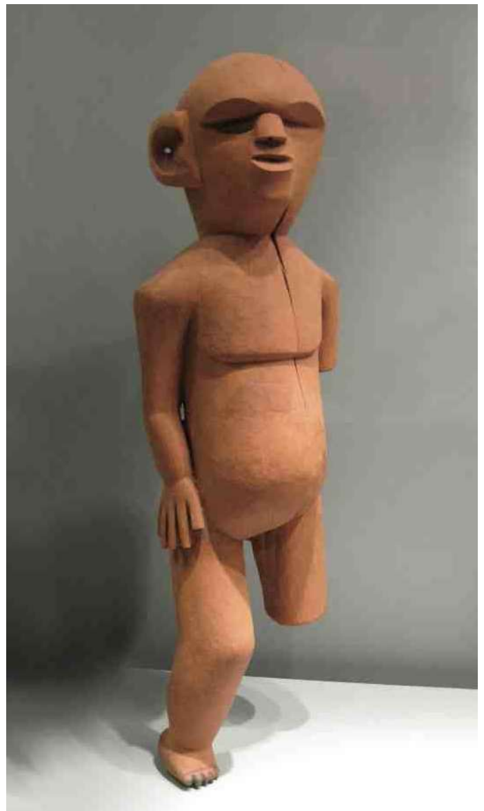
2. bosgeest van de Mwera uit Tanzania

Zo’n kring deed me denken aan een ‘heksenkring’, niet die van paddenstoelen, maar zo een als je op zeventiende eeuwse prenten en schilderijen kunt zien (afb 1), zo’n kring waarbinnen men zich toen veilig voelde om magie te bedrijven. De magiër Hermogenes, in de legende de tegenstander van de heilige Jacobus, bedrijft hier (afb 1b) zijn toverkunsten zittend in zijn tovercirkel. Het laat zich raden, dat de Christelijke magie van Sint Jacob natuurlijk sterker bleek dan de kunsten van Hermogenes. Daarbij is op dit schilderij te zien, dat ook goochelen en acrobatiek nog in de zeventiende eeuw tot de ‘magie’ werden gerekend, “want mensen die zulke kunsten uitoefenen konden geen gewone mensen zijn”. Zo’n toverkring gold tevens als bescherming juist tegen boze krachten. Die parallel tussen heksenkringen en deze askringen bleek zo gek nog niet, want ook deze Afrikaanse askringen bleken een maatregel die iedereen had genomen tegen de dreiging van een kwade genius. Het bleek te gaan om een soort heks, “de vrouw met 1 oog, 1 oor, 1 borst, 1 arm en 1 been”. Deze vrouw zou uit het oosten komen en ging langs deze weg; zij zou alle huizen bezoeken en elk oudste kind doden. “Wat een onzin”, dachten we, en zo spraken we er over, natuurlijk in wat bedekte termen.