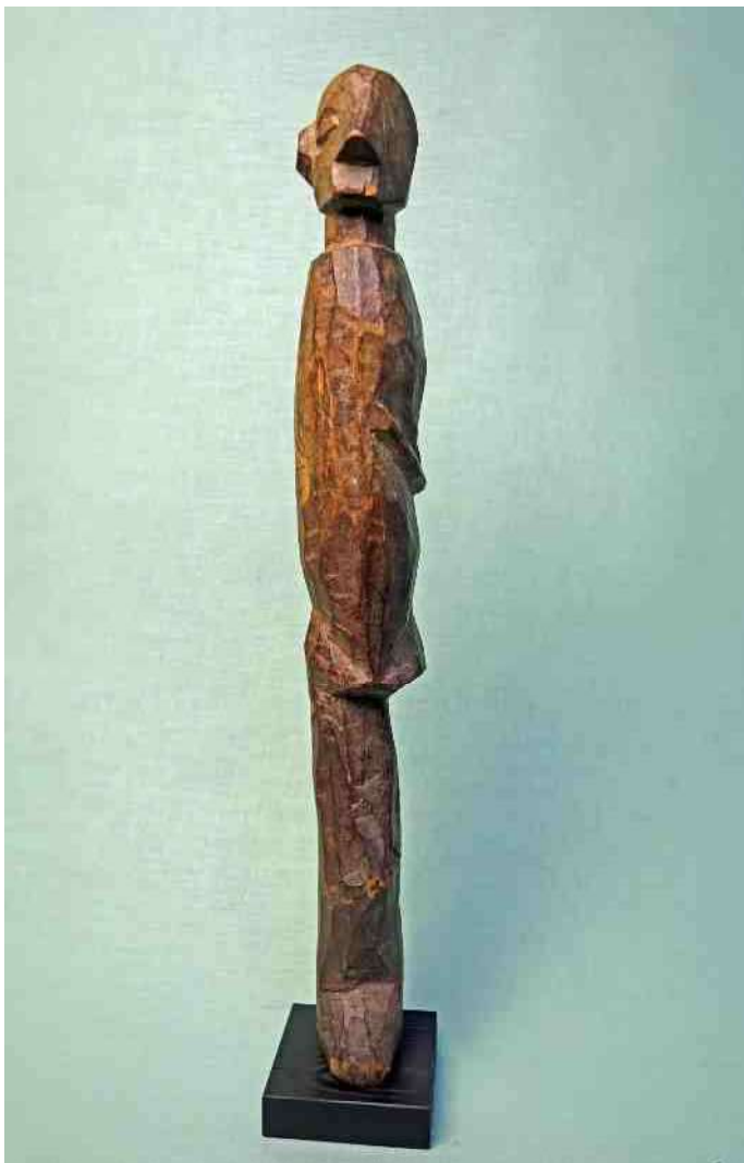
6. Yaka - h 42 cm - mist links zijn been, oog & oor én rechts zijn arm

Echt een gemis, dat we van de bijpassende verhalen zo weinig weten, maar ik was al blij hierover tenminste iets te kunnen lezen [1] bij de Yaka. Bij het Konkomba volk in Togo lukte mij dat nog niet. Van hen staat er een beeldje geëxposeerd in een van de kleine vitrines in de cirkelruimte van het Afrika Museum – of beter gezegd een half beeldje (afb 8). Want het is echt ‘half’, overlangs gehalveerd, net zoals Karel de Grote volgens mijn schoolboekje een vijand in tweeën kon splijten met zijn machtige zwaard. In de digitale collectie van dit museum trof ik naast dit beeldje (afb 9, tweede van rechts) in een rij van wel achttien Konkomba beeldjes nóg zo'n half beeldje aan (afb 9, negende van rechts). Wat opvalt is, dat deze groepsfoto in spiegelbeeld op de AM-website staat. Aan veel van de andere beeldjes mankeert ook het een en ander, niet door beschadiging