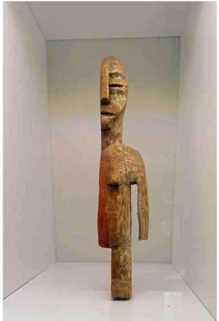
8. letterlijk 'half' beeldje van de Konkomba (Togo), zoals opgesteld in vitrine in het Afrika Museum