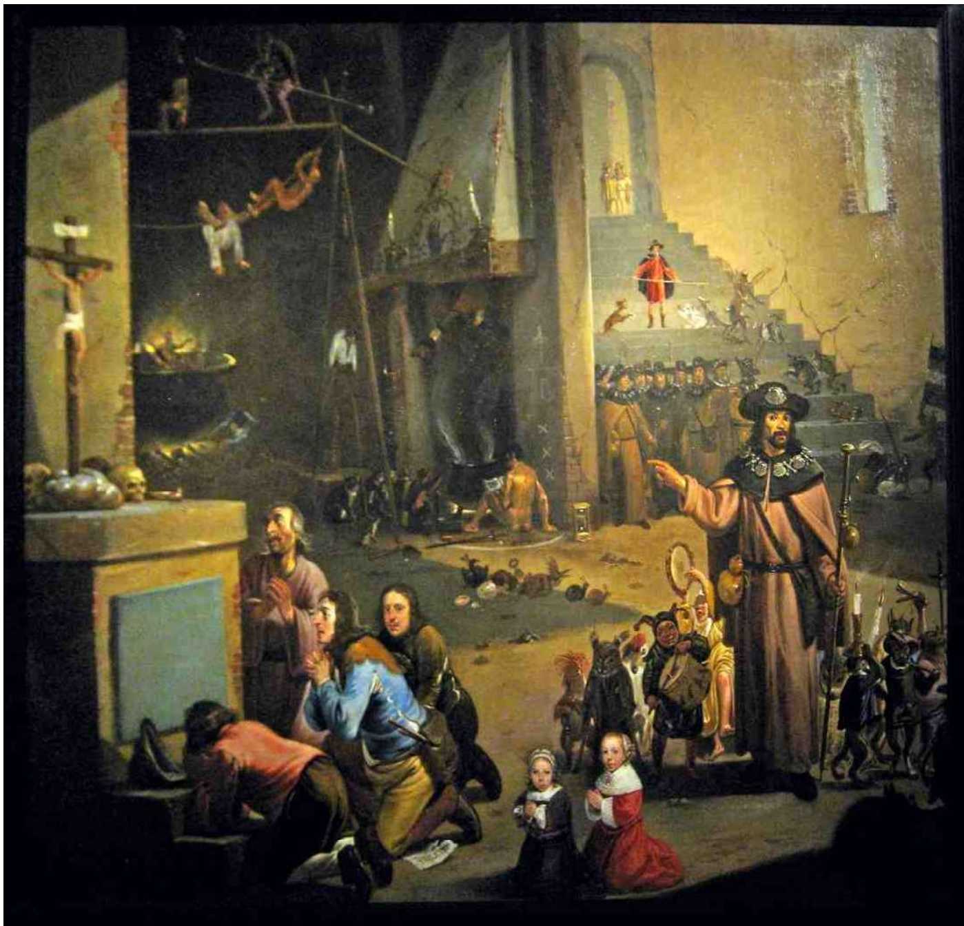
1. Het schilderij Jacobus en Hermogenes , toegeschreven aan Cornelis Saftleven (1607 - 1681)