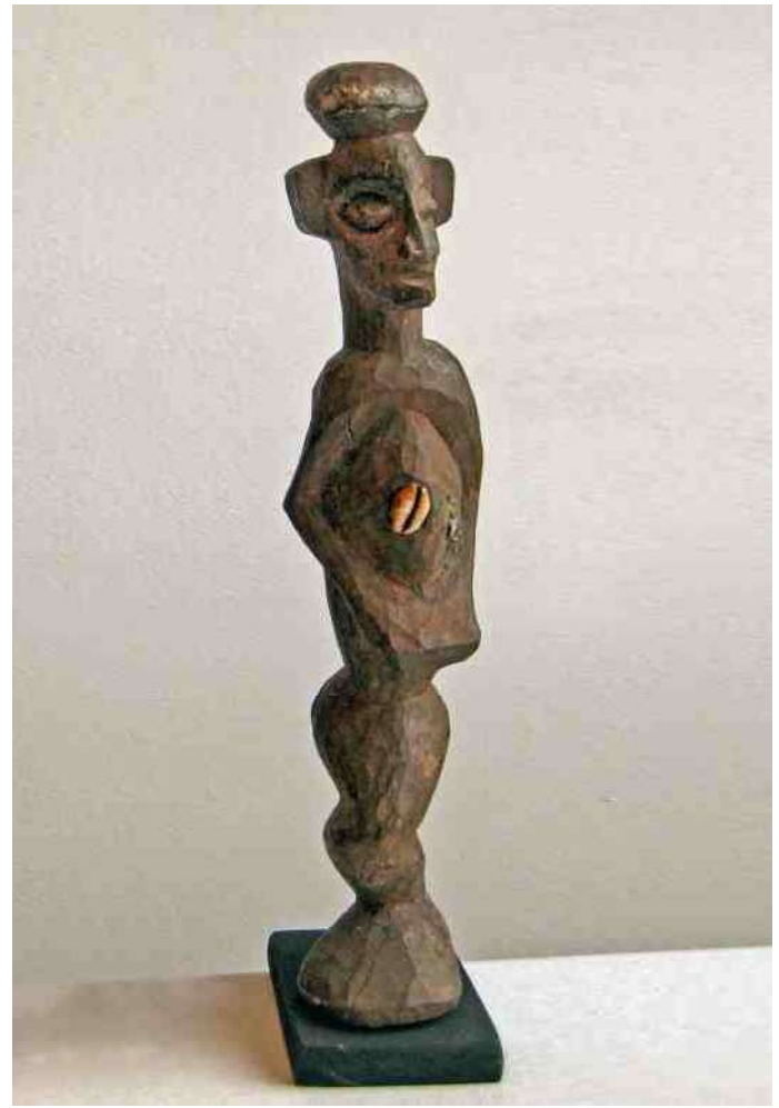
4. Kambamba in de Buijtensael, h 16,5 cm

onze hulpen, 'die askring had toch maar goed gewerkt!'. 'En ons huis zónder askring dan?' vroegen we. 'Ja, maar jullie zijn wit, en als witten hebben jullie natuurlijk jullie eigen tegenkrachten die jullie voldoende bescherming bieden'. Tja, daar hadden we niet van terug.