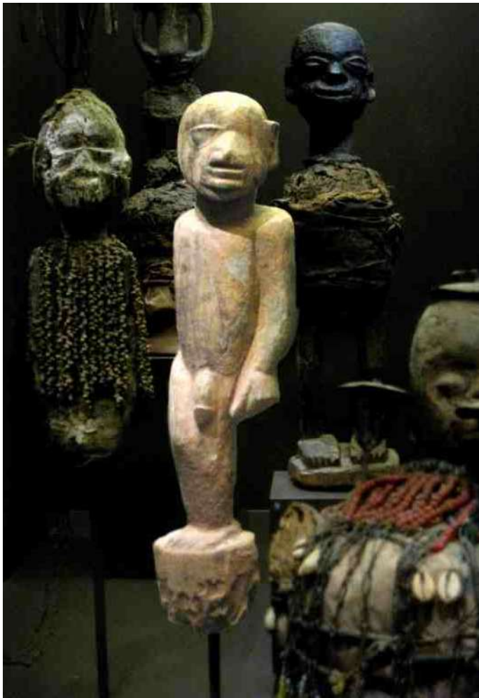
3. De eenbenige Fon-god Age, beschermheilige van de jacht en van de kunst - hier in de veilige omgeving van het Afrika Museum - h 52 cm