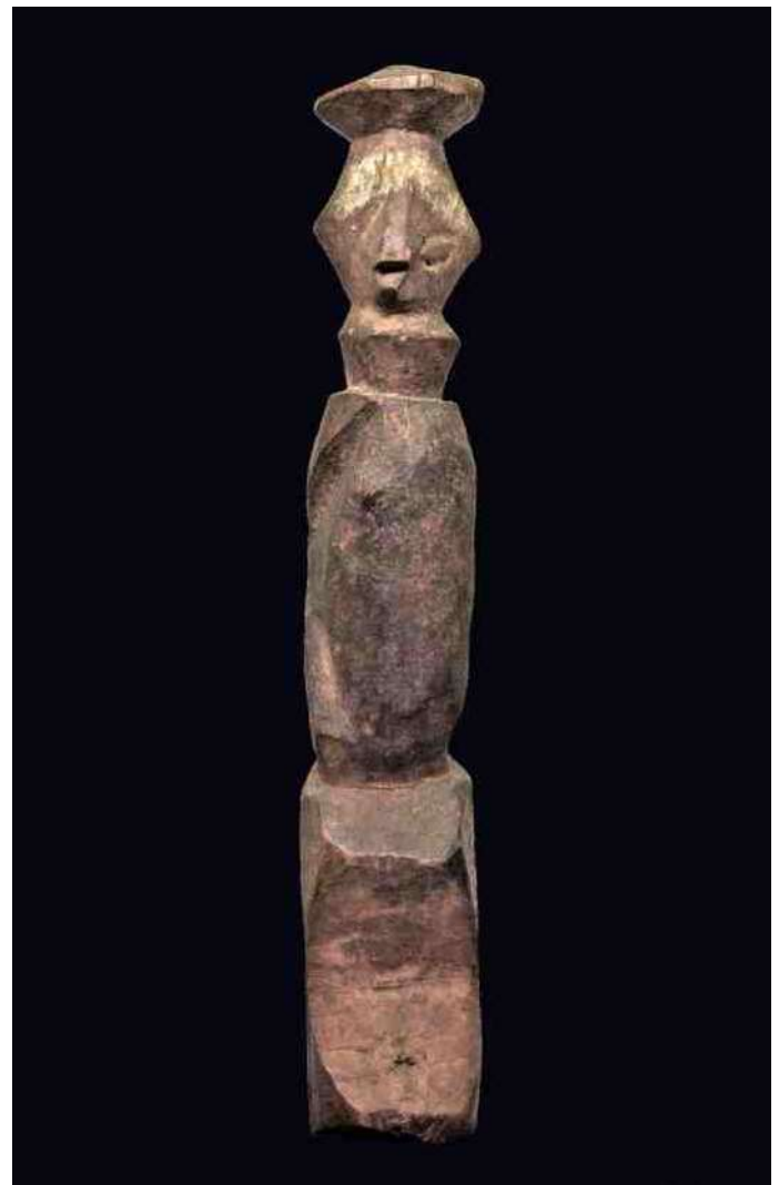
7. Yaka - h 23 cm - mist rechter oog en linker arm, én de linker borst – maar lijkt wel twee benen te hebben