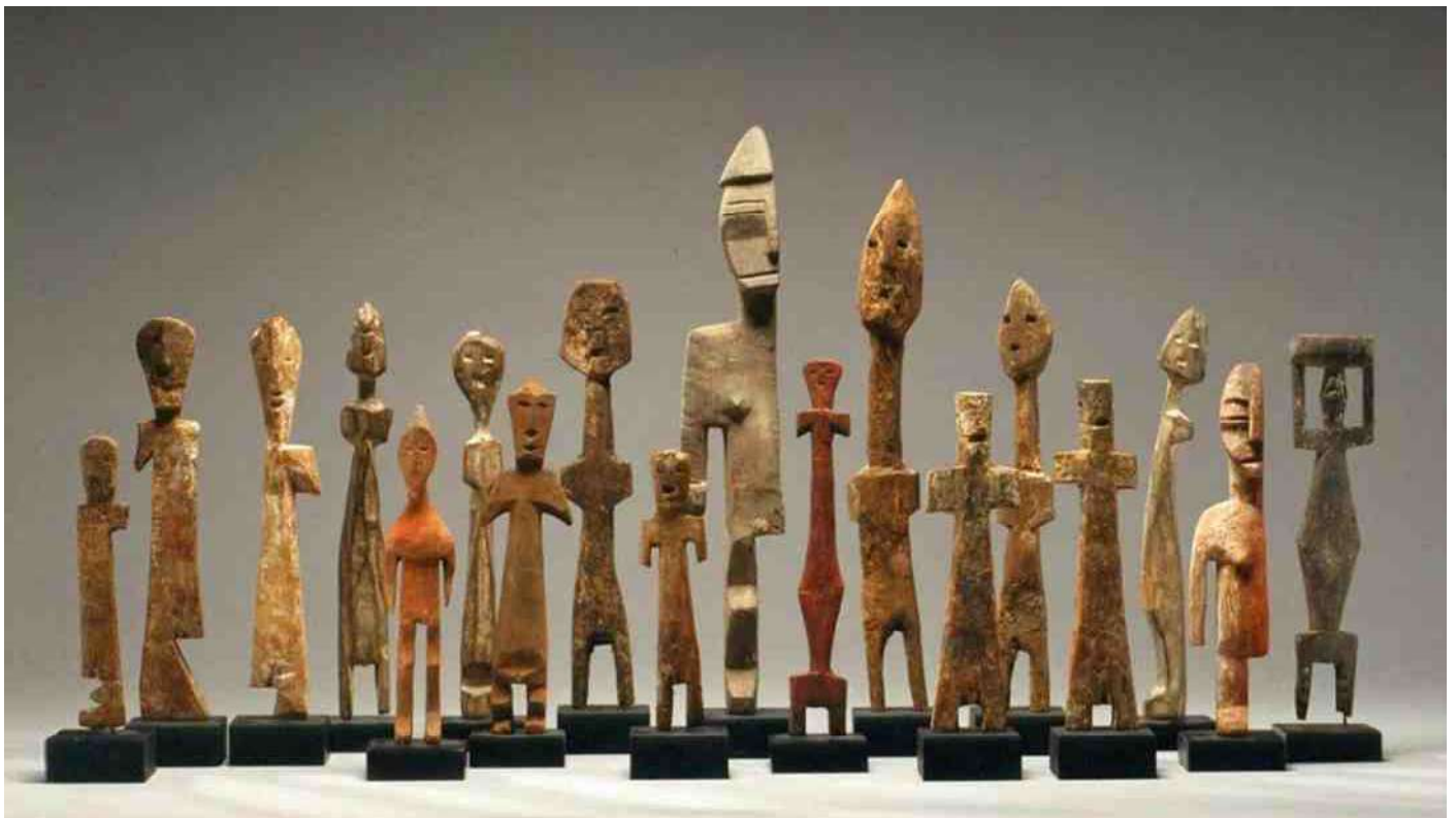
9. De hele Konkomba groep in het Afrika Museum. Allerlei ledematen 'ontbreken'. Afb 8 is het 2e beeldje van rechts (maar in de digitale collectie van het AM dus wel in spiegelbeeld ...)