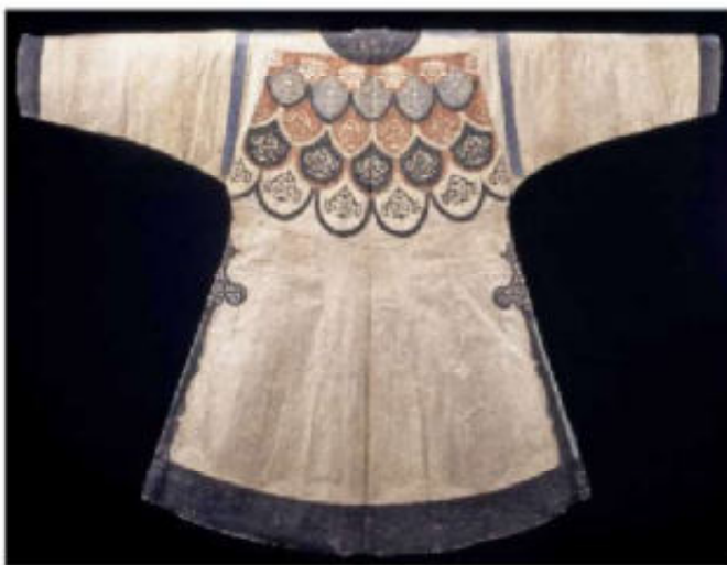
7a. Jas voor een Nivch vrouw. Deze is rond 1900 vervaardigd uit zo'n 60 zalmhuiden.

al van afstand wist met een man of vrouw te doen te hebben. De hemden hadden een schuine voorsluiting hetgeen de Chinese invloed verraadt. Als naaigerei werden priemen en naalden van bot of ivoor gebruikt (later staal). Als garen had men neteldraad, katoen en hennep, maar ook repen vissenhuid, pezen en darm. Een kledingaspect, dat echt bijzonder was voor de Nivchi (en buurvolken), was het gebruik van de huid van zalm en karper (afb 7a). Deze vissenhuid [1] is zeer geschikt voor het maken van soepele kleding, omdat het waterdicht is en optimale bescherming biedt bij regen. Zalmhuiden werden voor ze gebruikt konden worden met houten kloppers bewerkt, ontschuld, gespoeld en opgespannen gedroogd. De vrouwen naaiden een groot aantal huiden in een symmetrisch patroon aaneen en daarop werden zowel aan voor- als achterzijde stukken geverfde vissenhuid geapliceerd (afb 7b). Het was zo'n kenmerkend kledingstuk dat de Chinezen, hen zelfs 'vissenhuidbarbaren' noemden. Meestal waren die applicaties er met vislijm op bevestigd. Deze fraai met arabesken, vissen, vogels en symbolische motieven versierde jassen werden door vrouwen gedragen, vooral in de zomer als buitenste laag. Ook hun hoeden van berkenbast (afb 8) waren met zulke applicaties versierd. Schoenen en laarzen werden van vissenhuid of onthaard zeerobbenleer gemaakt. Het was niet alleen belangrijk, dat dit materiaal sterk en waterdicht was, maar het moest ook stroef zijn voor op het ijs.