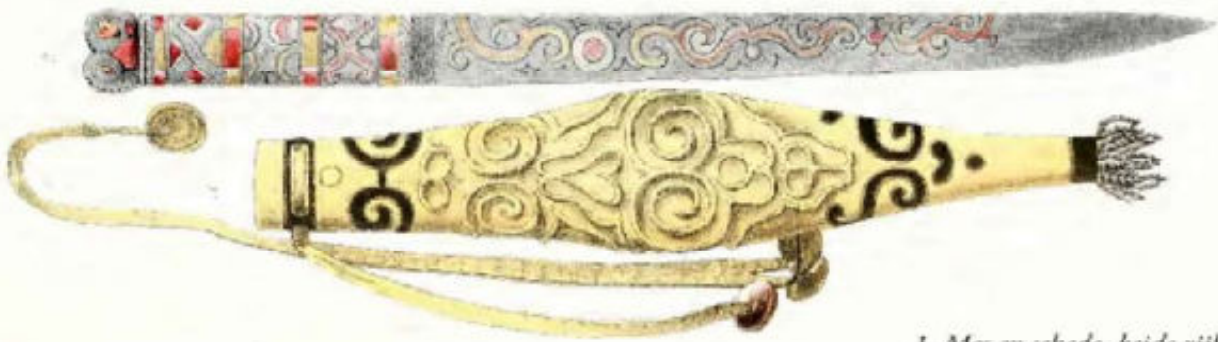
1. Mes en schede, beide rijk versierd