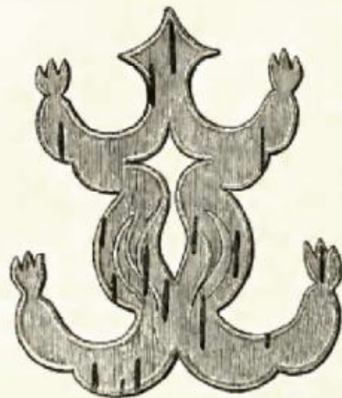
12. Op het raam: Een pad, gesneden uit berkenbast.