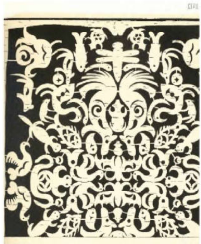
10. Uit berkenbast gesneden sjablonen voor het beschilderen van applicaties.

Vogels zouden ook nauw verbonden zijn met de ziel. En als zodanig is een vogel vaak afgebeeld op een trouwjurk, waar hij de gereïncarneerde ziel van een ongeborn kind weergeeft. Een levensboom trof men vaak aan op de rug van een vissenhuidjas, om de vrouwelijke draagster tegen geesten te beschermen. Verder waren sierlijke krullerige, Arabisch aandoende borduursels zeer in zwang, vooral langs zoomen, zijnde de markering van openingen via welke kwade geesten binnen zouden kunnen dringen. De gebruikte motieven moesten hen afweren. Jachtkleding en -attributen waren versierd om de geesten van prooidieren gunstig te stemmen (afb 1).