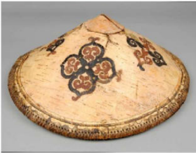
8. Zomerhoed man. Berkenbast + beschilderde applicaties

's Winters werd een knielange dubbellagige pelsjas gedragen van hondenbont dat lange haren heeft en daardoor zeer warm is. Het bont van de binnenste laag was naar binnen gericht, de buitenste naar buiten. Hondenbont had voor de pelshandel geen waarde en was dus ruimschoots beschikbaar voor eigen gebruik [1]. Tijdens de jacht werd over diverse lagen andere kleding een rokje en een kort jak zonder capuchon gedragen, gemaakt van zeehondenbont. En daarbij droegen ze een bontmuts. Overigens was voor vrouwen een muts van een lynxhuid bij speciale gelegenheden het meest begeerlijk. Deze werd zo gedragen, dat de oren van het dier omhoog stonden en de staart naar beneden hing [1].