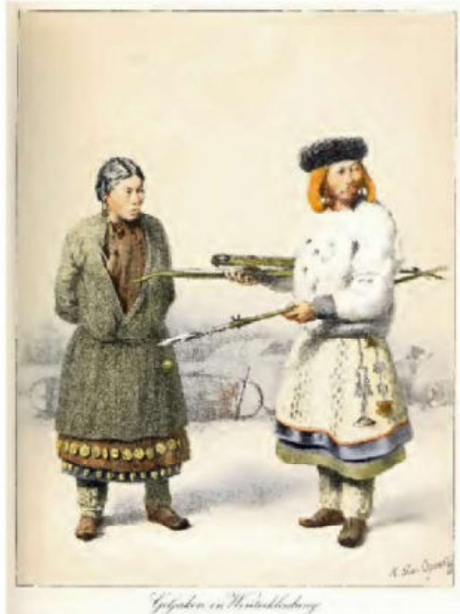
5. Nivch man en vrouw in winterkleding. De vrouw draagt 2 lagen katoenen onderkleding (met messing plaatjes aan de onderzoom). Overjas van vissenhuid.