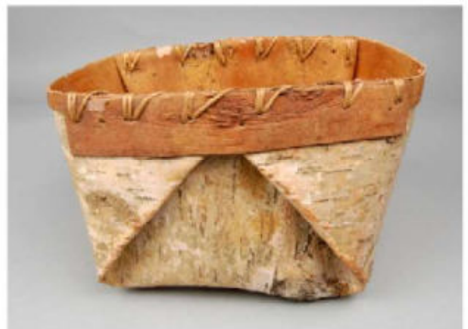
2. Berkenbastbak van de Nivch

Het wintermenu, voornamelijk bestaande uit gedroogde zalm en daarnaast vlees van voornoemd wild, maar ook van zeerobben, eenden en zeeleeuwen, werd aangevuld met de in het najaar in berkenbastbakken (afb 2) verzamelde en ingevroren bessen en eetbare plantendelen. Door de contacten met Chinezen en Japanners kende men al lang het gebruik van producten als zout, suiker, rijst, gierst, bonen en thee.