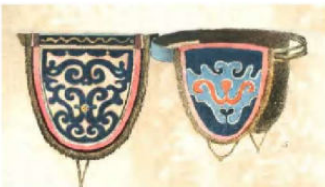
9. Bonten oorwarmers, afgewerkt met katoenen versiering

De Nivchi waren dus bekend om hun vissenhuid, maar zeker ook om hun fraaie applicatie-werk. Versieringen waren niet bedoeld om het menselijk oog te strelen, maar hadden tot doel de geesten en dan vooral de geesten van de dieren, die onmisbaar waren om te overleven, gunstig te stemmen. De versieringen werden