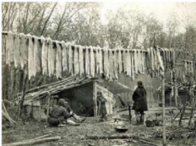
4. Het drogen van zalm (yukola)

waard werd in zeehondenblazen en -magen [8]. Traan werd gebruikt voor consumptie en verlichting. Bij deze manier van verwerken bleef een grote hoeveelheid visafval over die eveneens gedroogd werd en als voedsel voor de sledehonden werd gebruikt. De gedroogde vis werd uiteraard gegeten, maar was ook een belangrijke ingrediënt van het favoriete Nivch gerecht dat 'Mos' ('Mossj') heet [4,8]. De gedroogde vis werd fijnge maakt en gemengd met vissenhuid, water, zeehonden vet en bessen tot een dikke brij ontstond, zo dik, dat deze afgekoeld zelfs in plakken gesneden kon worden.