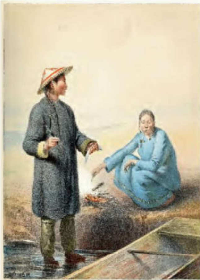
6. Nivch man en vrouw in zomerkledij. Berkenbasthoed

al van afstand wist met een man of vrouw te doen te hebben. De hemden hadden een schuine voorsluiting hetgeen de Chinese invloed verraadt. Als naaigerei werden priemen en naalden van bot of ivoor gebruikt (later staal). Als garen had men neteldraad, katoen en hennep, maar ook repen vissenhuid, pezen en darm. Een kledingaspect, dat echt bijzonder was voor de Nivchi (en buurvolken), was het gebruik van de huid van zalm en karper (afb 7a). Deze vissenhuid [1] is zeer geschikt voor het maken van soepele kleding, omdat het waterdicht is en optimale bescherming biedt bij regen. Zalmhuiden werden voor ze gebruikt konden worden met houten kloppers bewerkt, ontschuld, gespoeld en opgespannen gedroogd. De vrouwen naaiden een groot aantal huiden in een symmetrisch patroon aaneen en daarop werden zowel aan voor- als achterzijde stukken geverfde vissenhuid geapliceerd (afb 7b). Het was zo'n kenmerkend kledingstuk dat de Chinezen, hen zelfs 'vissenhuidbarbaren' noemden. Meestal waren die applicaties er met vislijm op bevestigd. Deze fraai met arabesken, vissen, vogels en symbolische motieven versierde jassen werden door vrouwen gedragen, vooral in de zomer als buitenste laag. Ook hun hoeden van berkenbast (afb 8) waren met zulke applicaties versierd. Schoenen en laarzen werden van vissenhuid of onthaard zeerobbenleer gemaakt. Het was niet alleen belangrijk, dat dit materiaal sterk en waterdicht was, maar het moest ook stroef zijn voor op het ijs.