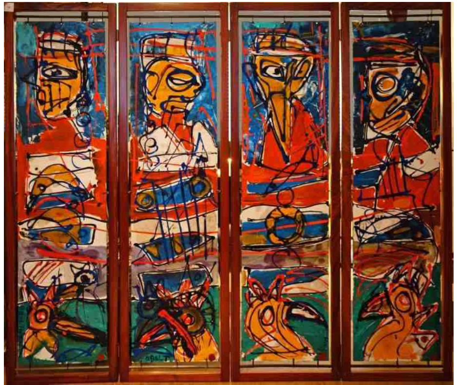
Kamerscherm "Birds of Senufo", elk deel 170x47 cm, dubbelzijdig beschilderd