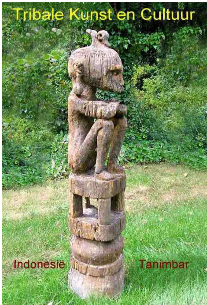
2. Ongewoon groot voorouderbeeld, Tanimbar, h 135cm