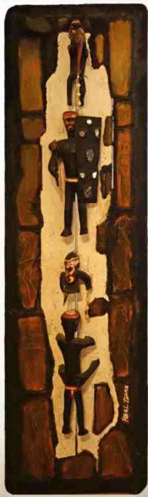
5. "Behind Mirrors and Beads", 60x210 cm