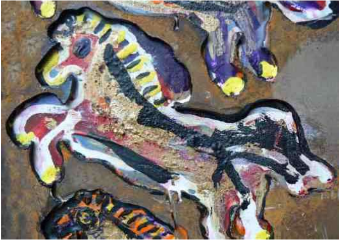
6. "Paardjes van Lombok", in staalplaat - 25x40 cm

en krisen. Dat begrepen ze, en ze zeiden toen:” wacht hier, over twee dagen kom ik terug”. Na twee dagen kwamen ze dan terug met tassen vol objecten die leken op wat ik ze op die foto’s had laten zien. Het voelde toen toch wel wat gênant, want het was nou ook weer niet mijn bedoeling om ze van hun persoonlijke spulletjes te ontdoen. Dat bleek echter geen probleem te zijn, want de familie had geen belangstelling meer getoond voor die oude zaken.