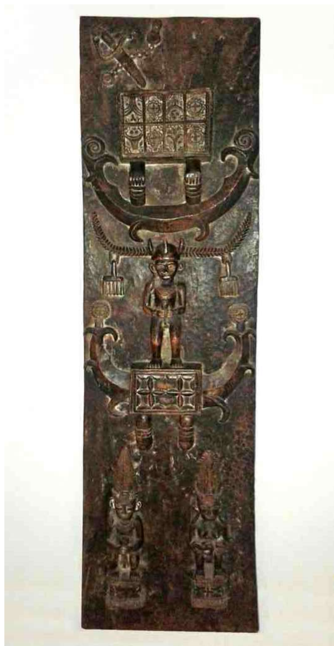
9. Mooi bewerkte deur van het eiland Nias - 55x202 cm