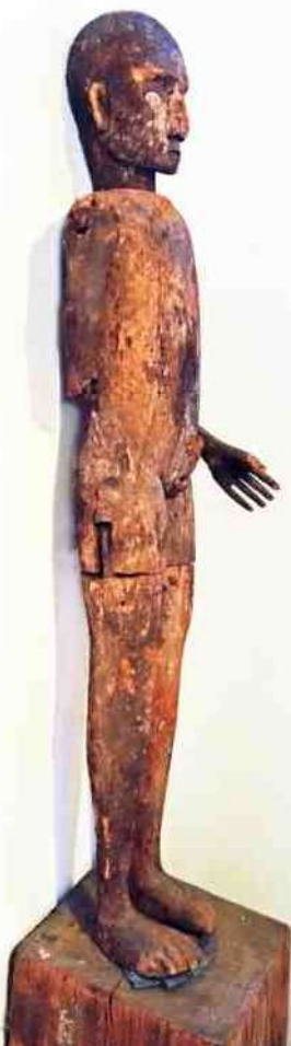
4. Tautau beeld - h 155 cm Toraja, Sulawesi

Later ben ik in Jogjakarta geweest en heb ik de Borobudur bezocht, indrukwekkend mooi. En daarna in Soerabaja probeerde ik al wat authentieke dingen op de kop te tikken. Dat viel niet mee in die grote steden. Maar toen ik eens met een bootje de rivier op ben gegaan, zodat je in kleine dorpen komt waar de meeste toeristen niet komen, toen kwamen mensen daar naar me toe om een praatje te maken. Ik vertelde dan dat ik uit Nederland kwam en liet ze foto's zien van beeldjes