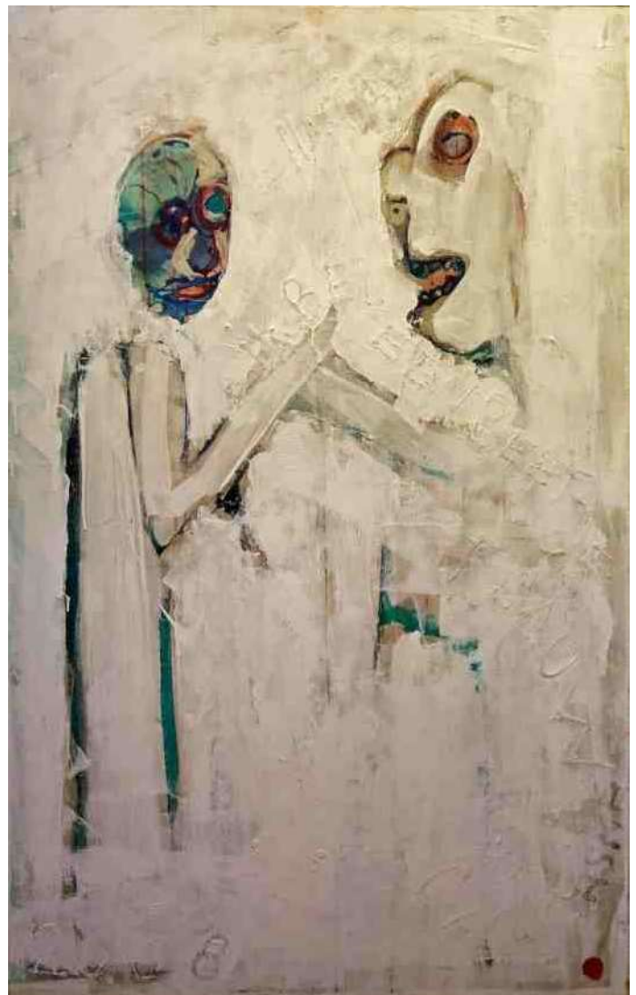
3. "Meeting India", olieverf op canvas, 100x160 cm