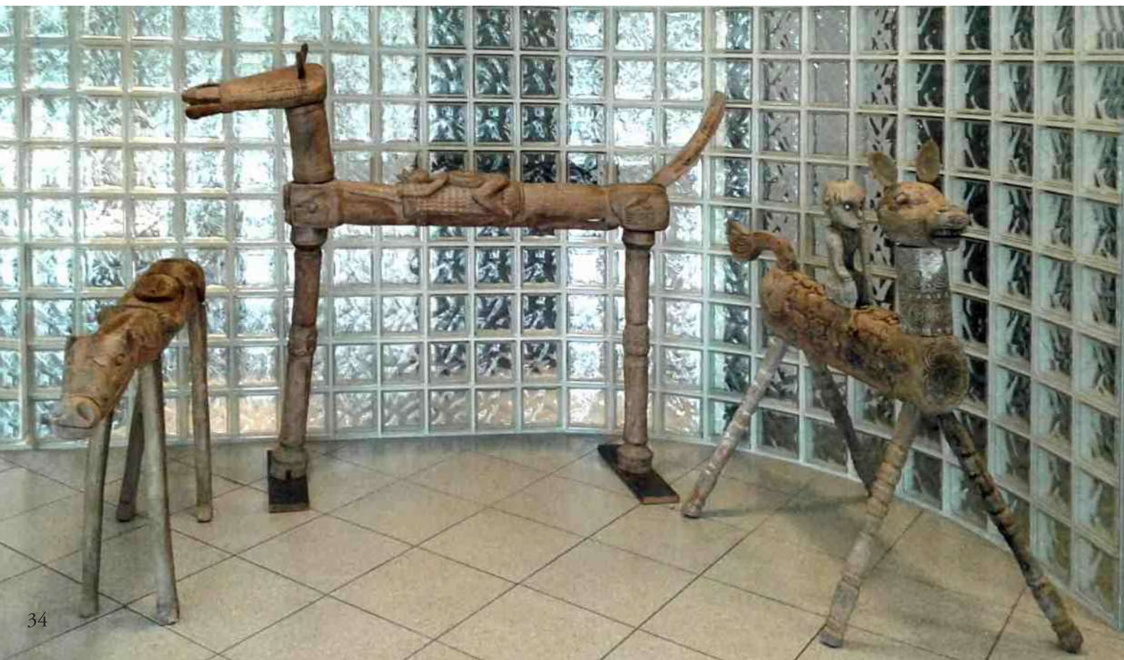
11. Drie houten paarden van Flores - de grootste heeft een hoogte van 158 cm