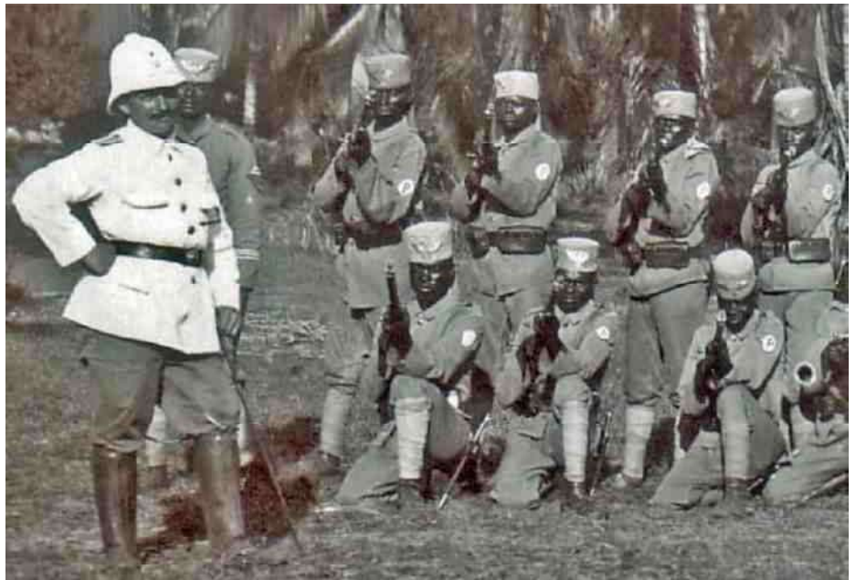
10. Duitse politie-Askari na 1906: slechts nog een 'P'(behalve de muzikanten)

De Duitse koloniale geschiedenis doet in gruwel niet onder voor de onze. De Askari vervulden bij de Schutztruppe eenzelfde rol als de aan de Nederlandse koloniale overheid trouwe Molukkers in het KNIL. Maar werkelijk bizar vond ik dat stukje Eerste Wereldoorlog, met de ene zwarte mens in Duitse krijgsdienst, die ten behoeve van een krijgstoneel in het verre Europa, de andere zwarte mens in Afrika moet vermoorden, omdat die toevallig in Britse (en elders ook Belgische en Franse) krijgsdienst was – kronkelpaden van de geschiedenis. Maar de rol van ingehuurd/ingelijfde zwarte soldaten kent dus een langere geschiedenis dan 1914-'18, en beperkte zich ook bepaald niet tot de Duitse koloniën. De Fransen beschikten al vanaf 1857 over een huurlingenleger, de 'Tirailleurs Sénégalais' (afb 11), die bepaald niet alleen uit Senegal afkomstig waren. Koning Leopold II van België richtte in 1885 in 'zijn' kolonie Congo de 'Force Publique' op, een goed getraind Askari leger onder commando van blanke huurlingen, vooral Scandinaviërs [3]. En de Engelsen rekruteerden hun (koloniale) leger (in Afrika 'King's African Rifles' geheten) uit ál hun koloniale gebieden, dus ook uit Azië (afb 12).