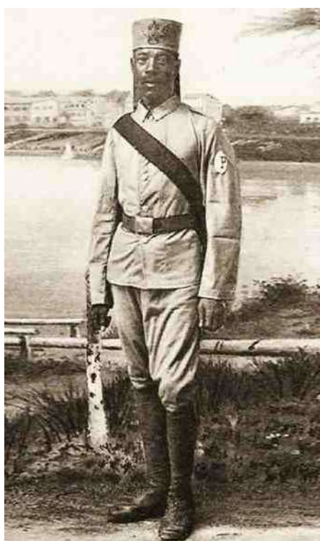
8. Sjerp & letter P hier nog samen.

Chris Paulodale van de German Colonial Uniforms Website mij terug, want die zwaluwnest-epauletten waren, maar dan alleen bij de legermuzikanten (afb 9), nog geruime tijd in gebruik. Onze houten Askari was dus Ombascha (onderofficier) in de politiekapel van de Duitse Schutztruppe in Oost Afrika, en we zullen hem dus toch iets ruimer moeten dateren, tussen 1896 en 1906, of nog iets later. Maar hoe kwam deze houten Askari nu in de handelswaar van Buizerd terecht? Hij bleek gekocht te zijn in Oost Duitsland, kort na de