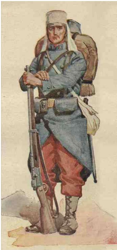
2. Vreemdelingenlegionair rond 1900