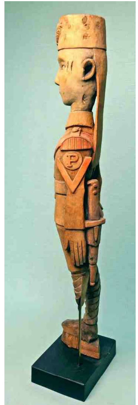
3. h 80,5 cm - Scarificaties links & rechts als stam-teken. Daarbij ook allerlei militaire emblemen.

voor zijn manschappen (afb 5). Nu de Blitzkrieg in Europa niet langer meer 'frisch und fröhlich' was en de strijdende partijen zich daar steeds verder ingroeven, wilde Von Lettow toch zijn best blijven doen om het verdere beloop van de oorlog ten faveure van de Duitsers te beïnvloeden. Met aanvallen op het noordelijker gelegen Britse Oost-Afrika wilde hij zoveel mogelijk Britse troepen aan het Europese strijdtooneel onttrekken. En dat lukte hem.