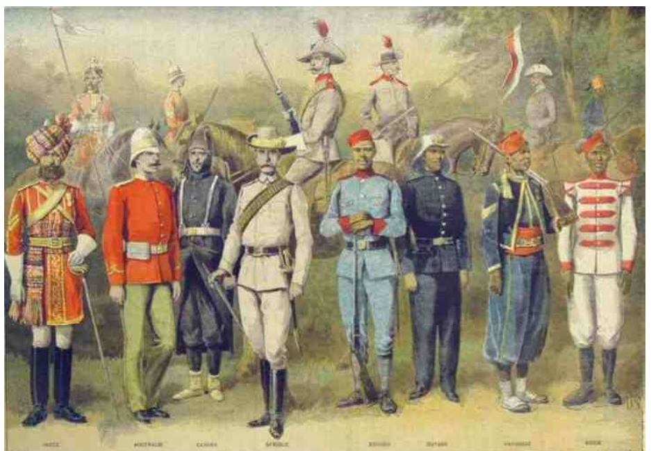
12. Het Britse wereldrijk, vertegenwoordigd in hun verschillende uniformen