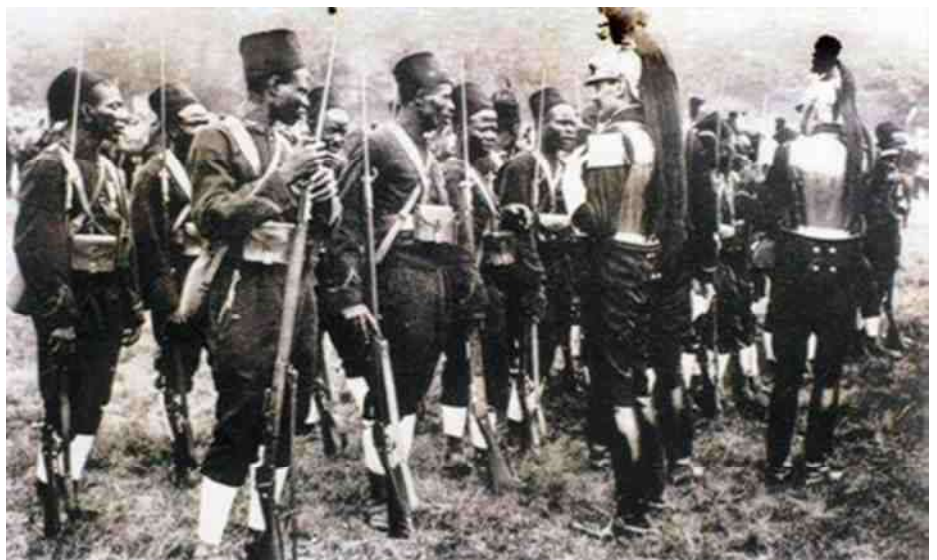
11. de Frans-koloniale 'Tirailleurs Sénégalais'