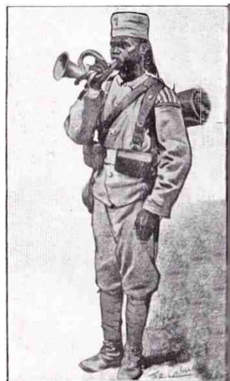
9. Bij muzikanten bleven 'zwaluwnestjes' langer nog in gebruik.