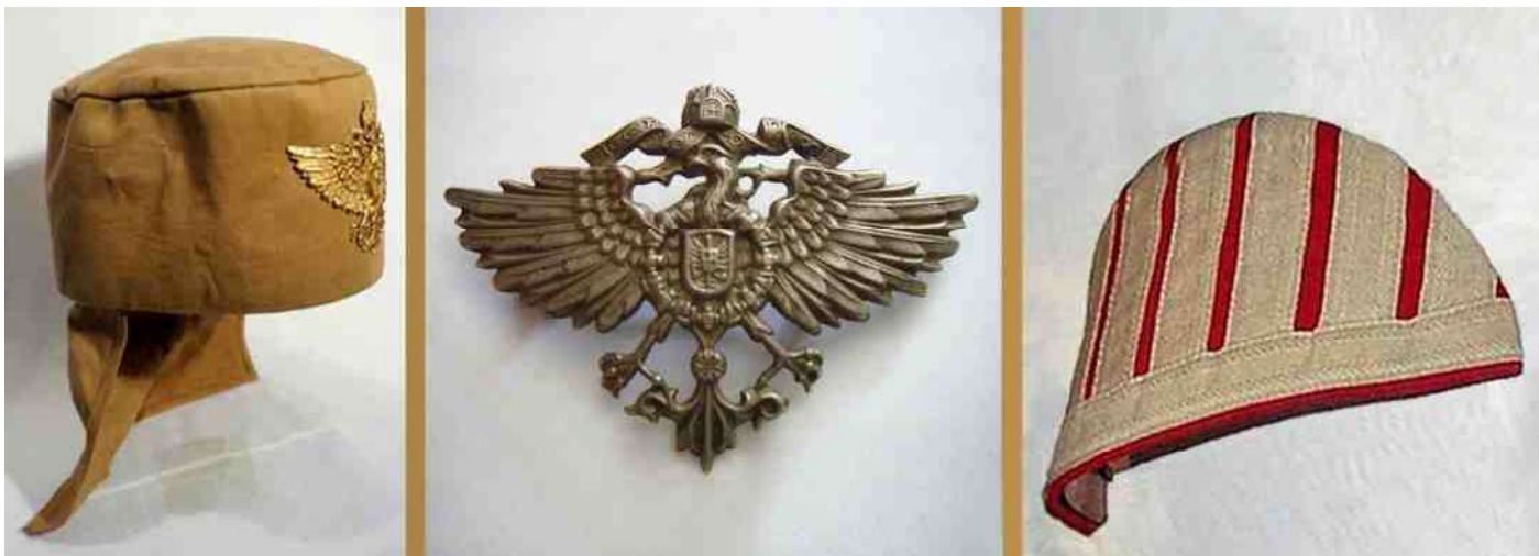
7. Onderscheidingstekens: de pet zelf met het grotere adelaarsembleem, en de 'zwaluwnestjes' als epaulet.

1882 door de Engelsen gekoloniseerd. De Askari van de Wissmann-Schutztruppe droegen nog een fez of een tulband.