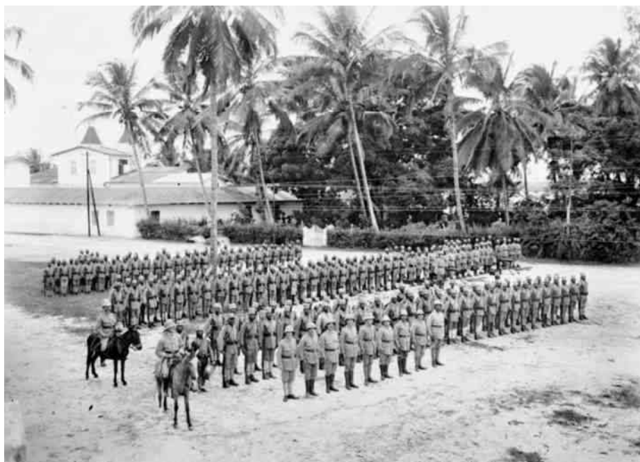
5. Duitse Schutztruppe - vooral veel Askari (en hulpsoldaten).