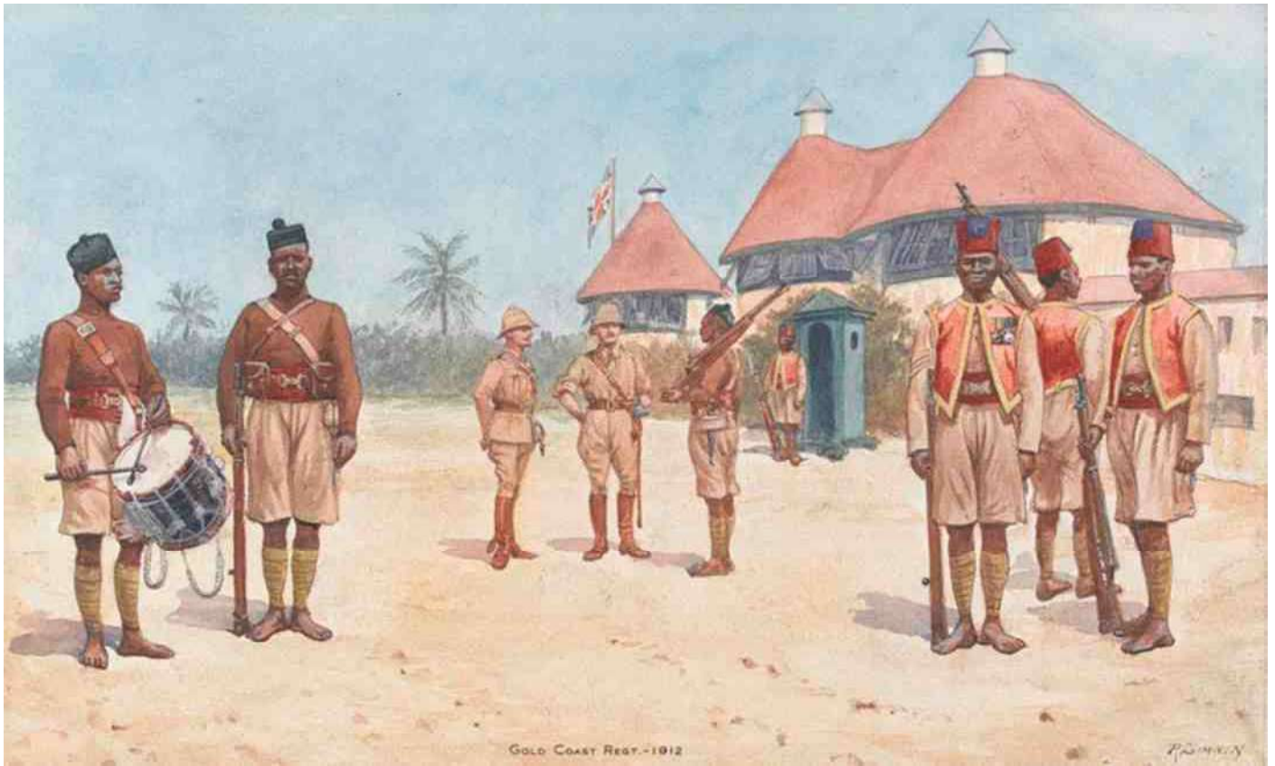
14. "Soldiers of the Gold Coast Regiment outside the regimental Headquarters at Kumasi, 1912" - dit is Ashante ...