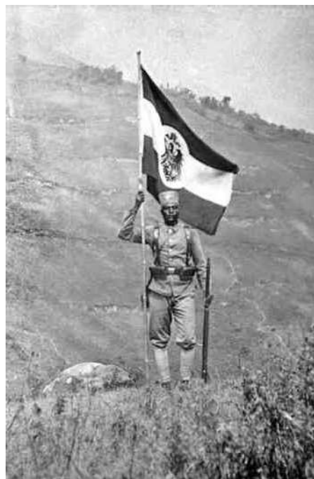
4. Wervende foto met Askari. Hier van werd een getekende kleurenposter gemaakt - een afbeelding daarvan stond in Elsevier.

Niet dat daar nu voor Duitsland cruciale overwinningen te boeken waren, maar wel zag deze generaal, commandant van de 'Schutztruppe' (de naam van het Duitse koloniale leger) een belangrijke rol weggelegd