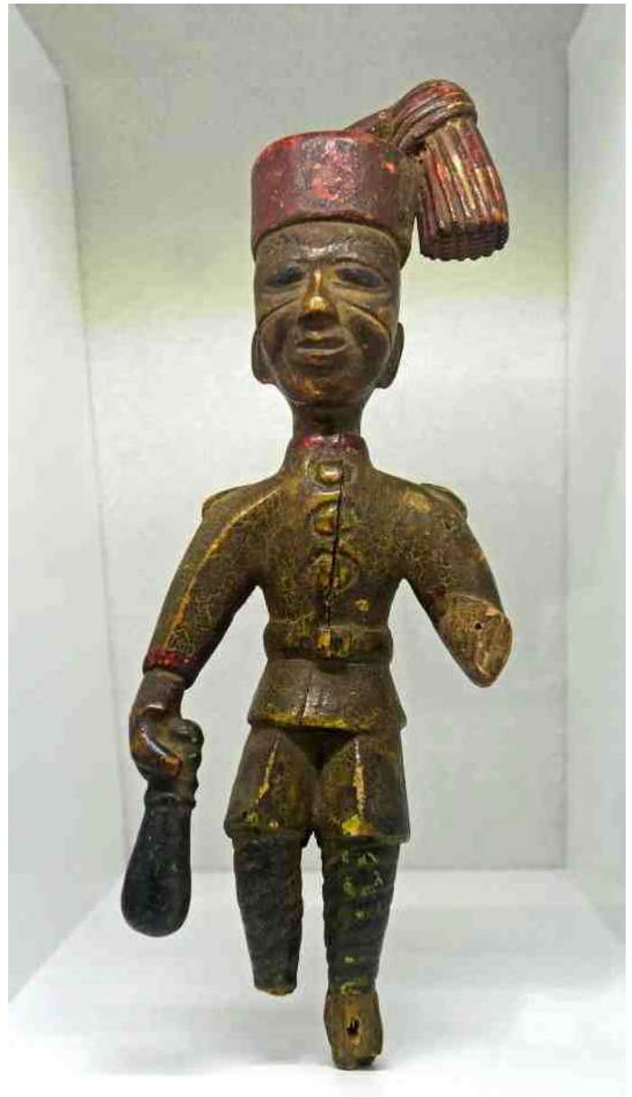
13. "Ashante soldaat (AM 652-5)" - h 20,5 cm Ashante ....., klopt dat wel?

Tot eind 19e eeuw droegen de Britse Askari's in Oost Afrika geen standaard uniform, maar in 1895 werd een duidelijk kledingvoorschrift verordonneerd, vooral voor officieren [9]. Dat soldaat AM een meer oostelijke herkomst heeft dan Gold Coast lijkt voornamelijk dus meer dan waarschijnlijk - vermoedelijk Uganda of Nyassaland. Overigens werd KAR2 in 1911 om economische redenen ontbonden, waarna de Askari-huurlingen uit dit bataljon massaal geronseld werden door de Schutztruppe in Oost Afrika ... Inderdaad vreemde kronkelpaden van de geschiedenis rond WO1. Maar verliep WO2 voor Afrikanen heel anders?