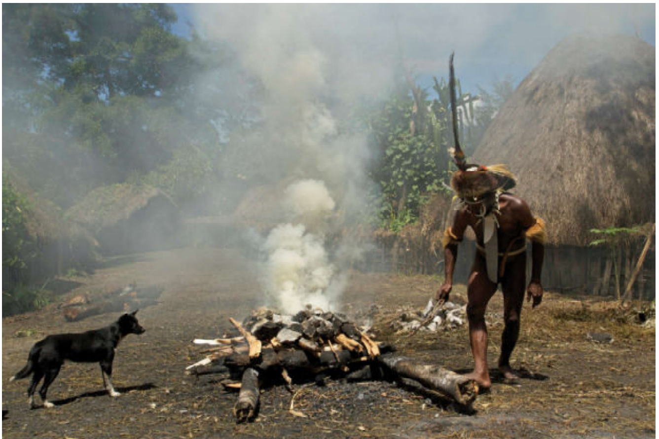
Onder: voorbe- reiding voor het smoren van varkens- vlees op hete stenen.