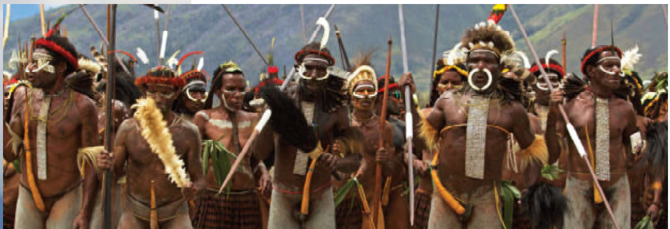
Ook tijdens nagespeelde oorlogen moet er af en toe gebeld worden.

fabriceren van bakstenen. In het langgerekte gebied van ongeveer 70 bij 20 kilometer leven de (Dani-taal sprekende) Papoea’s in kleine gemeenschappen. De mannen verblijven, gescheiden van de vrouwen, in een ronde mannenhut, terwijl de vrouwen en hun kinderen in een rechthoekige hut wonen. Op het grote mid-denterrein scharrelen varkens om de vuurplaats. Op de daken groeit de kalebas, een aan de pompoen verwant gewas, waar de bewoners hun peniskokers van maken. Boven de ingang van het dorp bevindt zich een boogvormig dak van stro en een tot trap bewerkte boomstam biedt de mogelijkheid het dorp te betreden. Deze verhoogde ingang is bedoeld om de varkens ’s nachts binnen het dorp te houden en in het verleden diende hij om vijandelijke acties van naburige stammen te voorkomen.