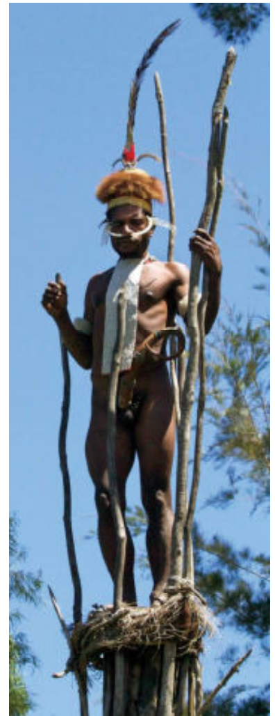
Rechts: bemande uitkijkpost om 'vijandelijke acties' te volgen.

Tot voor kort was de voornaamste lichaamsbedekking voor de mannen een peniskoker. Deze kokers zijn er in verschillende groottes en lengtes. Ze dienen echter niet om het formaat van de inhoud weer te geven, maar zuiver als 'kleding', een man zonder peniskoker voelt zich naakt. De vrouwen dragen op het dijbeen hangende rokjes van gras.