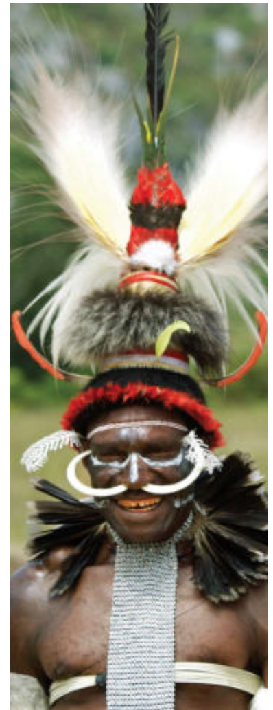
Veren van de paradijs- vogel vormen 'n belangrijk onderdeel van de hoofdtooi.

Voor speciale feesten en festi- vals brengen de verschillende stammen hun tribale lichaams- versieringen aan. Zo is het voor iedere Papoea meteen duidelijk bij welke clan de man of vrouw hoort. Het lichaam is dan gedeeltelijk bedekt met varens, gras, bladeren of bloemen en verfraaid met gekleurd leem of zwart varkensvet. Elegante tooi- en van kippenveren of para- dijsvogels bedekken het hoofd. Veel mannen steken twee tot vier zwijntanden door hun neusschot. Peniskokers, gras- rokjes en grote en kleine schel- pen maken de traditionele outfit compleet. De wereld verandert, maar tijdens het drie dagen du- rende festival geven de Papoea's uit de Baliemvallei weer even uiting aan hun oeroude cultuur. Informatie: smithendriks@planet.nl