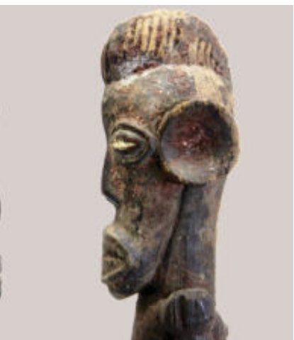
Mfunte Grootte; 42 cm. Materiaal; hout.

met een soort matte poederhuid van volgens mij rood sandelhoutpoeder (tukula) dat gemaakt wordt van camwood ( Baphia nitida ) en in grote delen van Afrika zowel medicinaal als religieus gebruikt wordt. Toen viel het kwartje en mijn gedachten gingen terug naar een reis door Kameroen en onze gids die stralend ver-