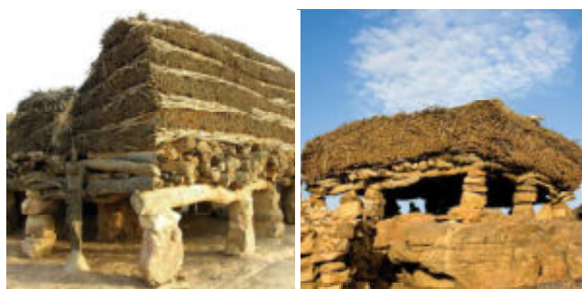
Toguna's in Mali, naamgevers van Pauls galerie.