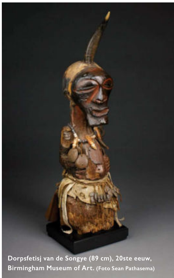
Dorpsfetisj van de Songye (89 cm), 20ste eeuw, Birmingham Museum of Art.

De Kifwebe-maskers stellen geestenwezens, minkishi , voor van onbekende overledenen, die minder machtig zijn dan die van voorouders. De maskers komen voor in diverse vormen. In de oostelijke regio is vooral het klassieke gegroefde masker bekend, dat overigens ook in het westen en zuidwesten kan worden gevonden, maar daar bestaat het dan veelal uit een donker oppervlak met witte groeven. Volgens Hersak (1986) brachten de oostelijke Songye soms in plaats van groeven, brede geverfde strepen aan (afbeelding 1 pagina 8). Zij wijst erop, dat recentere stukken (uit het oostelijke Songye-gebied) er de laatste 20 à 30 jaar toe