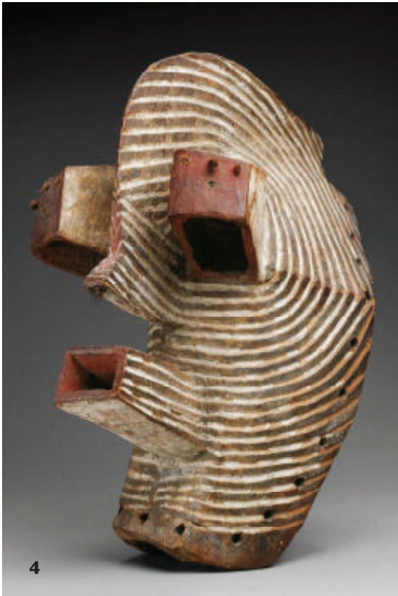
4. Mannelijk Kifwebe-masker van de Songye, 51 cm, begin 20ste eeuw.