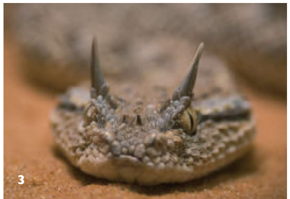
2. Een halfrond Kifwebe-masker van de Luba, Koninklijk Museum voor Midden-Afrika, Brussel. 3. Zandhoornadder ( Cerastes gasperettii )

stortte het politieke systeem van de westelijke Songye in door de komst van bestuursambtenaren, missionarissen en andere westerlingen. Het maskeroptreden veranderde toen in een folkloristische gebeurtenis, slechts bedoeld om de samenhang van de groepen te behouden. De oostelijke groepen bleven langer ongestoord.