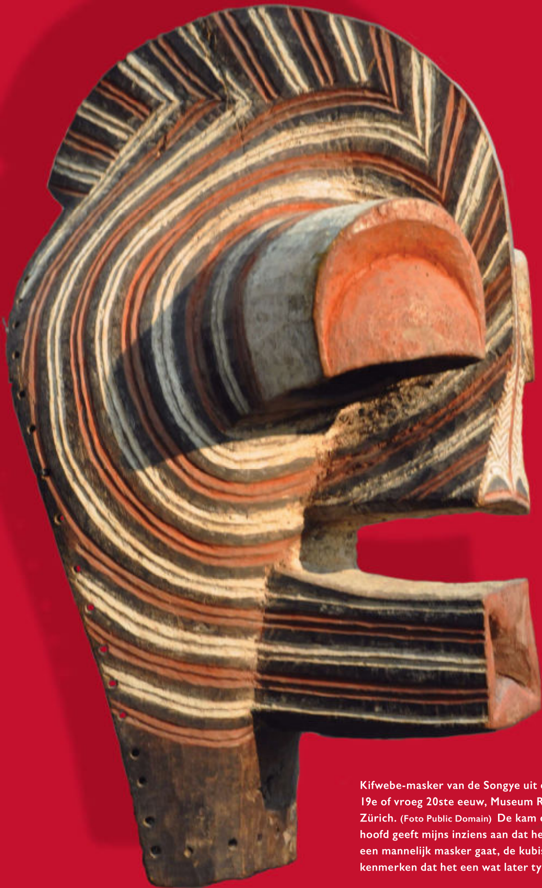
Kifwebe-masker van de Songye uit de laat 19e of vroeg 20ste eeuw, Museum Rietberg, Zürich. De kam op het hoofd geeft mijns inziens aan dat het om een mannelijk masker gaat, de kubistische kenmerken dat het een wat later type is.