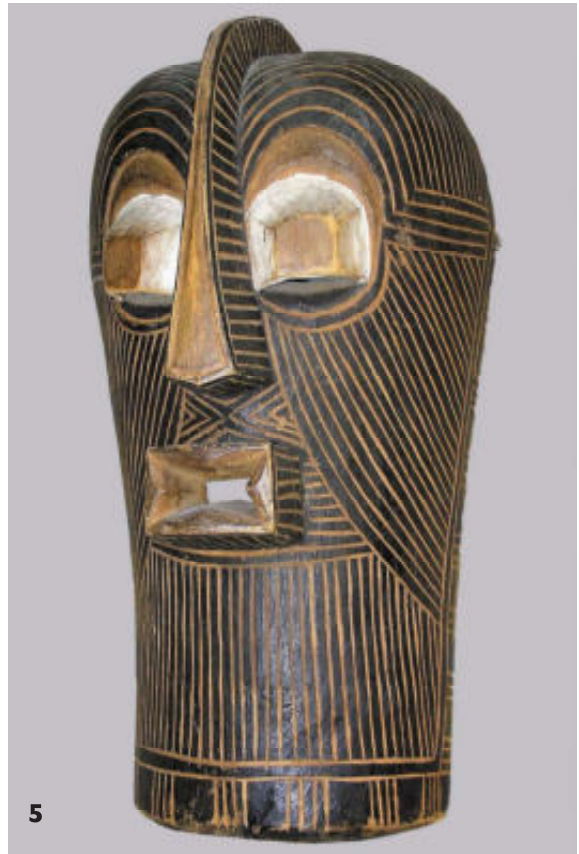
5. Een 38 cm hoog hut- of fetisjmasker (zonder gaatjes!) met de wellicht voor dit type masker specifieke vorm. Mogelijk verzameld rond 1930 of eerder.