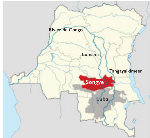
Wikimedia: Uwe Dederig, bewerking André Smit

Leo Frobenius bezocht in de jaren 1905 en 1906 de Songye, in casu de Kalebwe-groep in het westelijke Songye-gebied en schrijft in zijn notities, opgenomen in 'Ethnographische Notizen aus den Jahren 1905