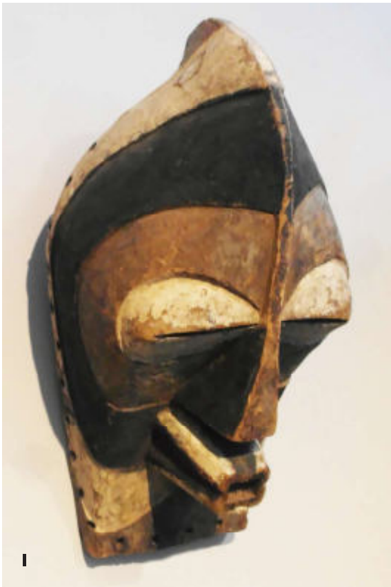
1. Songye masker: Masker met brede, geverfde strepen.