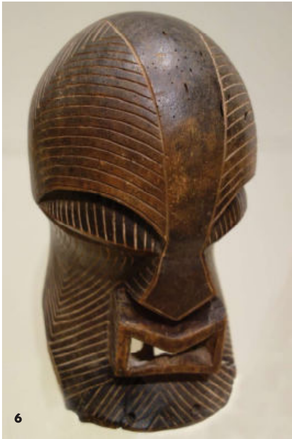
6. Oud, mogelijk vrouwelijk Luba- of Songye-masker, laat 19e begin 20e eeuw Tentoonstelling Cincinnati Art Museum Ohio.