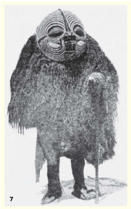
7. Gemaskerde met halfrond Luba-maske In vol ornaat.

door de verschillen moeilijk herkenbaar zijn. Davy (2008) geeft een handvat. Gelet moet worden op het ingesneden groevenpatroon: bij de Songye-maskers bedekken deze strepen het gezicht in een continue en gelijkmatige stroom, die voortdurend lijkt te vloeien; terwijl de strepen, gesneden op de rechthoekige Luba-maskers over het algemeen in compartimenten zijn verdeeld, die vaak meerdere secties op drie gezichtsvlakken omvatten.