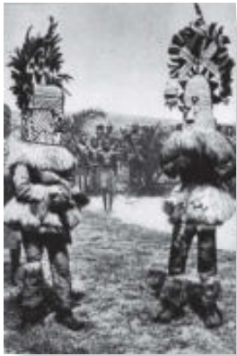
Prentbriefkaart : Missions de Scheut ± 1920

Kifwebe-maskers vormen een zeer boeiende kunstuiting waar wel het een en ander over valt te zeggen, zij het dat er ook nog veel over valt te onderzoeken. De maskers hebben te maken met het Kifwebe-genootschap en worden zowel bij de Songye als bij de Luba (beiden in de Democratische Republiek Congo) gebruikt.