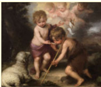
Boven: Jezus en Johannes de Doper als putti, schilderij van Bartolomé Esteban Perez Murillo 1670.